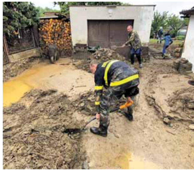
Dalších osm cisteren s pitnou vodou pro obyvatelé záplavou poničeného Šumvaldu.

„V Šumvaldě není vybudovaný vodovod. Obnova dodávky pitné vody