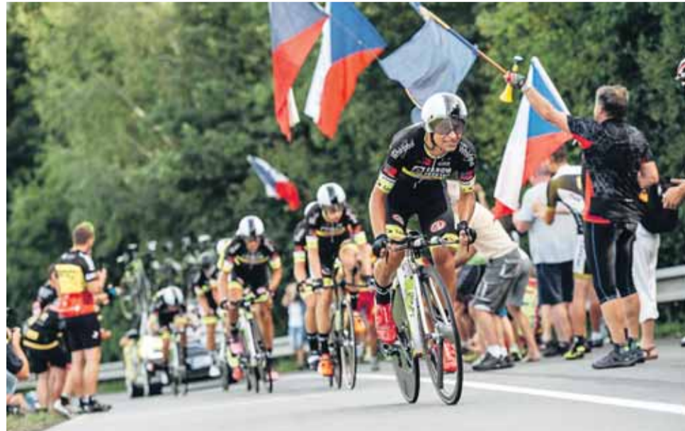
Závodníci diváci opět uvidí na osvědčené trati Uničov - Medlov - Uničov.

Upozornil ještě, že v programu Czech Tour