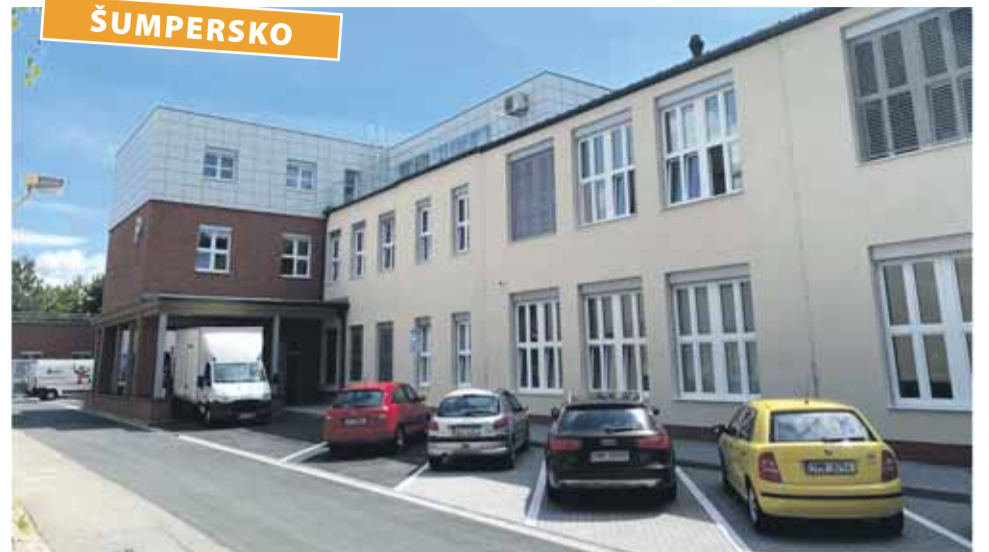
Nemocnice Šumperk otevřela nový pavilon, nabídne 93 lůžek následné péče.

Nové pracoviště vzniklo díky komplexní rekonstrukci pavilonu, ve kterém historicky sídlilo chirurgické oddělení, a které po přesunu do centrální části nemocnice přes 20 let chátralo. „Poptávka po intenzivní ošetrovatelské péči je vysoká. Naše nové pracoviště je svým způsobem díky struktuře poskytovaných služeb, své kapacitě a komplexnosti poměrně ojedinělé,“ řekl předseda představenstva