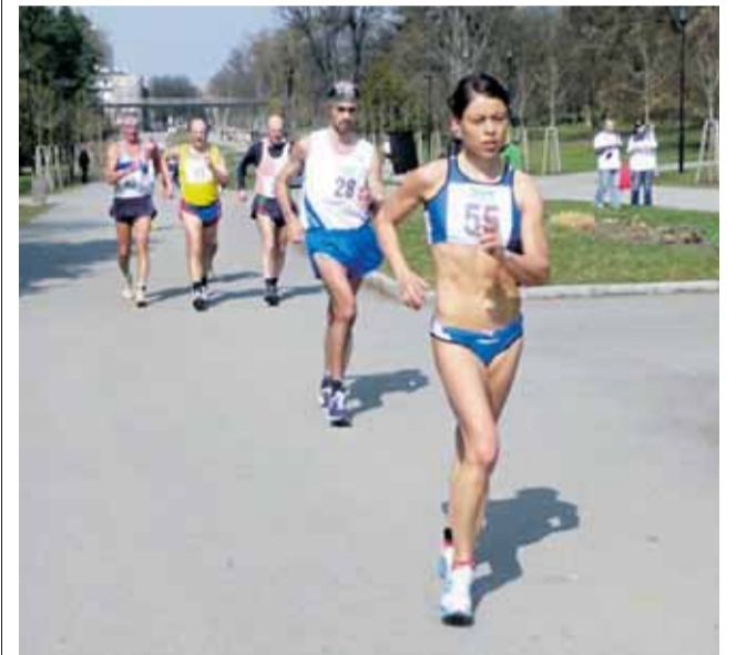
Závody v chůzi se v Olomouci uskuteční už po čtyřiapadesáté.

I. a II. ligy mužů a žen, takže se v Olomouci sejde česká, ale i slovenská špička,“ uvedl Tomáš Dočkal z Atletického klubu Olomouc. Závody začínají v 10 hodin závodem mládeže v chůzi na jeden kilometr a hlavní závod na 10 kilometrů odstartuje v 11.30. (red)