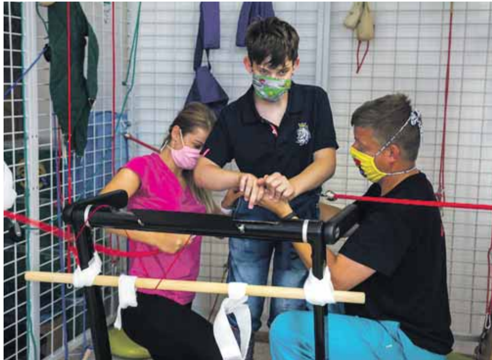
Kraj pomůže rodinám dětí s neurologickým onemocněním. Příspěje na jejich rehabilitaci.

Asociace rodičů dětí s dětskou mozkovou obrnou a přidruženými neurologickými onemocněními, která je jedním z příjemců krajské dotace, použije peníze na úhradu rehabilitačních pobytů