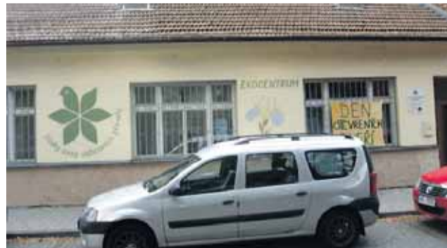
Objekt dlouhodobě využívaný Ekocentrem Iris je již nevyhovující.

budovou v rámci naplňování strategie Smart Prostějov / Manuál chytrého města. „O tuto cestu ozelenování městských budov usilujeme již delší dobu. Ozeleníme střechy nad hlavním vstupem do budovy Školní 4 a střechy nad sálem Duhy ve dvorní části,“ uvedla náměstkyně primátora pro životní prostředí Milada Sokolová. Dle jejích slov vznikne na části budovy zelená střecha, na části další budou umístěny fotovoltaické panely, zasazeny budou popínavé rostliny nad propojovacím krčkem nového a stávajícího objektu bývalé kovárny a počítá se také se zpětným využitím dešťové vody pro splachování na toaletách a pro zalévání zahrady. „Chtěli bychom, aby se z nové budovy