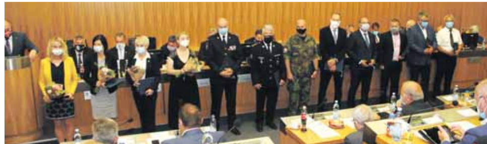
Hejtmán ocenil ty, kteří aktivně pomáhali v boji proti koronaviru.

Sříbrnou medaili hejtmána Olomouckého kraje Ladislava Okleštěka obdrželo v pondělí 22. června dvanáct lidí, kteří se aktivně zasadili o prosazování opatření na potlačení epidemie koronaviru. Jsou mezi nimi například starostové uzavřené Litovle, Uničova a Červenky, zástupci armády, zdravotníků a hygienické správy. Oceněných je ale ve skutečnosti daleko více. „Kdybych měl významnat všechny, kteří