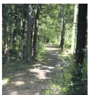
Stežka zdraví nabídne prvky pro aktivní pohyb.

„Veškeré prvky a stavby musí být odolné vůči vandalům. Součástí záměru bude také vytváření umístění servisních cyklostanovišť a přístřešků. Cena za zpra-