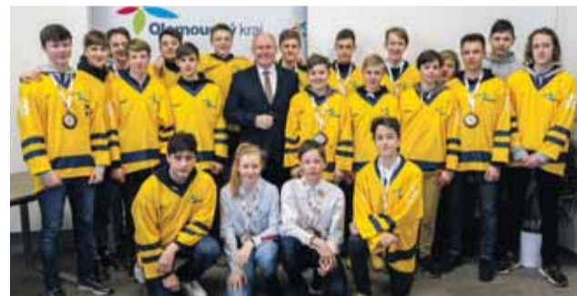
Hejtmán s medailisty zimní olympiády dětí a mládeže ČR. Příští rok bude olympiáda u nás.

Bystřice. Jejich zástupci dostali v pátek 12. června během setkání v sídle hejtmanství k projektu všechny aktuální informace. „S akcí takového formátu souvisí stovky drobností, které je třeba co nejdříve vyřešit, aby vše proběhlo tak, jak má. Bez pomoci zástupců měst, v nichž se bude příští rok v rámci olympiády sportovat, se neobejdeme a jsme rádi, že nám všichni potvrdili spolu-