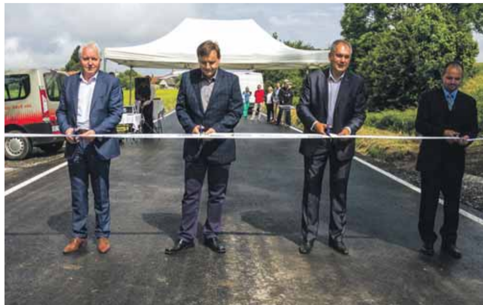
Z Laškova po hranice okresu Olomouc po novém. Díky krajské podpoře.

Už loni v prosinci tak byl uveden do provozu zrekonstruovaný úsek mezi Laškovem a jeho místní částí Kandia. Kromě komunikace tu staveb-