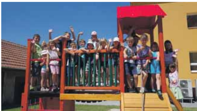
Jednou z obcí, která náš region na výstavě reprezentuje, jsou s dětským hřištěm Vrchoslavice.

Čelkem třináctka obcí reprezentuje Olomoucký kraj na výstavě nazvané Má vlast cestami proměn – příběhy domova. Na už dvanáctém ročníku výstavy náš region reprezentují projekty realizované v obcích Bohuňovice, Bochoř, Dubicko, Jezernice, Kojetín, Milenov, Mohelnice, Moravský Beroun, Otaslavice, Potštát, Šumperk, Ústín a Vrchoslavice. „Putovní výstava přináší svědectví o příznivých proměnách zanedbaných míst, chátrajících stavby mění v důstojné objekty s užitečnou náplní, veřejný prostor dostává novou tvář. Účastníme se už šestým rokem,“