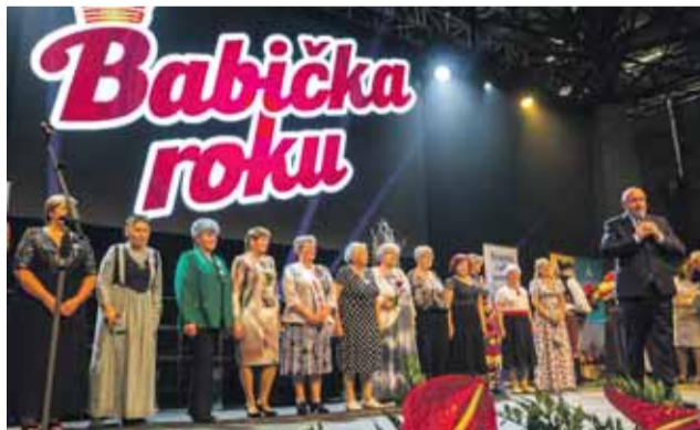
Soutěž ukazuje vnitřní krásu v seniorském věku.