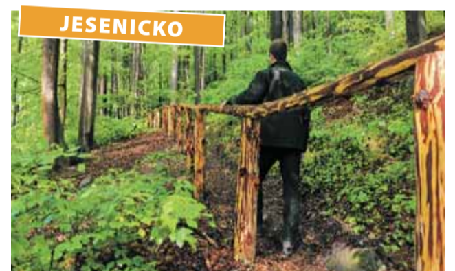
Turistická stezka k Čertovým kazatelám se dočkala obnovy.

Obnova stezky s sebou nenesla pouze nové zábradlí, ale také komplexní úpravu terénu. „Museli jsme především nechat zpevnit a srovnat povrch stezky, který byl místy propadlý a po krajích velmi rozvolněný. Poté jsme mohli usadit dřevěné zábradlí. Kůly jsou vyrobeny z modřínu, aby vydržely co nejdéle. Samotné držadlo zábradlí je ze smrčového dříví,“ popsal nově obnovenou turistickou stezku vedoucí polesí Vápenná Vlastimil Koňářík a dodal, že dřevo na výrobu zábradlí pochází