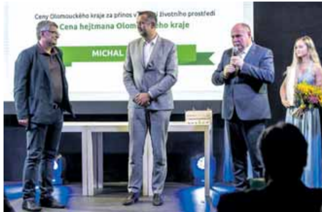
Olomoucký kraj poděkuje těm, kteří pomáhají přírodě.

Od začátku července mohou lidé rozhodovat o tom, kdo získá Ceny Olomouckého kraje v oblasti životního prostředí. Na webových stránkách CENYKRAJE.CZ mají na výběr z celé řady nominovaných, kteří se zasloužili o ochranu přírody v našem regionu. „Anketou chceme upozornit na spoustu věcí – třeba na to, že příroda naší pomoc potřebuje a my máme co napravovat. A hlasování má také zviditelnit ty, kteří naši krajině rozumí i pomáhají a zdůraznit, že to nedělají pro sebe, ale pro nás všechny, pro naše děti a vnoučata,“ uvedl hejtman Olomouckého kraje Ladislav Okleštěk.