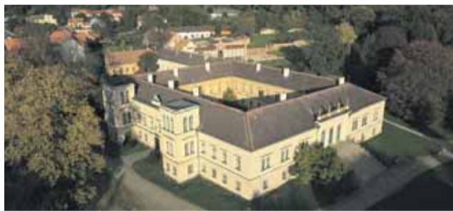
Zámecký areál ožije hudbou

jené s 200. výročím narození slavného českého malíře Josefa Mánesa. Ten velkou část života právě na tomto zámku prožil a tvořil. Kromě toho se zámek v celostátní soutěži stal Památkou roku 2019 a nositelem ocenění Opera Historica 2019! (red)