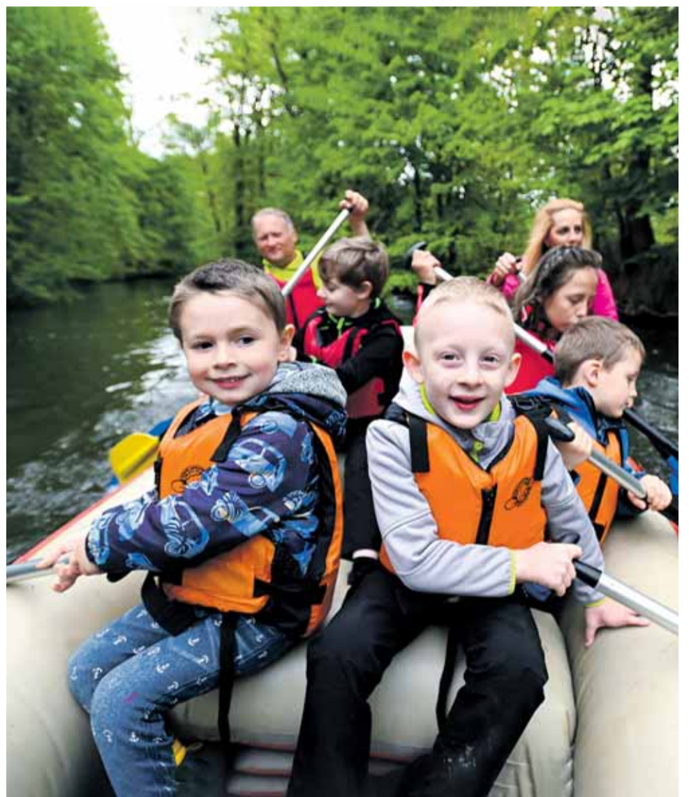
Olomoucký kraj láká návštěvníky na pestrou nabídku vyžití. Ti, kteří k nám zavítají si mohou vybrat například výlet na hory s pěší turistikou nebo cykloturistiku, ale třeba i rafty na řece Moravě. Možností jsou také krásné historické a přírodní památky.

Haná i Jeseníky jsou skvělou alternativou k dovoleným v zahraničí