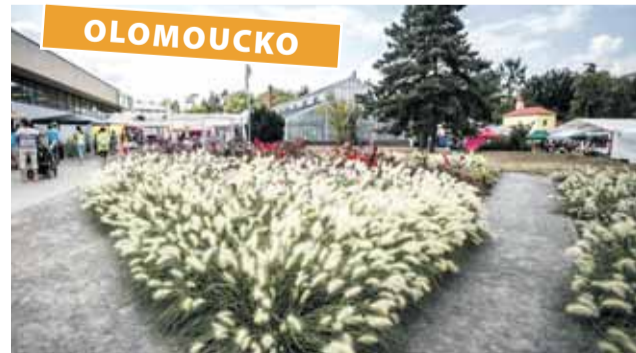
Výstaviště Flora Olomouc ožije koncem srpna rozkvetlou krásou.