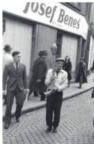
Výstava odkrývá dramatickou historii města Přerova.

říkajíc na vlastní kůži. Svůj příběh povpráví po 75 letech vzácná kolekce fotografií Jiřího Högra, který v ulicích města dokumentoval okamžiky, jež se později zapsaly do dějin. Celá série bude veřejnosti představena vůbec poprvé. Výstava je k vidění v Muzeu Komenského v Přerově do 1. listopadu 2020. (red)