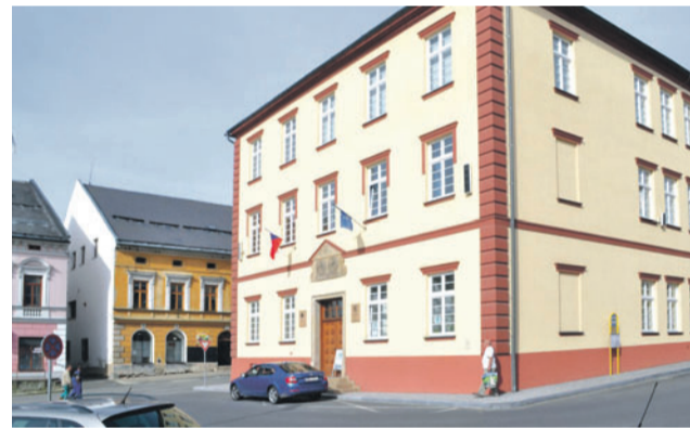
Vědní Štít se podařilo sehnat zubaře, teď chce pediatra.

„Štíty už investovaly do rekonstrukce zdravotního střediska a stomatologické ordinace nemalé finanční prostředky. Kraj městu pomůže s pořízením dalšího moderního vybavení. Jediný podobný rentgen je dosud od Štítů šestnáct kilometrů daleko,“ odůvodnil poskytnutí dotace Dalibor Horák,