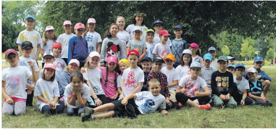
Univerzitní příměstské tábory děti vzdělávaly v technice, informatice i historii.