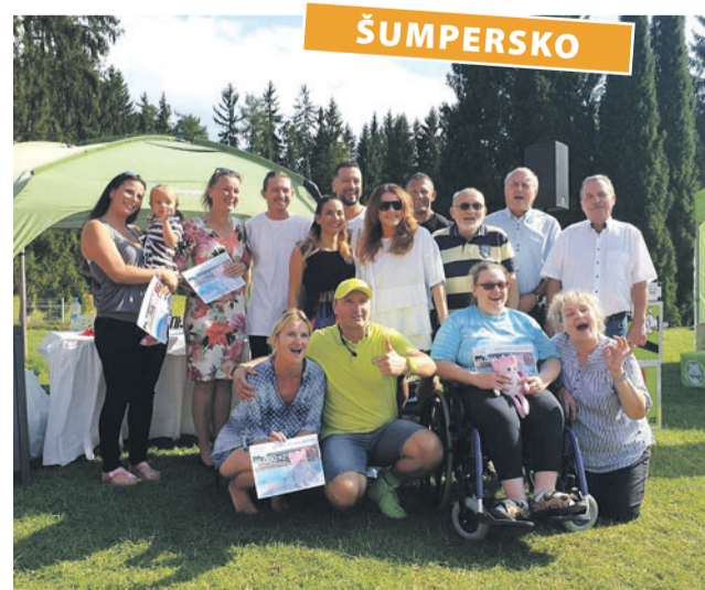
Na Dni s Korunkou Velké Losiny se předávaly šeky ve prospěch dětí s hendikepem a pro místní organizace.

Spolek Korunka Velké Losiny byl založen v počátku tohoto roku s cílem pomáhat potřebným lidem v severní části Olomouckého kraje. (red)