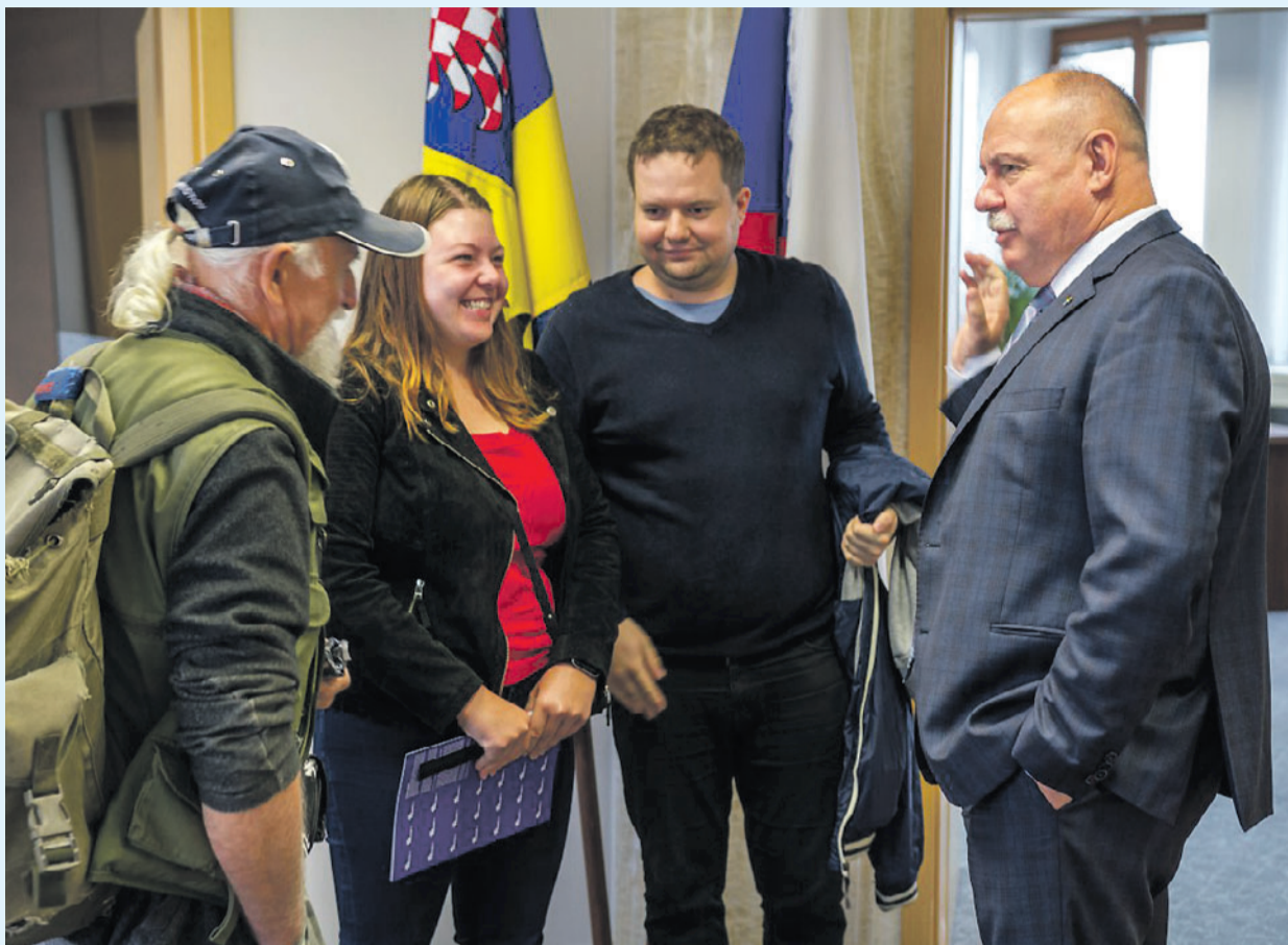
„Ze Dnů kraje bychom rádi udělali staronovou tradici,“ říká hejtman Okleštěk k úspěšně obnovené akci.

Návštěvnost Olomouckého kraje rok od roku roste, za posledních pět let skoro o 50 procent a pořád stoupá. To je skvělá zpráva. Samozřejmě bych si teď mohl přihřát polívčičku a tvrdit, že za růstem návštěvnosti jsou krajské ceny. Částečně možná ano, ale hlavně je to přičiněním lidí, kteří v turistickém ruchu pracují. Moc jim za to děkuji, zájem turistů o náš region prospívá ekonomické kondici zejména na severu našeho kraje.