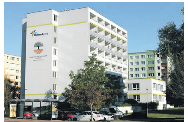
Sociální služby pro seniory Olomouc.