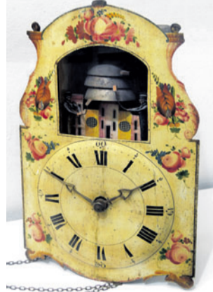
Charakteristický automat.

Výstava je také doplněna ojedinělým celodřevěným věžním hodinovým strojem z kostela z Žiliny u Nového Jičína zapůjčeným Mu-