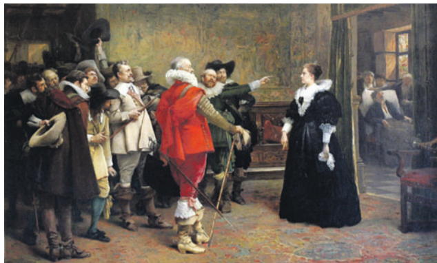
Polyxena z Lobkovic ochraňuje ve svém domě královské místodržící Slavatu a Martinice, svržené z oken královského hradu v Praze roku 1618 od Václava Brožíka.

Václav Brožík se narodil 5. března 1851 a patřil ke generaci umělců Národního divadla. Pocházel z početné rodiny a velmi chudých poměrů a nic nenavštěvovalo tomu, že by ho čekala tak zá-