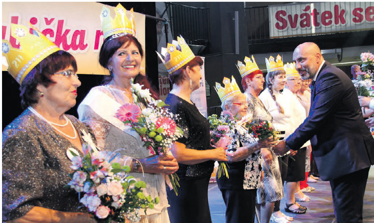
Olomoucký kraj inspiroval zbytek republiky a „jeho“ soutěž Babička roku je tak letos poprvé celostátní akcí.

„Vítězky krajských kol z celé republiky se potkají