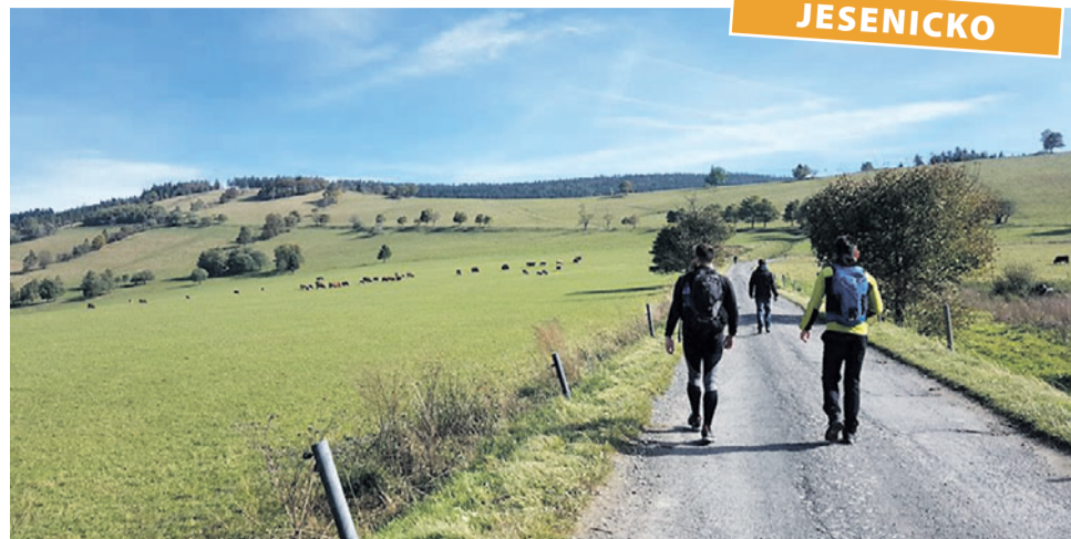
Kdo dojde do cíle některé z tras Zlatohorského trekingu, může se těšit na pamětní list i nálepku, chleba se škvarkovou pomazánkou a cibulí a kofolu.

Jako vždy i letos platí termín první sobota v říjnu, tentokrát tedy 5. října. Všechny trasy začínají i končí ve Zlatých Horách a je možné je projít nebo proběhnout, vzdálenost 25 kilometrů nabízí i variantu nočního běhu a trať dlouhá 15 kilometrů má verzi Nordic Walking s instruktorem. „Čas ‚výkroku‘ a příchodu si každý určí a vyznačí sám. Máme k dispozici značkovací hodiny takzvané píchačky, které se dříve používaly ve fabrikách na vrátnicích. Kontrolní lístky pro stanoviště mají tvar právě píchaček. Je úžasné jak omladina neví, co to je a jak se s tím pracuje,“