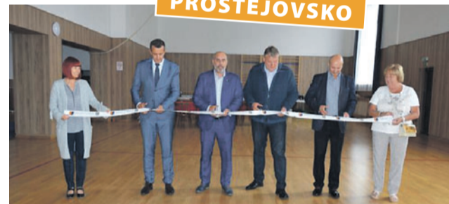
Na 13,6 milionu korun přišla rekonstrukce sokolovny v prostějovské části Čechovice, kterou finančně podpořil i kraj.

Náklady na první etapu byly 7,1 milionu korun, druhá vyšla na 6,5 milionu. „Poskytnuté finance Olomouckým krajem a městem Prostějovem pomohly dokončit celé dílo a uvést sokolovnu do nové stávající podoby, která by měla