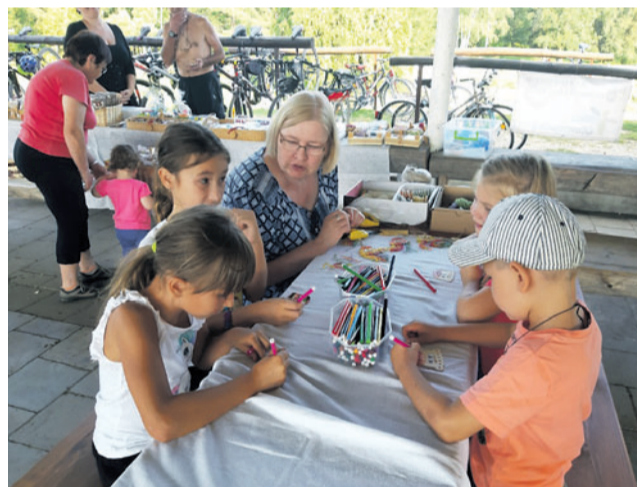
Akce na Poděbradech nedělala rozdíly podle věku.

Přes sto soutěžících všech generací se zúčastnilo Podzimní stezky poznání Jdeme celá rodina. Druhý ročník uspořádal Olomoucký kraj spolu s Krajskou radou seniorů 5. září na olomouckých Poděbradech.