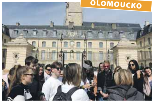
Studentské výměny patří k nezapomenutelným zážitkům, Olomoucký kraj je proto dlouhodobě podporuje.

Studenti tříd 3. AF a 4. AF byli na začátku května i tentokrát ubytováni v rodinách, zdokonalili se ve francouzštině, poznali město Besançon a jeho okolí a navštívili i historický Dijon. „K nejzajímavějším momentům výměny patřila návštěva bývalé vojenské pevnosti, která dnes slouží jako prostor pro zrání známé-