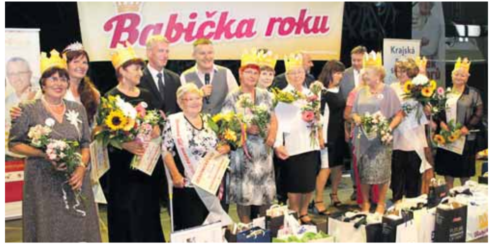
Hlásit se do soutěže je možné do 25. srpna.

Letošní čtvrtý ročník talentové soutěže seniorské krásy proběhne 19. září na olomouckém výstavišti Flora v pavilonu A od 13 hodin. Do 25. srpna 2019 je možné přihlásit sebe nebo favoritky do soutěže Babička roku. Podmínkou je věk od 55 let a trvalý pobyt v Olomouckém kraji. Dvanáct finalistek bude soutěžit ve třech soutěžních úkolech. První se jmenuje Představ sebe a svůj kraj, půjde o řízený rozhovor s moderátorem Vladimírem Hronem. Druhá disciplína je Ukaž, co umíš – lze zpívat, recitovat, představit vlastní tvorbu, malovat, předvést ruční