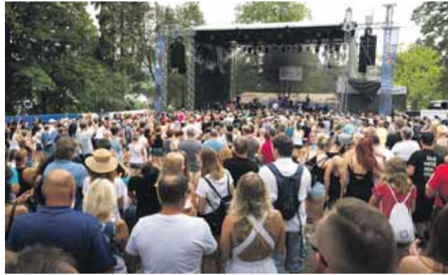
Šternberský kopec bavil návštěvníky i loni a nejinak tomu bude při letošním šestnáctém ročníku.

15. srpna 2019, areál Státního hradu Šternberk Mysleli jste si, že vás už nic nedokáže rozesmát? Přijďte se podívat na volné pokračování kultovní one man show Caveman a seznámit se s hrdinkou nového před-