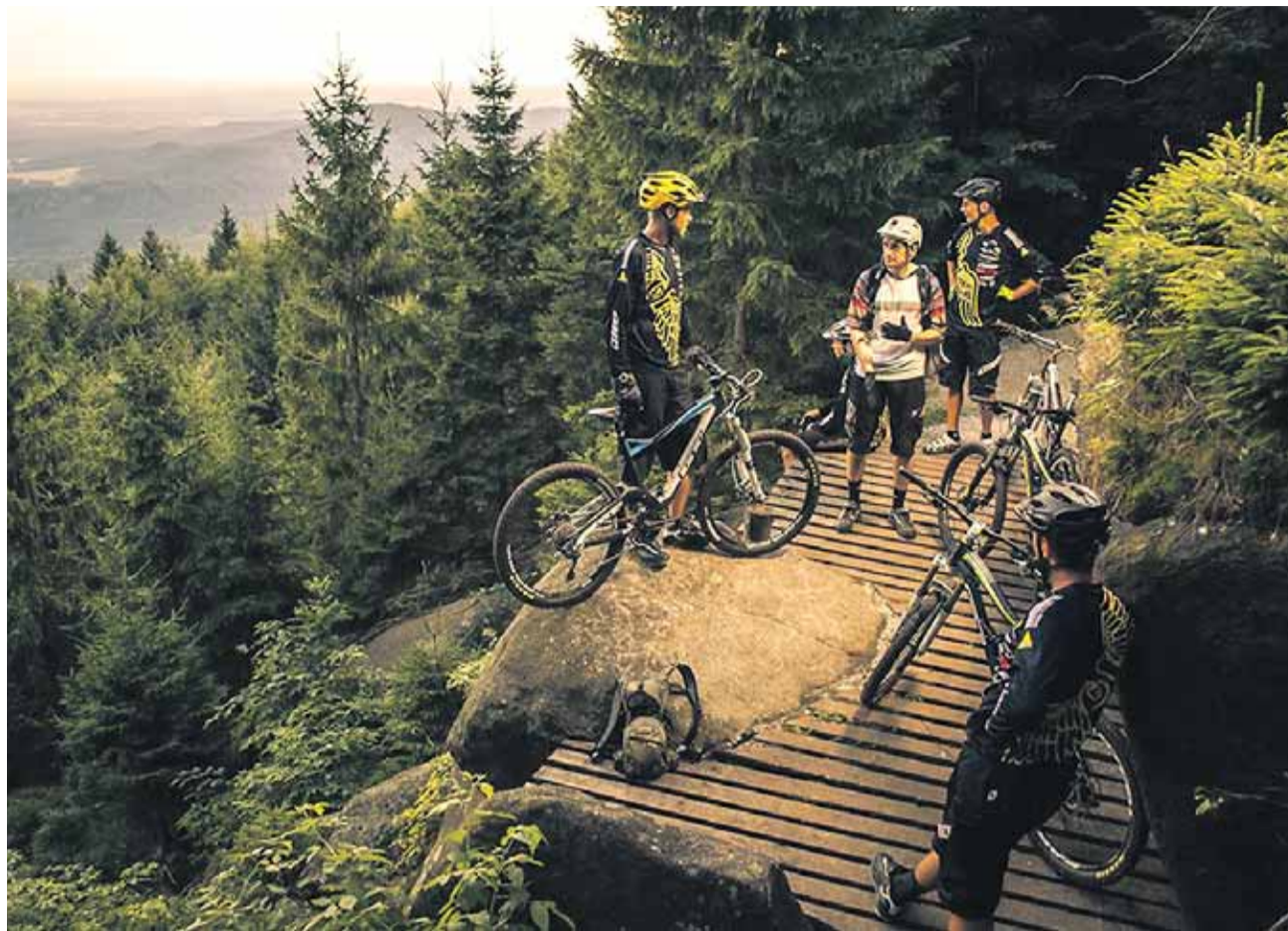
V kategorii Nejlepší cyklo destinace Cen Olomouckého kraje v oblasti cestovního ruchu zvítězily v minulém roce Rychlebské stezky.

Finalisty ankety vybrala odborná porota z nominací turistických informačních center. Slavností předání cen vítězným finalistům v každé kategorii proběhne 10. října v Arcibiskupském paláci v Olomouci. (red)