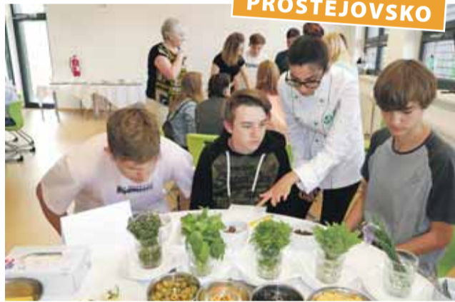
Projekt seznamuje žáky se základy tradičních řemesel jako je kuchař nebo číšník.

Střední odborná škola na náměstí Edmunda Husserla a pět základních škol okresu Prostějov završily s koncem května celoroční spolupráci v rámci programu IKAP, který motivuje žáky ke studiu tradičních řemeslných oborů.