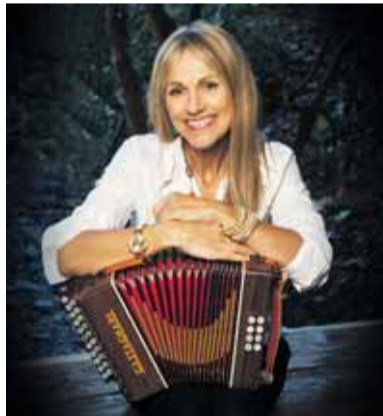
Sharon Shannon.