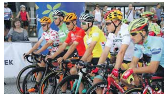
Účastníci loňské Czech Cycling Tour na startu před krajským úřadem v Olomouci.

Czech Tour (doneslé název Czech Cycling Tour) se řadí mezi etapové závody Mezinárodní cyklistické unie (UCI - Union Cycliste Internationale). Její nulý ročník se uskutečnil před deseti lety, na závěrečné finále tehdy došlo na pražském Staroměstském náměstí. Pozice historicky neúspěšnějšího jezdce patří českému cyklistovi Leopoldu Königovi. Tour ovládl dvakrát - v letech 2010 a 2013. Loňské prvenství vybojoval Rakušan Riccardo Zoidl. (red)