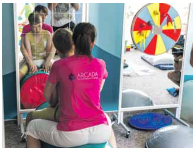
Rehabilitační centrum Arcada v Hranicích.