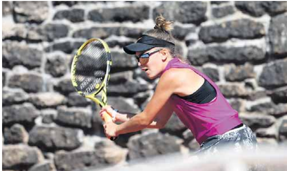
Mladí sportovci z kraje měli na olympiádě dětí a mládeže úspěch, přivezli 34 medailí.

Nejvíce zlatých medailí nasbíral gymnasta Fran-