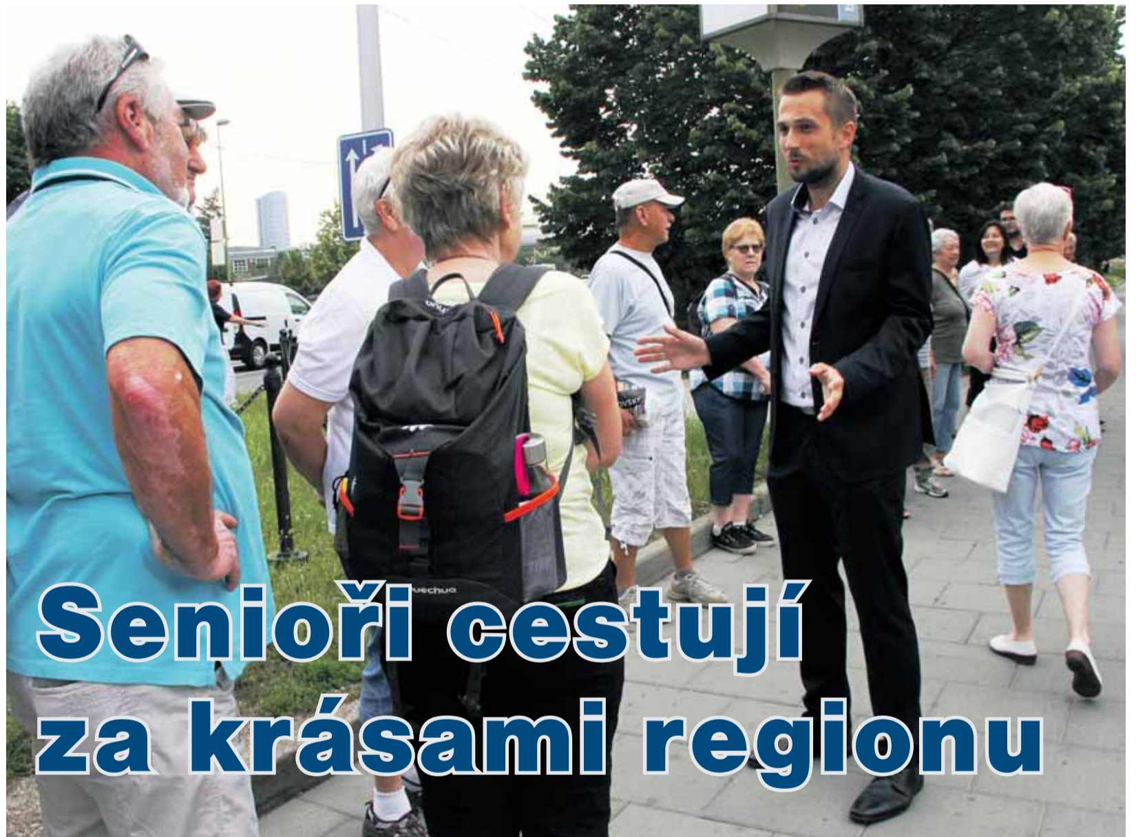
Ladislav Okleštěk hejtman Olomouckého kraje

I v turistickém ruchu je ale pořád co zlepšovat. Pokud máte nějaký nápad, co v této oblasti dělat lépe, napište mi e-mail na adresu prohejtmana@olkraj.cz. A pokud nejedete relaxovat k moři, zkuste si najít cíl letní dovolené na webu www.ok-tourism.cz .