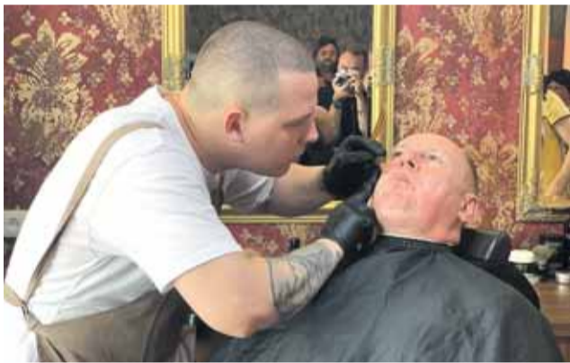
Hejtman prohrál sázku o knír rád, peníze pomůžou hendikepovaným dětem.

Na konto 115-8803540277/0100 mohou dárči posílat peníze dál. Účet bude otevřen až do 31. března 2020. „Cítím se trochu jako nahej v trní. Než se ale sbírkové konto uzavře, budu mít už knír určitě zpátky. Třeba se pak zase o něco vsadím,“ zažertoval Okleštěk. (red)