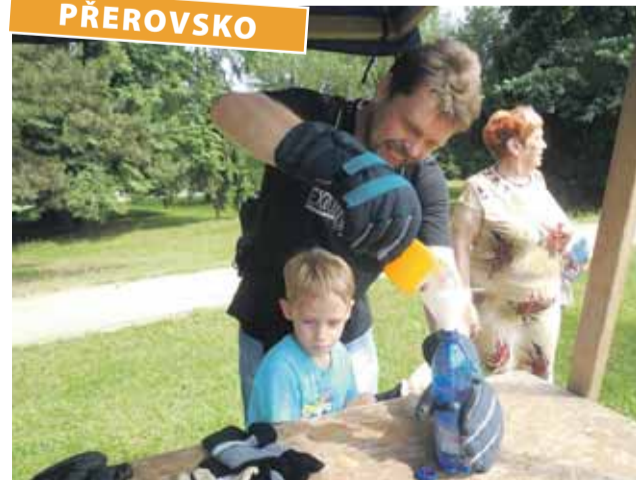
Jaké to je, mít omezenou hybnost prstů, mohli zažít účastníci festivalu MAMMUT.

Rodiny společně hráli kromě romské děti a jejich rodiče zaujal pétanque. Odvážní zájemci si vyzkoušeli jízdu na elektrickém invalidním vozíku, prostřednictvím simulace zrakového postižení měli za úkol se podepsat a v rukavicích, které simulovaly omezení hybnosti prstů, nalévali vodu z lahve do hrníčku. Při zajišťování jednotlivých úkolů i při sportovních aktivitách společně pomáhali osobní asistenti i vedení Alfa handicap. „Myšlenka festivalu – setkávání lidí z různých sociokulturních prostředí bez rozdílu věku a zdravotního postižení