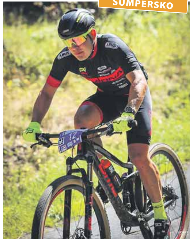
Závodit mohou všichni od dvouletých dětí po dospělé.

podle věku. Sportovní dopoledne odstartuje současně těch úplně nejmenších na odrážedlech v 10 hodin. V pravé poledne se na třicetkilometrovou krásnou horskou trať s nádhernými výhledy do okolí vypraví všichni starší 15 let. Veřejný půlmaratonský závod MTB zavede účastníky přes masiv Sušiny až k Dolní Moravě a potom zpět do místa startu a cíle do areálu Kolovny v Hynčicích pod Sušinou. Prezentace je možná on-line na www.kolarna.eu nebo i přímo na místě do 10 hodin. Všichni účastníci mají možnost ubytování na chatě Erlina, k dispozici budou i plochy pro stanování a samozřejmě bohaté občerstvení po celý den. Turistické atrakce, jako například rozhledna pouze dvacet minut chůze od místa konání, sjíždění sjezdovky na horských koloběžkách