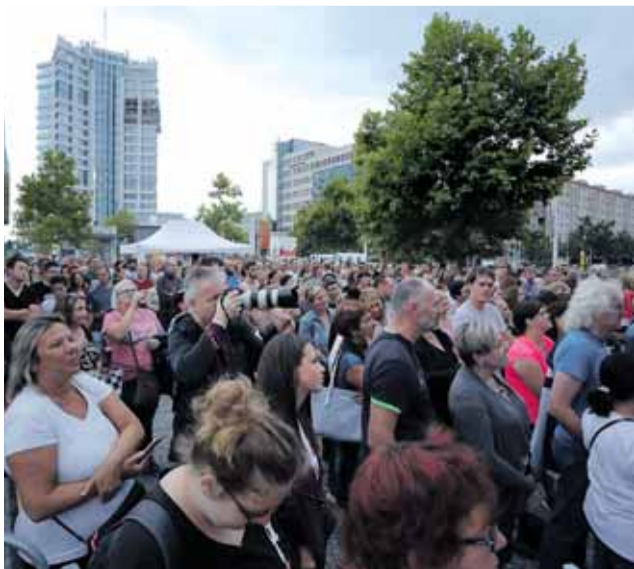
Loni pořádalo hejtmanství mezi olomouckým nádražím a sídlem kraje oslavu stého výročí státnosti. Letos na stejném místě připravuje na 6. a 7. září Dny Olomouckého kraje 2019.

Podrobnosti k akci budou postupně zveřejňovány na webových stránkách www.dnykraje.cz . (red)