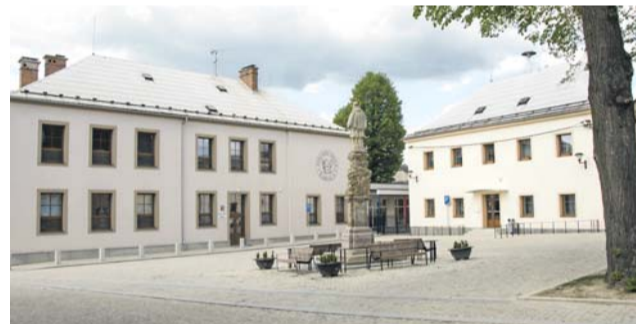
Do všech přihlášených obcí vyjedou odborní komisaři, aby zhodnotili, jak se v nich žije.

Hejtmánství soutěž dlouhodobě podporuje. Obce, které v krajském kole obsadí první, druhé a třetí