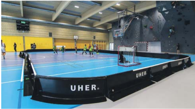
Na opravu a výstavbu sportovišť posílá hejtmánství obcím a klubům dalších 38 milionů korun navíc.

O smatřicet milionů korun přispěje Olomoucký kraj do dotačního programu, ze kterého mohou obce a sportovní kluby čerpat finance na opravu a výstavbu sportovišť. O peníze projeví zájem více než sto třicet žadatelů.