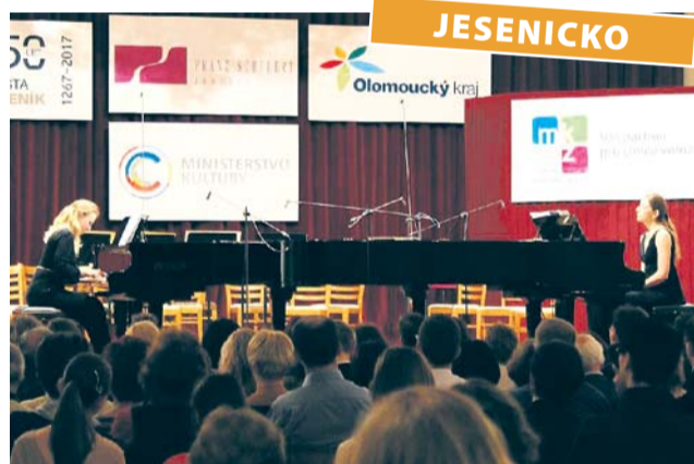
Takzvaná Schubertovka si kromě familiárního označení vybuodovala za čtyři desetiletí i mezinárodní pověst.