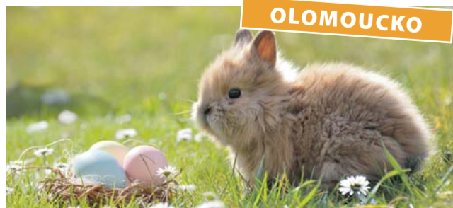
Vstup na dubnový Velikonoční jarmark je zdarma. Ilustrační foto

Tradiční velikonoční jarmark v Regionálním centru Olomouc v Jeremenkově ulici se letos bude konat ve dnech 9. a 10. dubna. Na trzích se představí uživatelé sociálních služeb poskytovaných příspěvkovými organizacemi Olomouckého kraje se svými výsledky terapeutických činností. Klasické velikonoční pomlázky, vajíčka a zajíce doplní pečivo, cukroví a další pochutiny či originální nápady. Návštěvníci budou vítáni po oba dva dny vždy od 9 do 13 hodin, vstup je volný. (red)