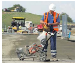
Kraj na stavbu vyčlenil v rozpočtu 90 milionů korun.

Krajský rozpočet počítá s náklady ve výši 90 milionů korun, město má investovat dalších zhruba třia-