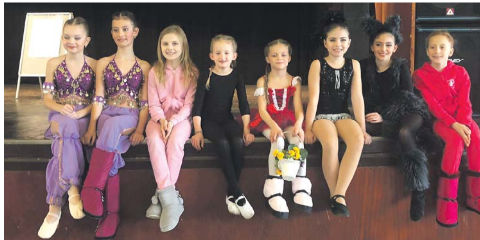
Mezinárodní kvalifikační porota poslala děti z Baletního studia na mistrovství světa.