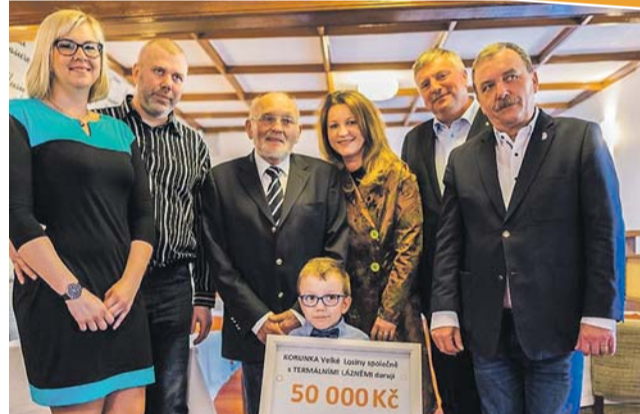
První šek dostal od spolku Korunka Velké Losiny šestiletý chlapec trpící nevyhlášenou chorobou.

Během představení spolku předali zástupci Ko-