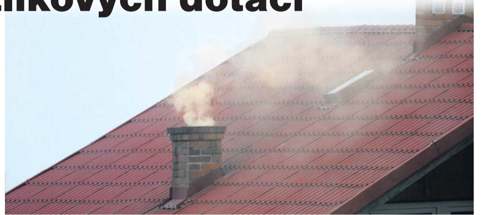
S podrobnostmi k čerpání dotací na výměnu kotlů je možné se seznámit na informačních seminářích.

Příjem žádostí bude stejně jako v minulosti probí-