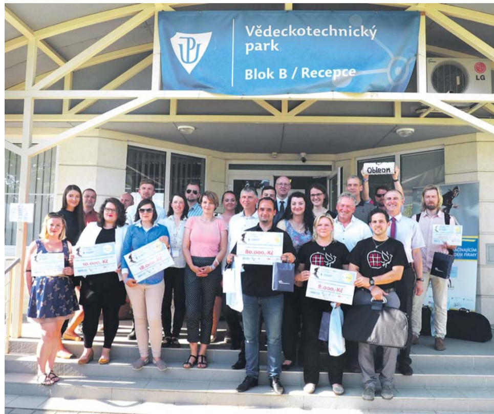
Jedním z ocenění pro finalisty soutěže Podnikavá hlava je také šance vystoupit před početné publikum olomoucké konference o podnikání UP Business Camp.

Vítězem loňského ročníku soutěže se stal Jakub Navařík. Porotu zajišťoval recyklací plastů pro