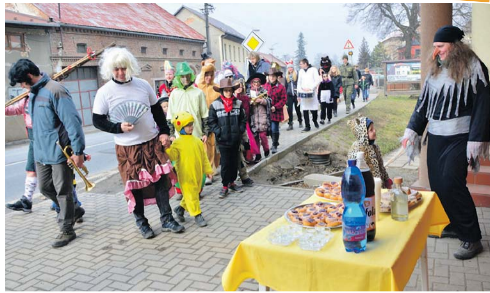
Fašank patří mezi akce, za kterými každoročně stojí kokorští sousedé.

Masopust probíhá v Kokorách vždy od pátku do neděle. V pátek je zabijačka a její speciality se večer prodávají v místní sokolovně za doprovodu country skupiny. Druhý den v sobotu je vedení medvěda obcí. Aby mohl medvěd vesnicí projít, musí chasa dostat povolení od starostky obce. Figura řezníka měla s žádostí