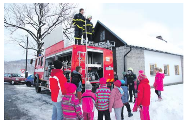
Dobrovolným hasičům z Černé Vody se podařilo zapojit do sboru i děti od 4 do 13 let.

jména se ovšem mezi členy našli obětaví vedoucí, kteří absolvovali školení na práci s dětmi a začali se jim věnovat. Druhá schůzka se uskutečnila začátkem února v hasičské zbrojnici. Děti z přípravky od 4 do 6 let a mladí hasiči od 6 do 13 let se zde fotily na členské průkazky, seznámily se se sborem, nahledly do fotodokumentace dřívější práce s mládeží a spolu s vedoucími a členy si prohlédly techniku a ochranné obleky. Rovnou se také zapojily do celostátní soutěže Požární ochrana očima dětí, kde budou kreslit nebo tvořit povídky na toto téma. Jednotka SDH obce Čer-