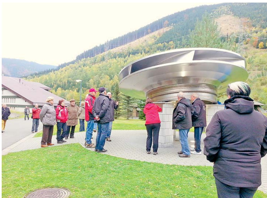
■ Senioři s podporou kraje jezdí na dotované zájezdy už desátým rokem a každoročně se kapacity zájezdů navyšují. Účastníci zaplatí 200 korun a zbývající cenu zájezdu dotuje Olomoucký kraj.

Na první zájezd vyrazí senioři už 22. září. Možnost cestovat s krajem pak budou mít do 29. listopadu. Podpora seniorů je jedním z pilířů krajské politiky, jdou na ni miliony korun. „Seniorské cestování se stalo velmi populární. Kvůli velkému zájmu jsme dokonce museli navýšit kapacitu zá-