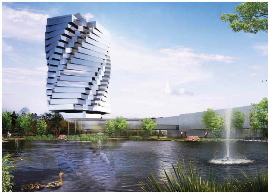
Hotel Spiral, Praha

hotelu připomínající vodní vír s kapacitou 500 lůžek vytvoří novou dominantu místa. Součástí návrhu je i restaurace a kongresový sál s kapacitou 1200 osob.