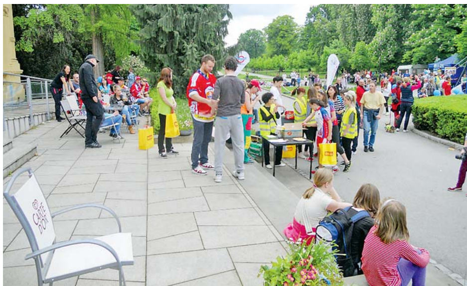
■ Koloběžkáři s Dobrým místem pro život a Radiem Haná

LM: Myslím, že je dobře, že se Olomoucký kraj zajímá o organizace, pro které jsou rodiny s dětmi na prvním místě. My si této podpory vážíme a jsme rádi, že soutěž Společnost přátelská rodině bude pokračovat i v příštím roce. »red