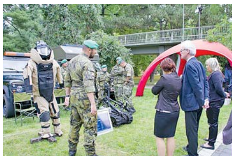
■ V rámci Road show se na výstavišti prezentovaly všechny složky Integrovaného záchranného systému Olomouckého kraje. Nechyběla ani armáda či vězeňská služba.

Už čtvrtou debatu na téma zajištění obrany a bezpečnosti Olomoucké-