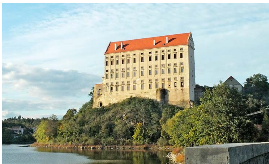
■ Zámek Plumlov je symbolem mikroregionu.

I do budoucna bychom chtěli pokračovat v započaté práci a tuto nadále rozvíjet. Už několik let plánujeme výrobu turistických informačních tabulí, které bychom umístili do jednotlivých obcí. Zaznamenali jsme také zájem okolních obcí o vstup do našeho mikroregionu, takže nevyklučuji, že se v budoucnu rozšíříme. »red