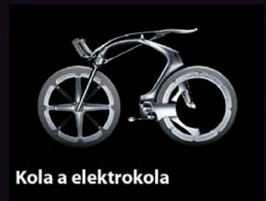
Kola a elektrokola