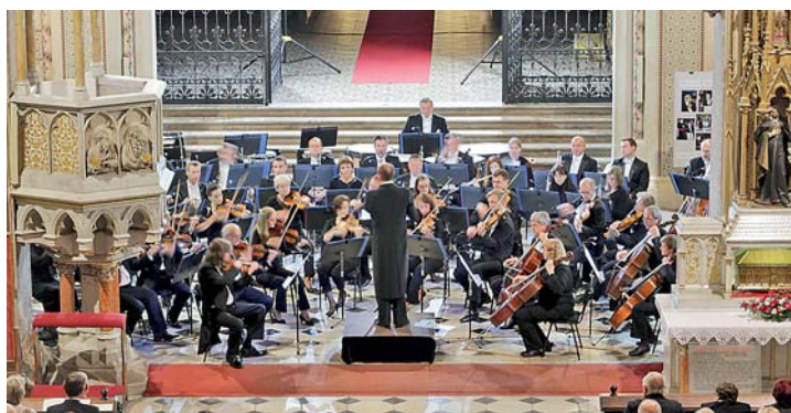
■ Zahajovací koncert loňského ročníku v dómu sv. Václava.