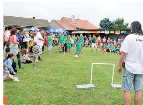
■ Hry bez hranic pořádá mikroregion od roku 2010.

Cíle, myslím, plníme postupně. Především tím, že se snažíme vystupovat jako jeden celek, a ne jako 7 samostatných obcí. Pravidelně se scházíme všichni starostové a radíme se o aktuálních otázkách ze života samosprávy, vyměňujeme si zkušenosti a poznatky ze své každodenní práce a v případě potřeby hledáme variantní řešení nebo se dohodneme, jak budeme vystupovat vůči třetím osobám při řešení určitého problému. Prostě vzájemná diskuse, rozdělení úkolů a otevřenost je tím nej-