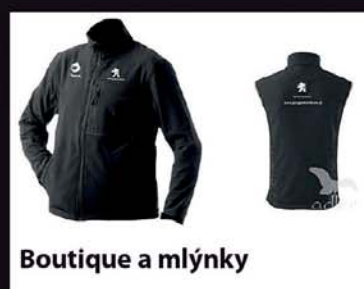
Boutique a mlýnky