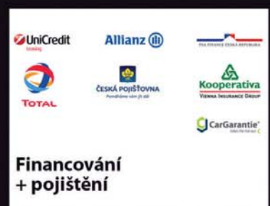
Financování + pojištění