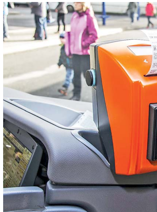
■ Časovou jízdenku na platební kartě mohou využívat už na Jesenicku a Prostějovsku.

rý studentům cestování tímto způsobem zjednodušil. Průkaz ISIC je možné použít v osobních a spěšných vlacích, autobusech a městské hromadné dopravě. Studenti jím nahradí papírový žákovský průkaz, který jim dříve musela potvrzovat škola.