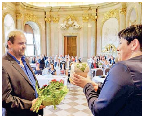
■ Keramickou popelnici letos převzali zástupci vítězných měst v sále Klášterního Hradiska.

Tradiční keramickou popelnici získali už po jedenácté města a obce z kraje, jejichž obyvatelé nejlépe třídí odpad. V soutěži s názvem O keramickou popelnici byly vyhodnoceny celkem čtyři kategorie podle velikosti