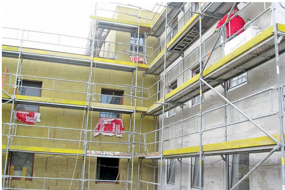
■ K největším letošním investicím patří přístavba a rekonstrukce pavilonu domova pro seniory František v Náměšti na Hané. Hotová bude v polovině října.

Mezi největší letošní krajské investice patří i rekonstrukce a přístavba pavilonu domova seniorů František v Náměšti na Hané