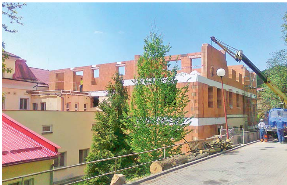
■ Odborný léčebný ústav Paseka – pracoviště v Moravském Berouně získá letos novou plynovou kotelnou a geriatrické oddělení projde modernizací.