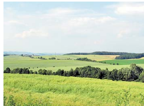
■ Krásná čistá záhorská příroda

Do současné doby se proinvestovalo v obcích na území svazku díky mikroregionu více než 100 milionů korun. Bez společného managementu by tato částka byla mnohem nižší a spousta