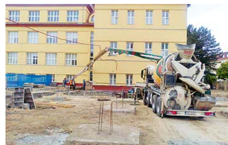
■ Významnou investicí ve školství je například i stavba tělocvičny VOŠ a SPŠ elektrotechnická Olomouc za 55 milionů korun.

v Náměšti na Hané za 58,5 milionu korun. „V průběhu výstavby jsme museli snížit počet uživatelů domova o 15 osob, koncem dubna se provizorně přestěhovat do nového pavilonu a během léta bude probíhat rekonstrukce původních prostor. Pracujeme v téměř polních podmínkách – stravovací provoz byl na tři měsíce nahrazen dovozem obědů z jídelny ZŠ, prádelnu máme provizorně v garáži, sušíme na zahradě, žehlíme v centrální koupelně, šatnu máme v budoucí kulturní místnosti,