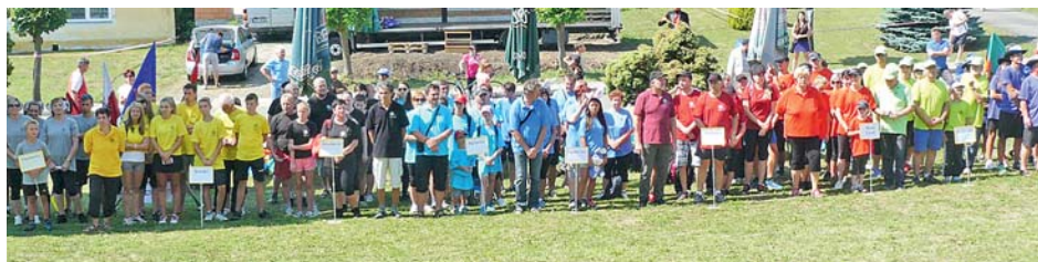
■ Pravidelné setkání v rámci akce Hry mikroregionu Záhoran

Chceme i nadále systémově pokračovat v meziobecní spolupráci ve všech oblastech naší strategie a navazovat na projekty již realizované, např. v rámci spolupráce s Polskou republikou či jinými zeměmi. Mezi naše priority řadíme i rozšíření sociálních služeb pro seniory a spolupráci s místními základními a mateřskými školami. »red