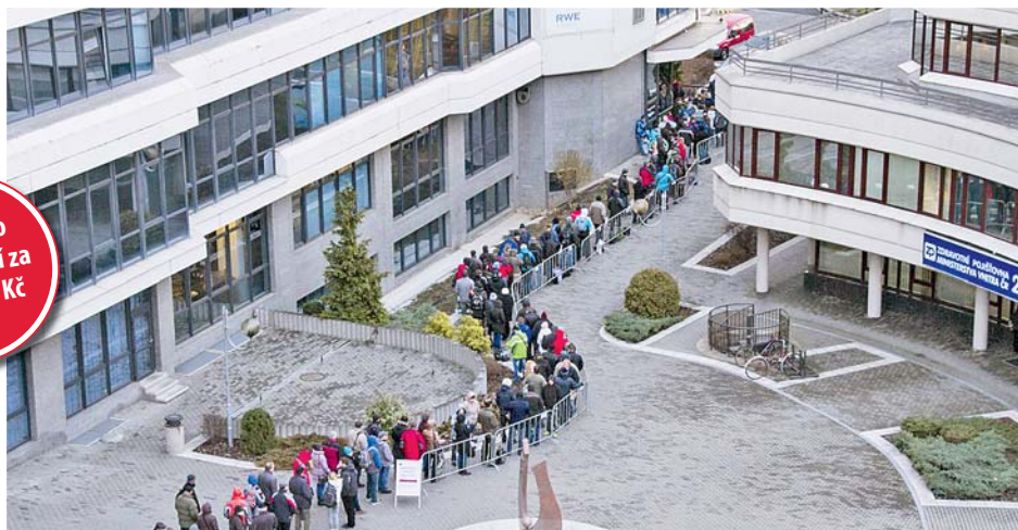
■ O kotlíkové dotace byl obrovský zájem. Lidé čekali na zahájení příjímání žádostí celou noc.