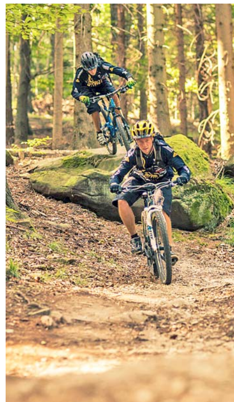
■ Rychlebské stezky budou díky dotacím rozšířeny.

Sedm milionů a sto tisíc korun – to je částka, kterou Olomoucký kraj rozdělí letos mezi ty, kteří chtějí rozšířit svoji stávající nabídku v cestovním ruchu. Šanci na podporu mají také žadatelé, kteří plánují budování nových atrakcí. „Větší atraktivita i dostupnost turistických cílů – právě to je záměrem tohoto dotačního programu. Má tak zlepšit kvalitu a rozšířit nabídku cestovního ruchu v celém regionu,“ říká k dotačnímu programu Jiří Rozbořil, hejtman Olomouckého kraje. Rozšíření Rychlebských stezek a vybudování nových „zážitkových“ úseků, další etapa přírodního hřiště v Jeseníku – lázních nebo výstavba letní tubingové dráhy v Hynčicích pod Sušinou. To jsou tři z celkem sedmadvačeti projektů, které Olomoucký kraj po schválení zastupitelstvem na konci června podpoří. Hejtmanství dostalo celkem 44 platných žádostí. Požadovaná výše podpory přesáhla patnáct a půl milionu korun.