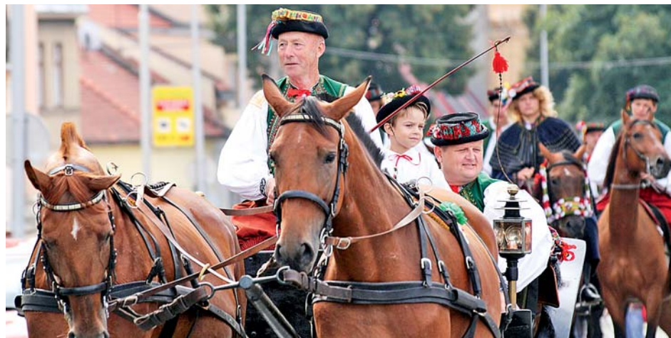
■ Průvody Hanáků v rámci kojetínských hodů