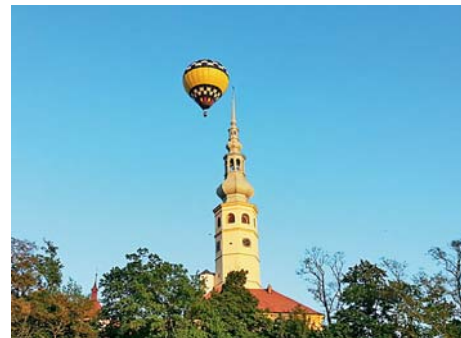
■ Zámek v Tovačově

Vedle již zmíněné MAS to byly určité dotace na propagaci, pořízení vybavení na venkovní slavnosti, spolupráce v oblasti životního prostředí a nakládání s odpady apod. Naopak nás trápí stav komunikací na našem území a chybějící