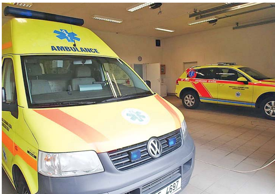
■ Už letos dojde k obměně vozového parku ZZS OK.

V následujících třech letech chce Olomoucký kraj postupně provést výměnu vozového parku sanitních vozidel. V minulém roce vyhlášené výběrové řízení na nové sanitky bylo zrušeno a současná možnost získání financí