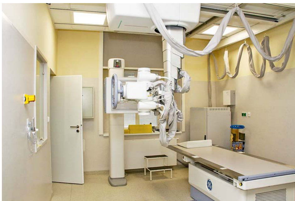
■ Nové radiodiagnostické zařízení v přerovské nemocnici.

Velmi dobře se v kraji vyvíjí spektrum vybavenosti diagnostickou přístrojovou technikou. V Olomouci fungují tři přístroje nukleární magnetické rezonance, chystá se čtvrtý. V Šumperku bude ještě letos nová magnetická rezonance, nedávno byla uvedena do provozu budova radiologických oborů v Přerově, kam ještě letos také přibude magnetická rezonance. Například nedávno byl položen základní kámen nové nemocniční budovy v Šumperku, kde vznikne pracoviště magnetické