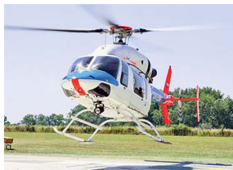
■ Součástí ZZS je i letecká záchranka.