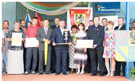
■ Převzetí cen a slavnostní vyhlášení ve vítězné obci Černotín v roce 2015.

ské soutěže získá 100 tisíc, druhé a třetí místo obdrží finanční dar po 50 tisících korunách. Speciální finanční ocenění ve výši 50 tisíc korun bude patřit dalším čtyřem vybraným obcím. Olomoucký kraj se bude podílet rovněž na spolufinancování nákladů na uspořádání slavnostního vyhlášení vítězů krajského kola soutěže ve vítězné obci, a to částkou 100 tisíc korun. Loňským vítězem krajského kola se stala obec Černotín na Přerovsku, v celostátním kole pak skončila třetí. Komplexní informace o soutěži včetně přihlášek najdete na webu soutěže www.vesniceroku.cz . »red