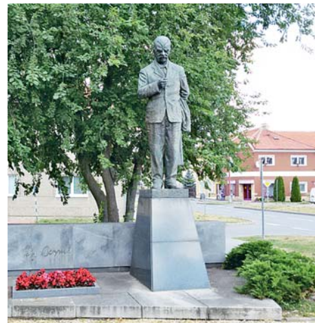
■ Socha básníka Petra Bezruče v městském parku.

Jako největší přínos vidím v tom, že se zástupci obcí pravidelně setkávají