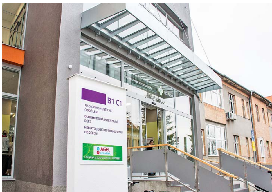
■ Letos otevřený zrekonstruovaný pavilon radiodiagnostiky v přerovské nemocnici.

V lednu letošního roku se stala novým majitelem Jesenické nemocnice společnost Agel, a. s. Převzetí nemocnice předcházelo mnoho dlouhých a složitých jednání a vedení Olomoucké-