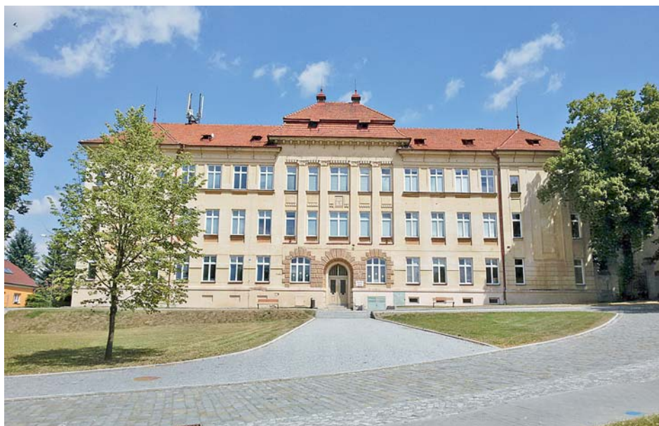
■ 1. stupeň ZŠ se může chlubit novou úpravou prostranství před budovou.

Pro příští roky se chceme zaměřit na možnou spolupráci v oblasti likvidace odpadu a rozvinout spolupráci i v oblasti kulturně-společenské a sportovní, například uspořádáním nějakých sportovních her mikroregionu. »red