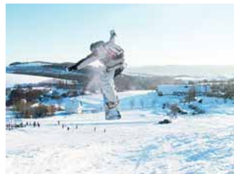
Lyžařský vlek v Janoušově