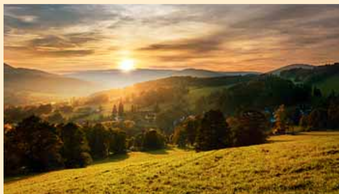
■ Vojtěch Dornák z Bělé pod Pradědem: Západ slunce v Jeseníkách – pohled z Priessnitzových lázní