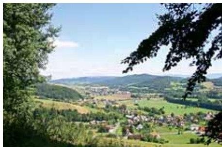
Pohled do regionu

Státního fondu životního prostředí provést plošnou plynofikaci všech obcí nákladem 70 milionů korun. Jedná se o největší plošnou plynofikaci obcí realizovanou v Olomouckém kraji. V roce 2005 jsme s příspěvím dotace ze SROP realizovali projekt „Propagace regionu Ruda“. Spočíval ve vytvoření internetových stránek, zpracování studie společné cyklostezky, vyznačení cyklotrasy č. 51 procházející jednotlivými obcemi, instalaci informačních tabulí pro turisty a vydání propagačního materiálu o celém regionu a členských obcích.