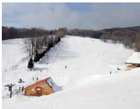
Lyžařský areál – Lhota | Foto: archiv mikroregionu Ruda

Obcím regionu se podařilo v letech 2002–2004 s využitím podpory ze