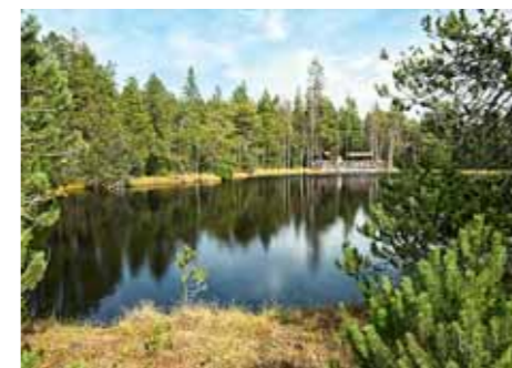
Mehové jezírko Rejvíz

Každý měsíc se schází rada mikroregionu, řeší aktuální problematiku