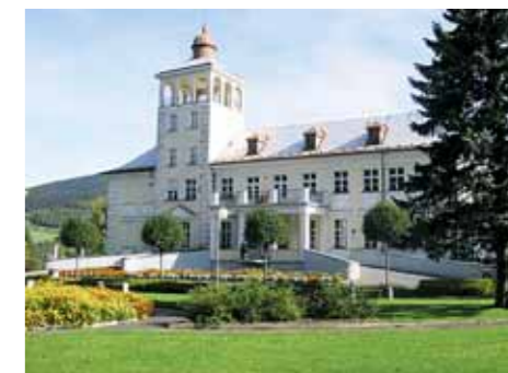
Sanatorium Edel ve Zlatých Horách