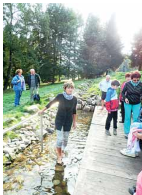
■ Výlet seniorů do Balneoparku v jesenických lázních.