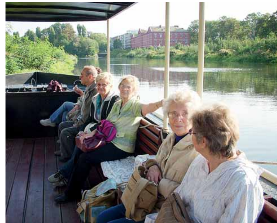
■ Součástí jednoho z výletů pro seniory byla i plavba Ololodí po řece Moravě v Olomouci.

Největším lákadlem pro seniory z jižní části kraje byly výlety do oblastí Jeseníků a okolí Zlatých Hor, ze severu pak k nejbližším zájezdům patřily výlety do Prostějova, Plumlova a do zvonařské dílny v Brodce u Přerova. S velkým ohlasem se setkaly komentované prohlídky v městských památkových zónách Šumperk, Lipník nad Bečvou, Zábřeh na Moravě, Litovel a výklad ve Zlatorudných mlýnech ve Zlatých Horách. »red