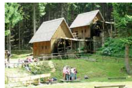
Zlatorudné mlýny ve Zlatých Horách

Zřejmě se jedná o několik společných úspěšně dokončených společných projektů. Postupně to byly projekty v oblasti propagace, projekty v rámci POV, projekt řešící nákup nádob pro bioodpad dotovaný z Operačního programu Životní prostředí. Nejnáročnější byly dva navazující projekty zaměřené na integraci sociálně vyloučených osob na trh práce. Projekty