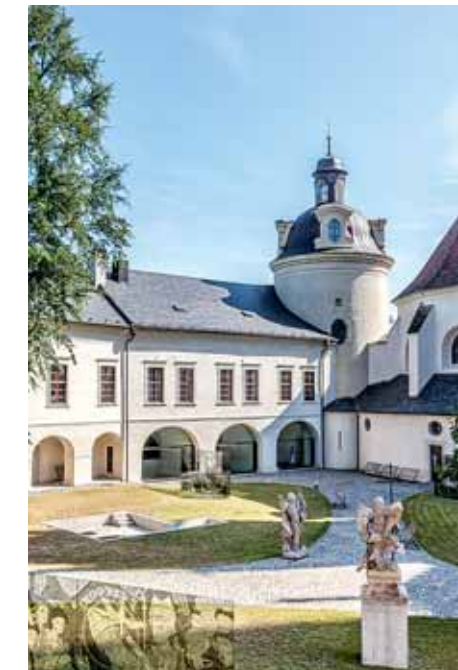
Arcidiecézní muzeum