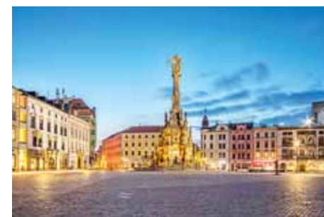
Sloup Nejsvětější Trojice – památka UNESCO