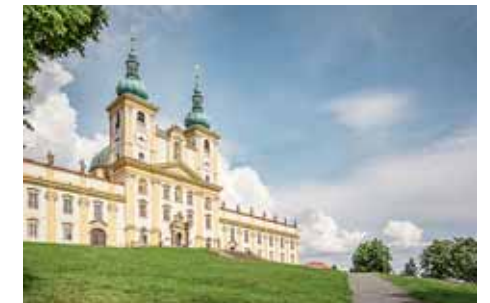
Poutní místo – Svatý Kopeček