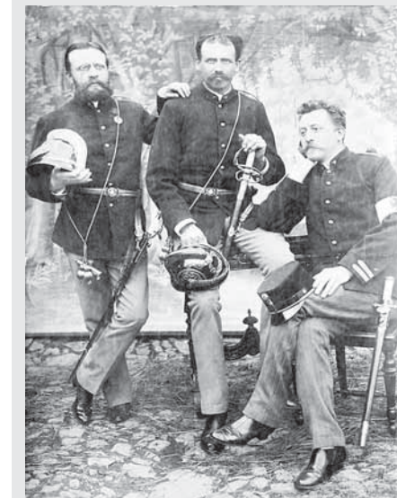
První čeští hasiči v Lošticích, 1894