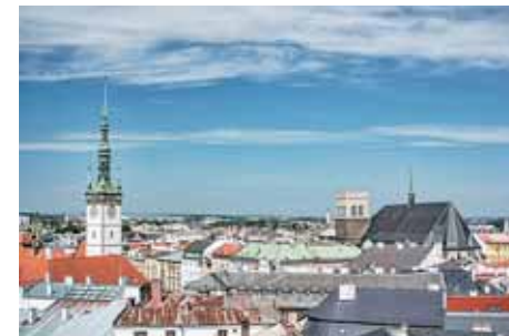
Olomouc je centrem mikroregionu

Dokončovaná strategie rozvoje olomoucké aglomerace (ITI) má pro další plánovací období EU definovány cíle a projekty (např. doprava, protipovodňová opatření), které se svým přesahem týkají i části obcí mikroregionu Olomoucko. Také další koncepce rozvoje cyklotras se týká obcí mikroregionu. Za důležitou považujeme i spolupráci v oblasti marketinku cestovního ruchu apod. »red