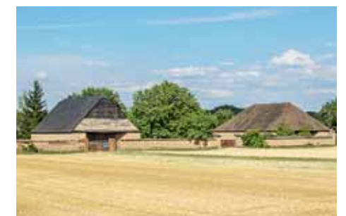
Hanácký skanzen v Příkazech