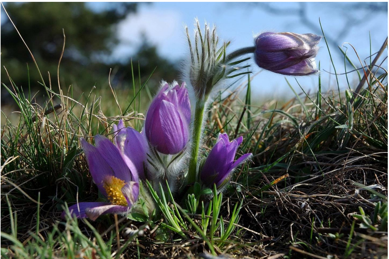
Obr. č. 3 – koniklec velkokvětý ( Pulsatilla grandis )

Více informací k jednotlivým lokalitám i soustavě Natura 2000 naleznete na internetových stránkách http://www.nature.cz/ .