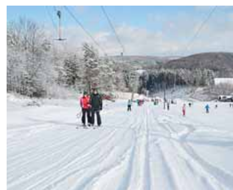
■ Sjezdovka v Kladkách.

a obcí ČR v realizaci projektu Podpora meziobecní spolupráce.