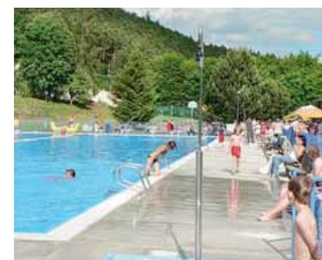
■ Koupaliště na Stražisku. | Foto: archiv obce