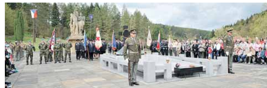
Pietní akce k 70. výročí od vypálení obce, památník v Javoříčku.