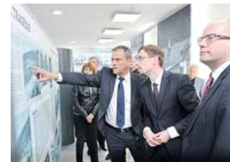
Expozici si prohlédli i premiér Bohuslav Sobotka.