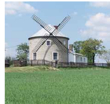
■ Větrný mlýn v Suchdole-Jednově. | Foto: archiv obce

Mikroregion Konicko realizoval několik společných projektů. Mezi nejúspěšnější počítáme například projekt na rozvoj cestovního ruchu, stavby dětských hřišť, která vznikla v několika obcích, rekonstrukce obecních rozhlasů ve vybraných obcích nebo nákup majetku pro pořádání kulturně-společenských akcí v jednotlivých obcích. Díky podpoře Olomouckého kraje jsme v minulosti pořídili vybavení pro kulturně-společenské akce – velkoplošný stan, skákací hrad, skákací skluzavku, ozvučení, osvětlení. Toto vybavení slouží pravidelně od května až do září pro řadu akcí, které pořádají obce ve spolupráci s místními spolky. Mikroregion Konicko je zároveň smluvním partnerem Svazu měst