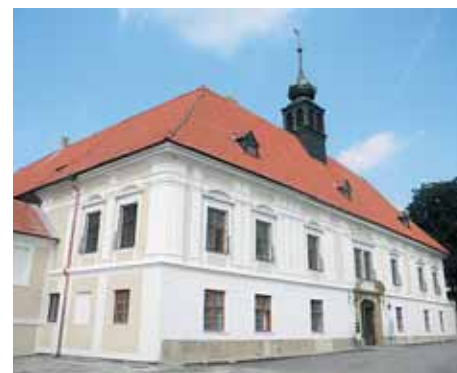
■ Zámek v Konici.