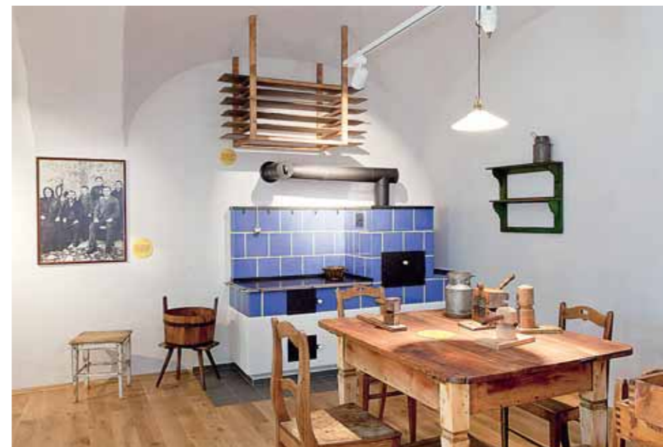
■ Muzeum tvarůžků ukazuje i původní proces výroby této pochoutky.