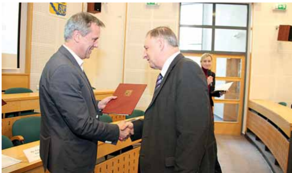
■ Smlouvy o podpoře si převzali osobně zástupci klubů a škol 6. února na krajském úřadě.

Zástupcům třech desítek sportovních organizací předal hejtman Jiří Rozbořil společně s náměstkem Radovanem Rašákem smlouvy o podpoře z krajského rozpočtu. Peníze budou sloužit jednak k podpoře činnosti špičkových klubů hrajících nejvyšší soutěže a zároveň jako finanční pomoc při pořádání významných akcí. Smlouvy o příspěvku z rozpočtu Olomouckého kraje v rámci přímé podpory si převzali také zástupci Moravské vysoké školy Olomouc, Vysoké školy logistiky v Přerově a Univerzity Palackého v Olomouci. Školy získají celkem 10 milionů korun, sportovní oddíly 27,7 milionu a na sportovní akce půjde podpora 13,7 milionu korun. »red