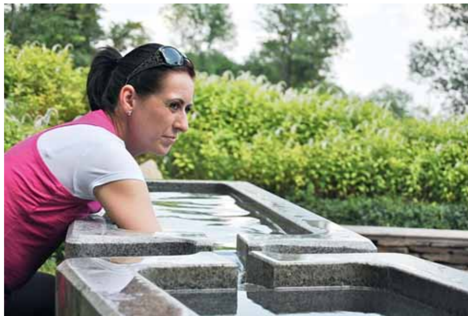
■ Koupel horních končetin, Balneopark Vincenze Priessnitze.