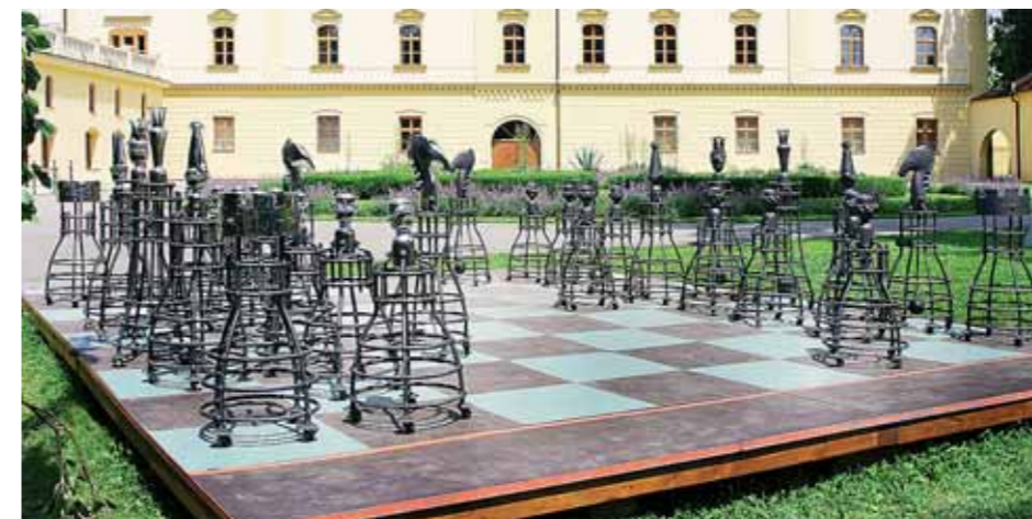
Cenu veřejnosti loni získala exteriérová výstava Kov v městě v Lipniku nad Bečvou.