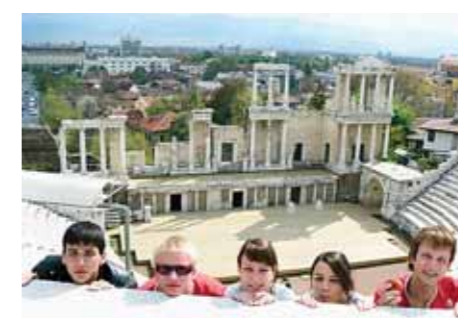
■ Součástí výuky je i návštěva Španělska.

Bilingvní studium je zakončeno maturitní zkouškou certifikovanou českou i španělskou stranou a maturanti obdrží dvě maturitní vysvědčení. Pro studenty je organizována řada akcí a soutěží, mají možnost získat i mezinárodní jazykový certifikát D.E.L.E., který odpovídá stupni jazykové úrovně B2 a umožňuje studentům pokračovat v dalším vysokoškolském vzdělávání přímo na španělských univerzitách a školách. Současně ulehčuje hledání a získání práce ve španělsky mluvících zemích, ale konečnou u nás, protože vedle poža-