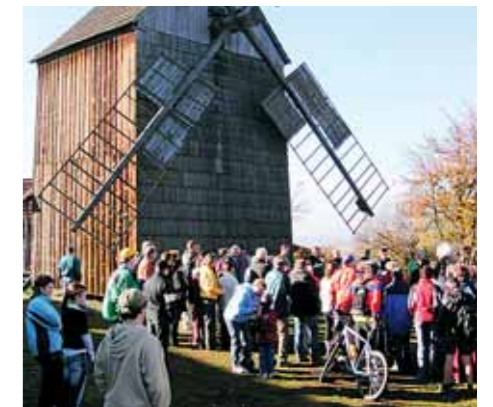
■ Partutovský mlýn.