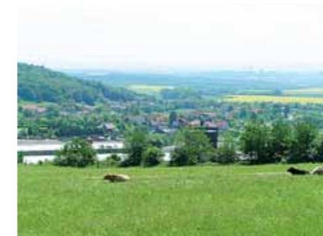
■ Pohled do Moravské brány.