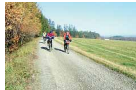
■ Region Rozvodí prolíná řada cyklostezek.

Mikroregionu se dařilo úspěšně žádat z dotačních titulů Olomouckého kraje