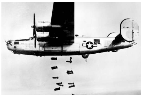
Pohled na čtyřmotorové bombardéry B-24 Liberator 15. USAAF. Z letounů tohoto typu byly dne 20. 11. 1944 svrženy bomby také na Přerov.

Pondělní dopoledne 20. listopadu předposledního válečného roku se pro obyvatele města na dolním toku řeky Bečvy na prvý pohled příliš nelišilo od jiných všedních dní. Šedou každodenní realitu obyvatel východní části Protektorátu Čechy a Morava zpríjemňovalo od rána vcelku hezké slunečné počasí s občasnou oblačností. V průběhu dopoledne pozorovali Přerované vysoko na obloze řady lesknoucích se stříbrných čárek - stovek amerických bombardérů, které si moravským nebem opět razily cestu ke svým hornoslezským průmyslovým cílům. Jejich přilet byl ostatně předem avizován ranním hlášením rozhlasu (pamětníkům důvěrně známé „Achtung, achtung! Wir geben die Luftlagemeldung...“), jakmile americké stroje od jihu pronikly do vzdušného prostoru rakouských Korutan a Štýrska.