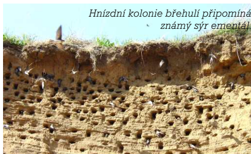
Hnízdní kolonie břehulí připomíná známý sýr ementál.

Na kontrolu přežívání dospělých ptáků je zaměřen (opět mezinárodní) projekt RAS. Ten používá zcela jinou metodiku, založenou na odchytu dospělých ptáků na jedné lokalitě více let po sobě. V rámci projektu RAS sledujeme přežívání břehule říční v pískovně u Pouzdřan. Obě akce využívají jako základní techniku výzkumu kroužkování ptáků. Výrazně jsme se podíleli také na dvou dlouhodobých odchytových akcích, při kterých se kroužkují rákosinné druhy ptáků. Jedna probíhá již 21 let na největším moravském rybníce Nesyt a druhá 12 let na Bartošovických rybnících v CHKO Poodří.