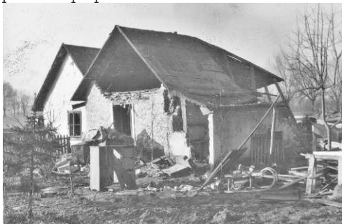
Koliby u Rybníka po bombardování 20. 11. 1944.

Rovněž významný železniční uzel (se seřazovacím nádražím a lokomotivním depem), na němž se Přerov nacházel, i nedaleké Němci využívané vojenské letiště v Bochoři mohly přitáhnout pozornost spojeneckých letců, což se ostatně potvrdilo již 14. října, kdy stíhači-„hloubkaři“ na oba dva zmíněné cíle zaútočili. Osudného pondělního dopoledne si však Přerované blížíci se tragické události, jež měly zanedlouho fatálně změnit osudy řady z nich, prozatím příliš nepřipouštěli.