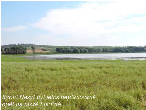
Rybní Nesyt byl letos neplánovaně opět na nízké hladině.

V prázdninovém čase proběhlo v režii odborných pracovníků ORNIS několik akcí. Již šestým rokem se podařilo zajistit bezproblémový průběh odchytu ptáků v rámci projektu CES, při kterém sledují v prostředí lužního lesa u Záhlinic úspěšnost hnízdění ptáků.