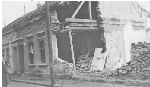
Pohled na zničený dům č. 133 v Kozlovské ul., v němž přišli o život manželé Privaroví (archiv J. Schön).