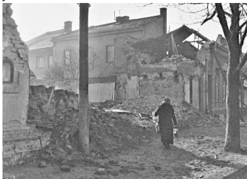
Jeden ze zničených domů v ulici Trávník (Muzeum Komenského v Přerově).