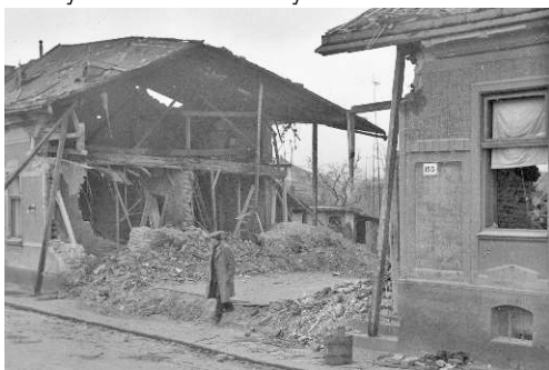
Pohled na dům č. 153 v Kozlovské ul., kde zahynuli tři členové rodiny Sadilovy.