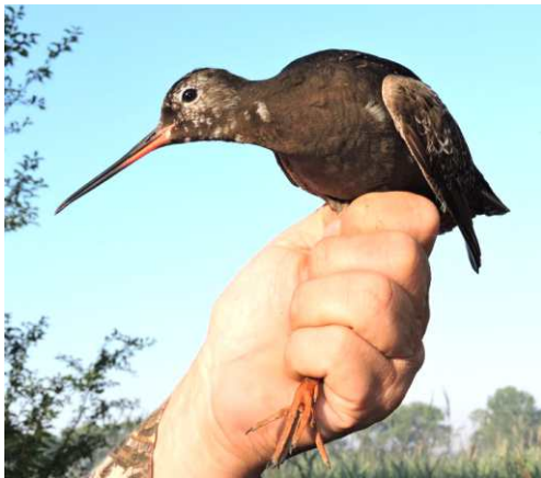
Na volné plochy bahen Nesytu zavítali i hosté z dalekých polárních končin, jako tento vodouš tmavý, ještě ve svatebním opeření.

Celkové výsledky z letošní sezóny ukazují, na rozdíl od roku loňského, velmi dobrou úspěšnost hnízdění. Jak v Záhlinicích při CES, tak i při RAS odchytu břehulí u Pouzdřan jsme chytili rekordní počty ptáků. V Záhlinicích to bylo 447 jedinců 46 druhů ptáků, v pouzdřanské pískovně potom 382 starých a 119 mladých břehulí, včetně jedné samice s maďarským kroužkem. Podíleli jsme se i na zahájení mapování hnízdního rozšíření ptáků v Evropě, celkem jsme zpracovávali čtyři mapovací čtverce. Jako jedni z mála u nás jsme kompletně v těchto čtvercích zjišťovali i kvantitativní data tzv. hodinovou metodou. Za zmínku zcela jistě stojí fakt, že celoevropským koordinátorem tohoto mapování je Česká společnost ornitologická ve spolupráci se společností katalánskou.