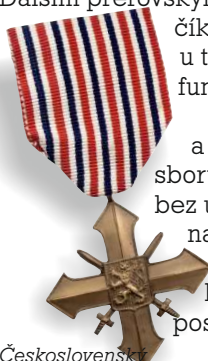
Československý válečný kříž 1939