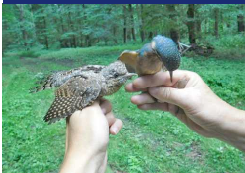
Jak chycený krutihlav (méně známý druh šplhavce), tak i ledňáček intenzivně kroutí hlavami nad tím, že se nechali odchytil do sítí.

uprostřed a ke konci hnízdního období. Pozadu jsme nemohli zůstat ani při mezinárodním sčítání hnízd čápa bílého. Mimo náhodná zjištění v jiných částech republiky jsme koordinovali mapování v okrese Přerov a částečně i v jinde v Olomouckém kraji. Na většině hnízd byla letos úspěšně odchována mláďata; některá z nich jsme v případě dostupných hnízd i kroužkovali. Dší práci v terénu představovalo detailní sledování úspěšnosti hnízdění rybáků obecných na umělých ostrůvcích na šterkovně v Hulíně.