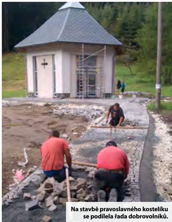
Na stavbě pravoslavného kostelíku se podílela řada dobrovolníků.