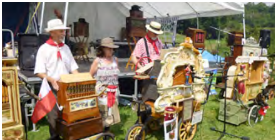
Pekařovská pouť je neodmyslitelně spjata s flašinami.

Už tento víkend startuje v Pekařově jedenáctý ročník Pekařovské pouti. Nic pro příznivce stánkové veteše, hlasité reproduktorové hudby nebo herních přístrojů. Naopak milovníci tradice, historie a všeho starého si jistě přijdou na své. Na akci se chystají také flašinetáři, právě tyto hudební nástroje se totiž kdysi v obci vyráběly.