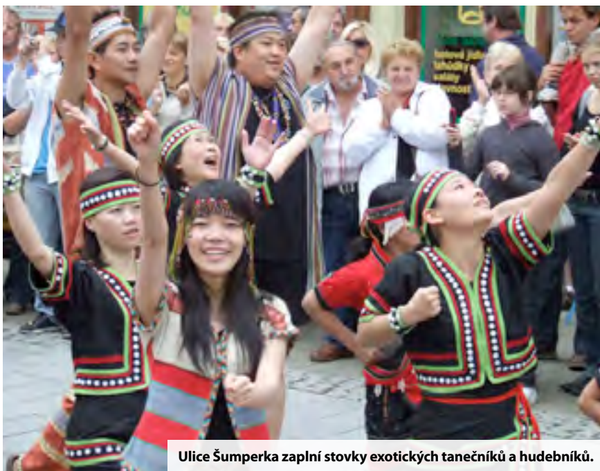
Ulice Šumperka zaplní stovky exotických tanečnicků a hudebníků.

Více než dvě desítky souborů se představí na čtyřadvacátém ročníku Mezinárodního folklorního festivalu v Šumperku. Jedna z nejznámějších folklorních přehlídek v republice letos proběhne od středy 13. do pondělí 18. srpna. Svoji kulturu, zvyky a tradice lidem přiblíží na šest set tanečnicků, zpěváků a muzikantů. „Prostřednictvím lidových písní, hudby, tanců a lidových her si tímto způsobem připomínáme zvyky a obyčeje našich předků. A u zahraničních souborů se snažíme, aby lidé poznali jednotlivé země jinak, než je vidí například