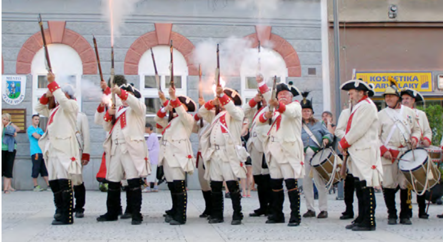
Součástí zlatohorských oslav bude rekonstrukce historické bitvy.

Hned o týden později, v sobotu 2. srpna budou pokračovat zlatohorské oslavy tentokrát sportovním kláním, konkrétně šachovým a tenisovým turnajem.