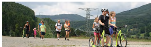
Areál Kouty nabízí 30 kusů oblíbených koloběžek k zapůjčení.

Areál Kouty nabízí sportovní vyzítí nejen pro náročné sportovce hledající adrenalinové zážitky, ale také pro rodiny s dětmi. Jednou z možností, jak prožít v Jeseníkách pohodový den je zapůjčení stále více oblíbené koloběžky.