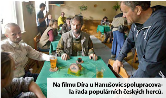
Na filmu Díra u Hanušovic spolupracovala řada populárních českých herců.

Debutový film známého herce a režiséra Miroslava Krobota, který se celý natáčel ve Vikanticích na Jesenícku, slaví ještě před svou premiérou první úspěch. Pořadatelé MFF Karlovy Vary, který začne 4. července, zařadili Díru u Hanušovic do hlavní soutěže 49. ročníku největšího filmového svátku v Česku. Při práci na filmu Díra u Hanušovic se sešla řada vynikajících hereckých osobností. „Celý film se natáčel na Jesenícku