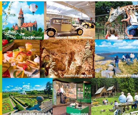
Hrad Bůzov, Veteran Arena, Olomouc, ZOO Olomouc, Loštice, Javoritzké jeskyně, Dlouhá Stráň, Kvetná zahrada, Kroměříž, Hanušovice, Zlaté Panny