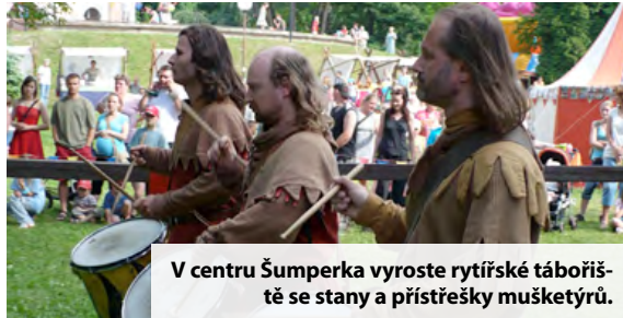
V centru Šumperka vyrostle rytířské tábořiště se stany a přístřešky mušketýrů.