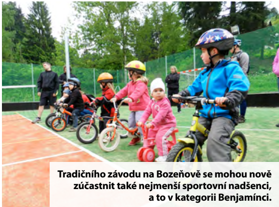
Tradičního závodu na Božeňově se mohou nově zúčastnit také nejmenší sportovní nadšenci, a to v kategorii Benjamínci.

V sobotu 7. června se bude na Božeňově konat tradiční závod, který účastníci provede malebnou přírodou Zábřežské vrchoviny. Pořadatelé letos nabídnou také dvě méně náročné kategorie - pro hobby jezdce s názvem Chataři (29,4 km) a v kategorii Benjamínci budou závodit děti na odrážedlech.