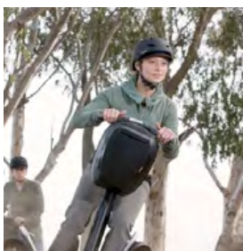
Horský hotel Sněženska nabízí vedle jiné zábavy i projížďku na elektrickém vozítku Segway.

V ekologicky čisté krajině horského masívu Králický Sněžník (1.424 m.n.m.), uprostřed divoké romantické přírody, na dosah pramene řeky Moravy, poblíž unikátní oblasti evropského trojrozvodí leží nově zrekonstruovaný Horský hotel Sněženska*** .