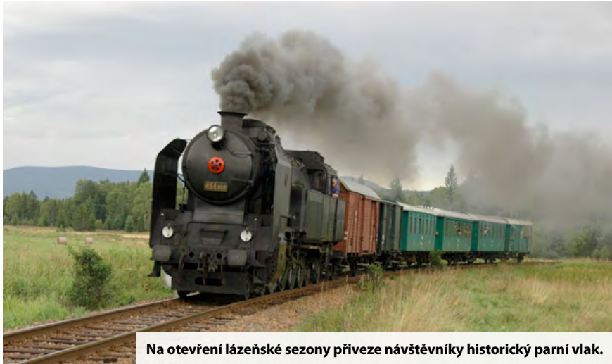
Na otevření lázeňské sezony přiveze návštěvníky historický parní vlak.

Lázeňské město uprostřed nejkrásnějších hor i letos zahájí novou sezonu velkolepou oslavou. Přípravy na největší jesenícký svátek vrcholí a pořadatelé slibují, že návštěvníci se rozhodně nebudou nudit. Přespolní hosty doveze do centra dění historický parní vlak! Chybět nebudou ani koncerty špičkových umělců.