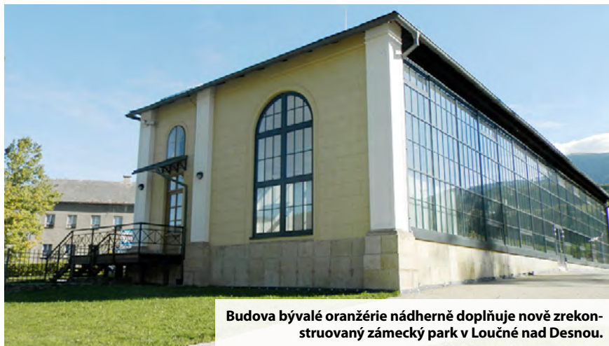
Budova bývalé oranžérie nádherně doplňuje nově zrekonstruovaný zámecký park v Loučné nad Desnou.

Loučná nad Desnou je zase o kousek atraktivnější místem pro turisty i místní obyvatele. Ve zrekonstruovaném zámeckém parku byla obnovena chátrající budova bývalé zámecké oranžérie. Slouží jako kulturní dům, který v obci mnoho let chyběl. Architektonicky cenná stavba se nachází přímo ve středu obce v areálu zámeckého parku. S pomocí finančních prostředků z Evropské unie se podařilo vrátit budovu za pomoci dochované fotodokumentace do původní podoby zámecké oranžérie z 19. století. „Budova zámecké oranžérie nádherně doplňuje zámecký park a ladí s obnovenou zámeckou kaplí. Dominantní částí stavby je prosklená jižní stěna orientovaná do zámeckého parku, která