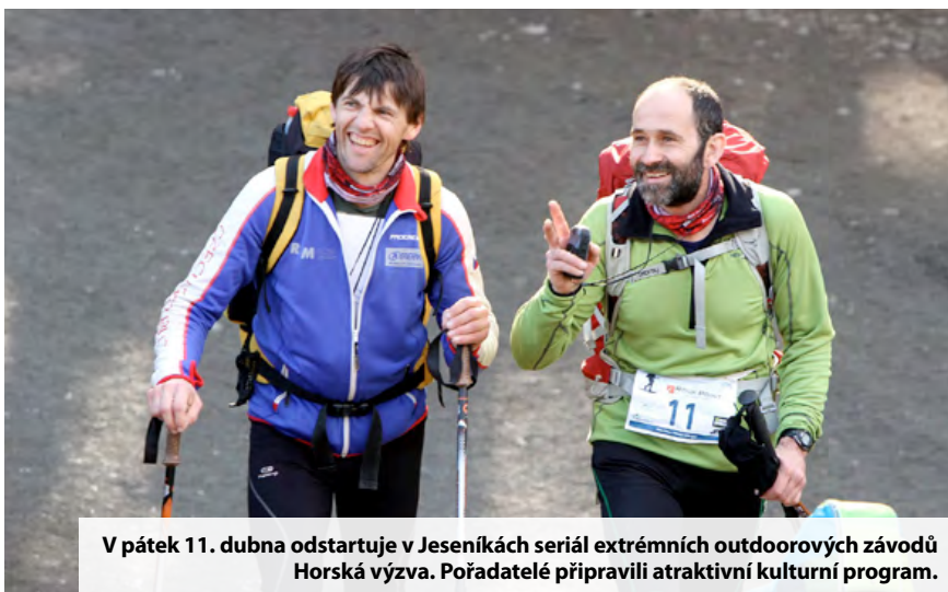
V pátek 11. dubna odstartuje v Jeseníkách seriál extrémních outdoorových závodů Horská výzva . Pořadatelé připravili atraktivní kulturní program.

První závod odstartuje v pátek 11. dubna, kdy vyrazí účastníci na nejdější trať pět minut před půlnocí, a proto také doprovodný program odstartuje již během pátečního podvečera. V areálu Kouty vyrostle obří letní