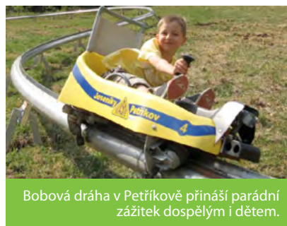
Bobová dráha v Petríkově přináší parádní zážitky dospělým i dětem.

Už v polovině dubna zahájí provoz letní bobová dráha v Petríkově . Na návštěvníky čeká dobrodružství dlouhé téměř kilometr, s patnácti zatáčkami, třemi terénními zlomy a se sto metry převýšení.