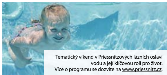
Tematický víkend v Priessnitzových lázních oslaví vodu a její klíčovou roli pro život. Více o programu se dozvíte na www.priessnitz.cz .

Priessnitzovy léčebné lázně v Jeseníku získaly věhlas díky životodárné síle horských pramenů a vodoléčbě svého zakladatele Vincenze Priessnitze. Letos si už podruhé zajímavým programem připomenou světový den vody a tedy i klíčovou roli vody pro život.