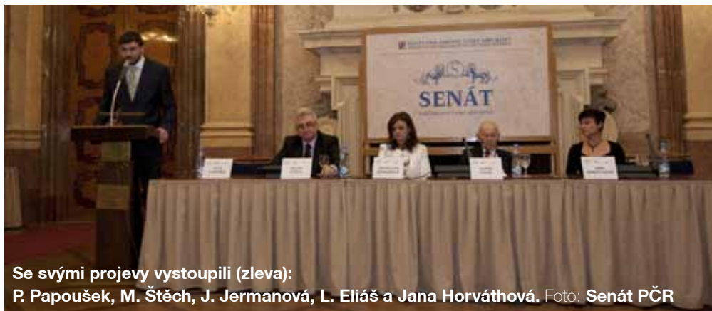
Se svými projevy vystoupili (zleva):