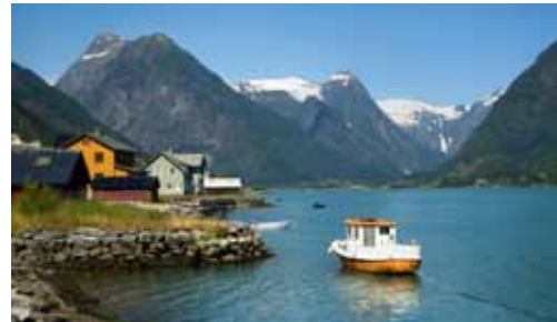
Norský fjord

NNO mohou předkládat „velké“ projekty ve čtyřech prioritních oblastech: lidská práva, děti a mládež v ohrožení, sociální inkluze a