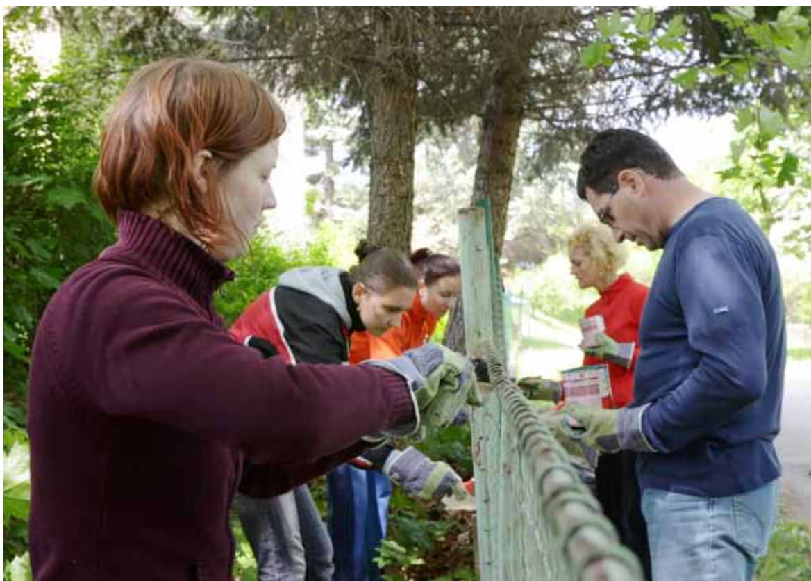
Zaměstnanci společnosti Siemens ČR při práci.

remní školkou v Praze, v Ostravě ji budeme otvírat v tomto roce. Pro všechny zaměstnance, jejichž pracovní pozice to dovolují, platí tzv. jádro pracovní doby, které je definováno od 10.00 do 14.00 hodin. V této době musí být pracovníci na pracovišti a zároveň musí odpracovat smluvně určený počet hodin, vlastní rozložení času je pak na každém jednotlivci. Víme, že toto nastavení umožňuje efektivně pracovat s časem jak mladým rodinám, tak i těm, kdo pečují třeba o rodiče-seniors nebo nemocné členy rodiny. Maminkám (ale jsme připraveni i na tatínky), které se vrací po rodičovské dovolené, umožňujeme pracovat na zkrácený úvazek. U pracovních pozic, kde to je technicky možné, mohou zaměstnanci využívat možnosti práce z domova až deset dnů v měsíci.