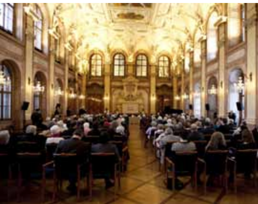
Vzpomínkové setkání se uskutečnilo v prostorech hlavního sálu Senát PČR.

27. leden není obyčejné datum v kalendáři, ale Mezinárodní den památky obětí holocaustu a předcházení zločinům proti lidskosti. Již devátým rokem se při této příležitosti koná slavnostní vzpomínkové setkání, jehož se účastní ti, kteří jsou s holocaustem nějakým způsobem spjati, a další významné osobnosti. Dovolte mi, abych vám popsala letošní ročník této výjimečné akce.