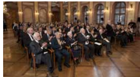
Mezi hosty byli přeživší holocaustu a další významné osobnosti.

dědečkovi a otci, kterým se podařilo přežít, o diskriminaci projevující se už před obsazením nacisty i o současné situaci: „A dnešní nevraživost vůči Romům v něčem náramně připomíná naladění společnosti předválečné. Poučení minulostí nezapomínejme, prosím, i