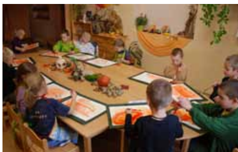
Děti waldorfské školky plně zabrané do kreslení.

Naší snahou je být otevření všem sociálním skupinám. Přestože školné máme, myslím, že je v takové cenové relaci, že si ho běžný rodič opravdu může dovolit. Je to spíše otázkou