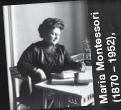
Maria Montessori (1870 – 1952),