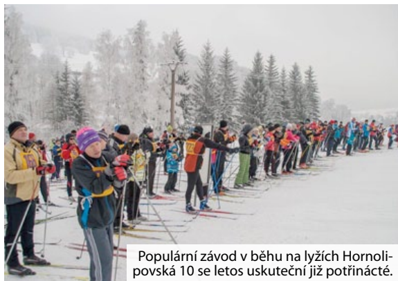
Populární závod v běhu na lyžích Hornolipovská 10 se letos uskuteční již potřinácté.

Už potřinácté se sejdou v Horní Lipové milovníci „bílé stopy“, aby změřili síly v závodě Hornolipovská 10. Závod v běhu na lyžích se uskuteční v sobotu 18. ledna.