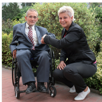
Za významnou pomoc při nastartování projektu „Euroklíč“ v Olomouckém kraji děkujeme Mgr. Yvoně Kubjátové, náměstkyni hejtmanky Olomouckého kraje.