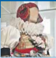
Antonín Šváb Muzeum Hanáckého kroje v Kulturním informačním centru Velká Bystřice

Při návštěvě areálu bývalého vojenského bunkru v Přáslavicích u Olomouce se vrátíte do minulosti. Prohlídková trasa trvá asi hodinu. Během ní jsme zavítali do čtyř podzemních pater, kde se nachází zachovalé a zcela původní vybavení bunkru. Zaujaly nás i servisní prostory pro personál, jako je kuchyň, ložnice, jídelna, či dokonce márnice. Velín je vybaven dobovým nábytkem a zachovaly se i plakáty na zdech a záclonky ve falešných oknech. Vše uvnitř bunkru totiž mělo vyvolávat pocit „normálnosti“, i kdyby venku zuřila atomová válka. Uvnitř by přežilo až 60 osob po dobu deseti dní bez nutnosti zásahu zvenčí. Určitě tento výlet nedaleko krajského města doporučuji, je to silný zážitek.