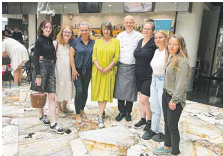
Charitativní akce Den pro mámu je jednou z mnoha akcí, které spolek Dobré místo pro život připravuje.

Co se týče ocenění, jsem vždycky rozpačitá. Zapojovat se aktivně do pomoci druhým považuji za samozřejmost a žádná ocenění neočekávám a popravdě ani nechci. Necítím se v tom dobře. Na druhou stranu vnímám, že lidé, kteří takovát oceňování organizují, chtějí podpořit, dát vědět, že pomoc nad rámec té běžné vnímají, váží si jí a chtějí i inspirovat další. Určitě je dobře, že takové poděkování v sociální