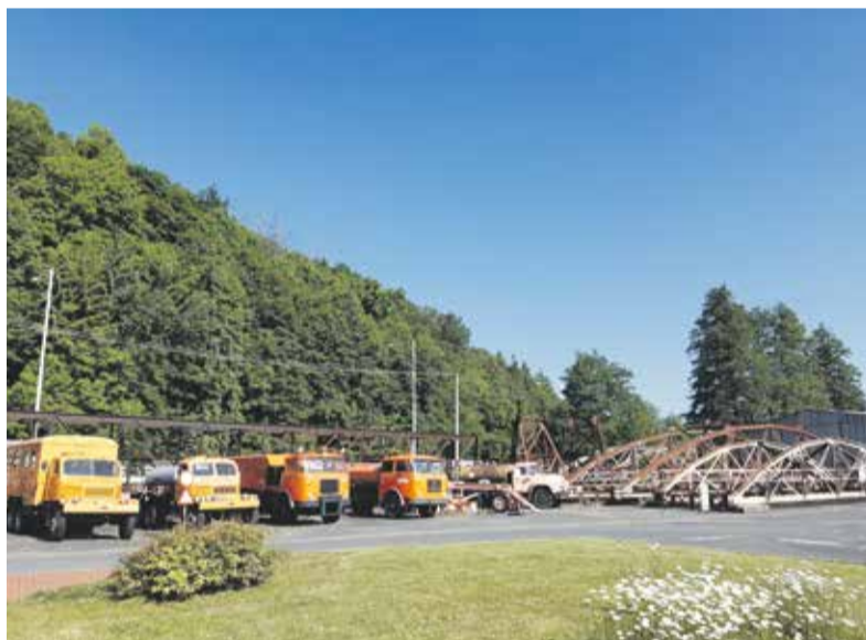
Expozice muzea ukazuje i mostní konstrukce a vyřazené silniční stroje.