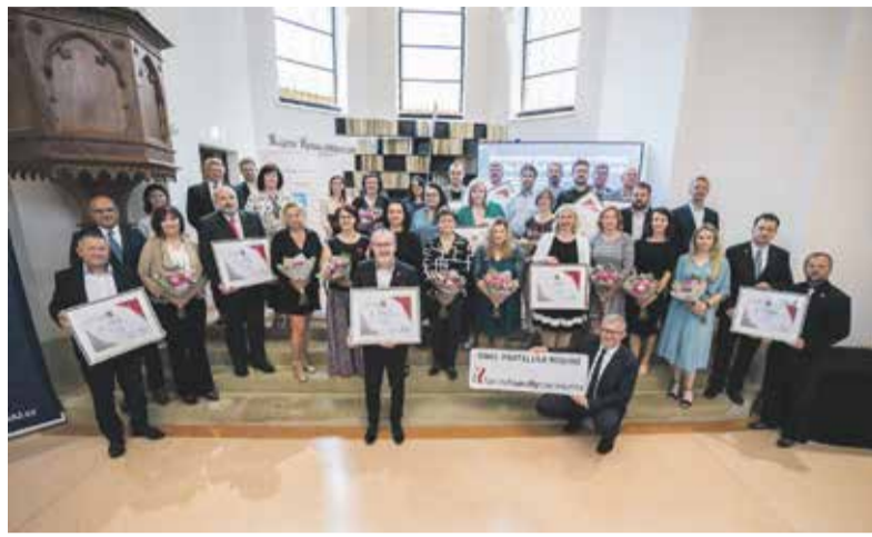
Šest obcí a čtyři města získaly v červnu základní certifikát.

Aby se rodinám dobře v obcích žilo, nemusí se vždy jednat třeba o projekty stavby nových dětských hřišť, ale také o iniciativy, které jsou zaměřené na společné trávení volného času