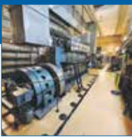
Pavčina Zlámalová Zážitek prohlídky bunkru v Přáslavicích

Při návštěvě areálu bývalého vojenského bunkru v Přáslavicích u Olomouce se vrátíte do minulosti. Prohlídková trasa trvá asi hodinu. Během ní jsme zavítali do čtyř podzemních pater, kde se nachází zachovalé a zcela původní vybavení bunkru. Zaujaly nás i servisní prostory pro personál, jako je kuchyň, ložnice, jídelna, či dokonce márnice. Velín je vybaven dobovým nábytkem a zachovaly se i plakáty na zdech a záclonky ve falešných oknech. Vše uvnitř bunkru totiž mělo vyvolávat pocit „normálnosti“, i kdyby venku zuřila atomová válka. Uvnitř by přežilo až 60 osob po dobu deseti dní bez nutnosti zásahu zvenčí. Určitě tento výlet nedaleko krajského města doporučuji, je to silný zážitek.