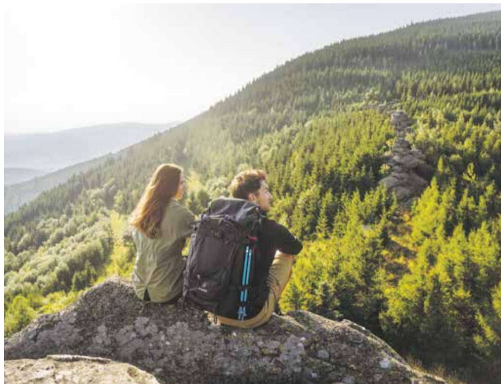
Olomoucký kraj nabízí pro každého něco - od romantických zákoutí pro relaxaci až po adrenalinové zážitky.

Při plánování podpory vychází kraj ze svých strategických dokumentů, radí se s odborníky, kteří v turistickém ruchu pracují, a důležitou zpětnou vazbu získává i od samotných návštěvníků kraje. „Olomoucký kraj podporuje v rámci svých dotačních titulů jak nadregionální akce, turistickou infrastrukturu, tak také cyklo dopravu. Oblíbené je mezi lidmi seniorské cestování do různých lokalit našeho regionu. A zapomenout nemohu ani na program na podporu kinematografie, který byl letos znovu zařazen mezi dotační tituly,“ uvedla uvolněná členka