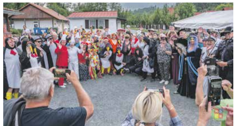
Zcela unikátní projekt Krajská táborová škola v přírodě 2024 se letos konala v Čekyni u Přerova. Více než dvě stovky seniorů si užili nejen tradiční táborové aktivity, jako sportovní olympiádu, kreativní dílny, ale i výuku mobilní gramotnosti, přednášky, besedy, soutěže i celodenní tematický výlet. Akci každoročně pořádá Krajská rada seniorů (KRS) za podpory Olomouckého kraje.