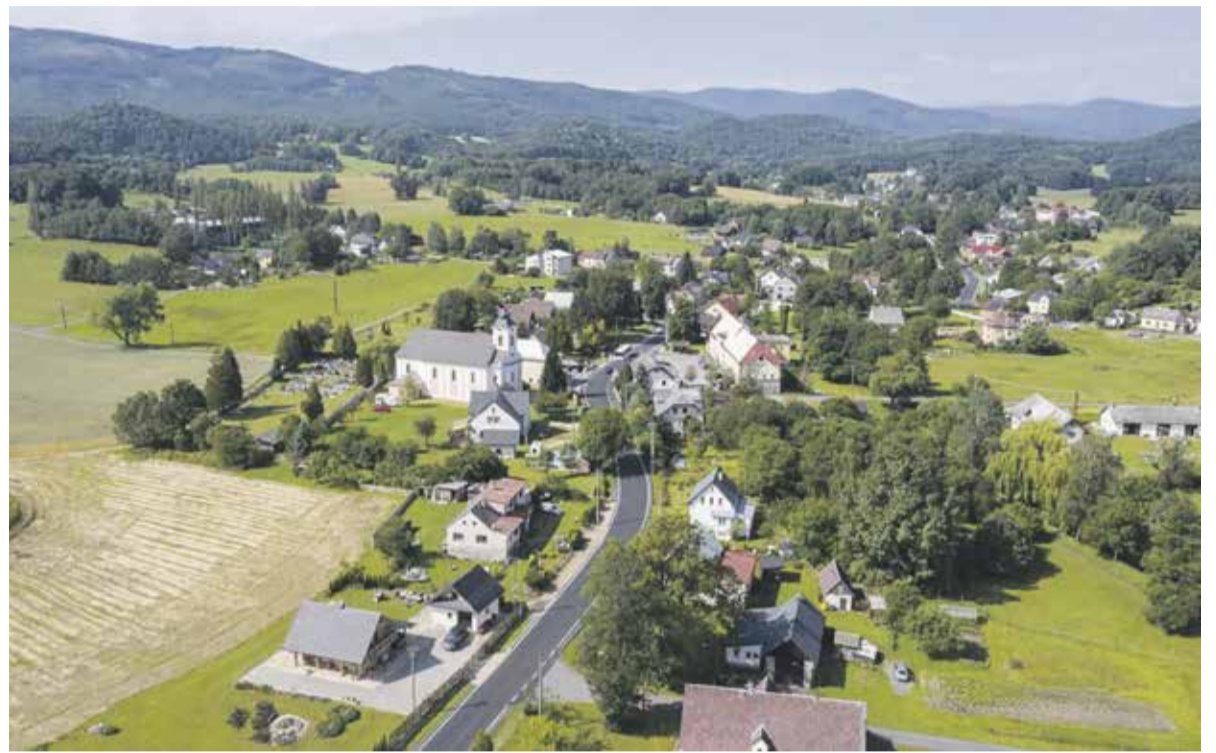
Opravená silnice v Černé Vodě na Jesenicu nebyla zdaleka jedinou, kterou se podařilo v létě dokončit.

Ještě před prázdninami se podařilo stavebním firmám předat do užívání opravené silnice v regionu. Už na začátku června začala sloužit opravená silnice III. třídy v Nasobůrkách u Litovle.