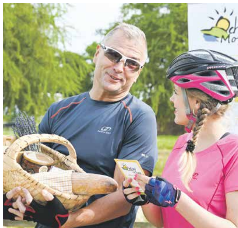
Cyklostezka Ochutnej Moravu na kole patří k oblíbeným trasám.

Nejdelší cyklostezka procházející regionem spojuje severní Evropu s Jaderským mořem. Patří do evropské sítě cyklotras, kde je označována jako Euro Velo 9. Stezka začíná v polském Gdaňsku, odkud pokračuje přes celé území Polska přes Českou republiku, Rakousko a část Slovinska až do chorvatské Puly. Její celková délka činí 1 930 kilometrů. Územím Olomouckého kraje prochází zhruba 121 km této stezky. Protíná Moravskou bránu, Hanou a Dražanskou vrchovinu. Svůj název dostala podle historické obchodní trasy, kudy proudil