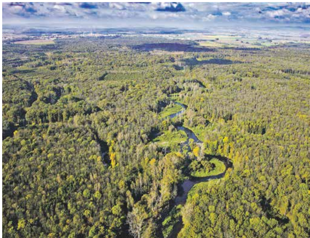
Letecký pohled na CHKO Litovelské Pomoraví.

Josef Suchánek, hejtmán Olomouckého kraje