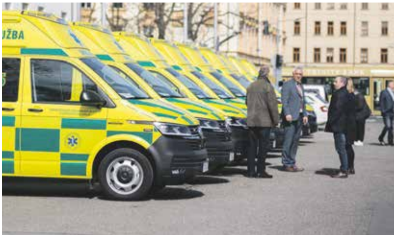
Devět nových sanitek nahradí dosluhující vozy na základnách v celém kraji. V říjnu kraj předá ještě dalších šest vozů.

Záchranáři v kraji dostali na konci března do užívání dalších devět nových sanitních vozů. Sloužit budou lidem na základnách v Olomouci, Šternberku, Litovli, Uničově, Prostějově, Hranicích, Zábřehu a dvě v Šumperku. Hejtnanství se během čtyř let podařilo u příspěvkové organizace obměnit celkem 24 sanitek s kompletní výbavou.