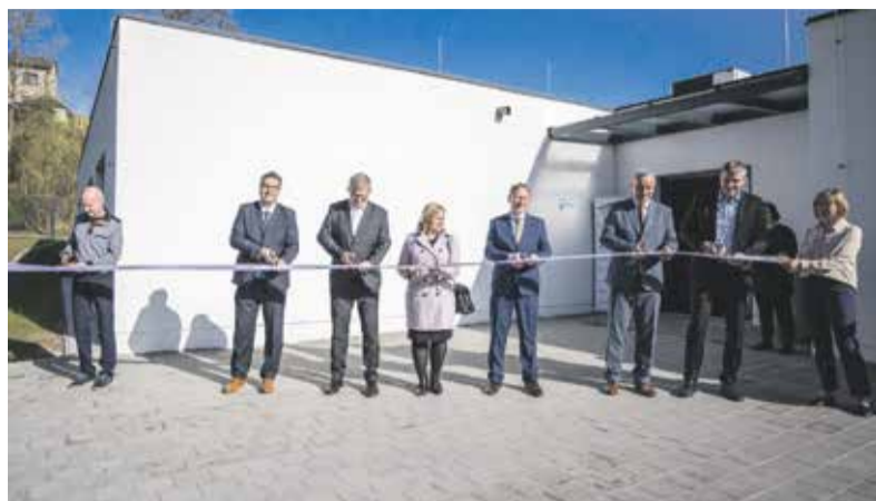
Dům v Zábřehu má dvě oddělené domácnosti pro šest mužů i žen, starat se o ně bude patnáct pracovníků.

umožnily klientům s kombinovaným postižením žít skoro jako doma. Naším cílem je poskytnout důstojný život nejen těm stávajícím klientům domova v Nových Zámkách, ale napříště občanům Zábřehu a Zábřežska tak, aby mohli i po odchodu svých rodičů právě skoro jako doma žít. A mám radost, že děti a mládež ze Zábřehu a díky soužití s novými spoluobčany z domečku na Havlíčkově ulici získají důležité sociální kompetence pro svůj život,” uvedl