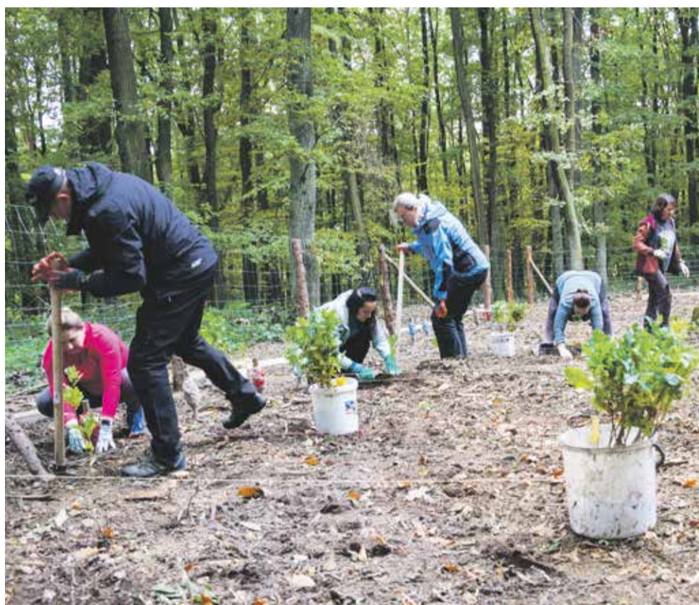
Do zlepšení životního prostředí se pravidelně zapojují i přímo zaměstnanci krajského úřadu třeba na společné akci sázení stromů.

„Nezapomínáme ani na péči o stávající památné stromy a aleje. Ta může mít