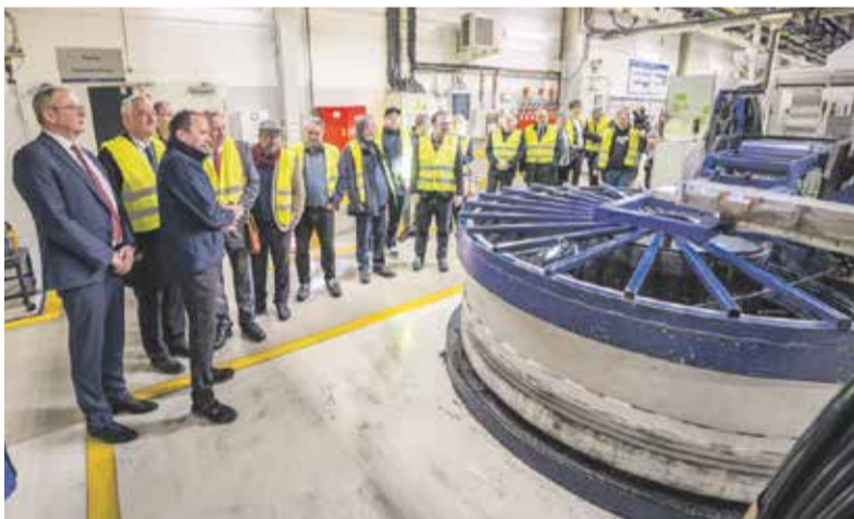
V rámci pravidelných výjezdních zasedání zavítali krajské radní na Prostějovsko, kde se setkali s podnikateli, starosty obcí a zástupci neziskového sektoru. Debata se točila například kolem opravy cest, nedostatku lékařů a především toho, jak může Olomoucký kraj s řešením některých problémů pomoci. Cílem těchto setkání je zjistit přímo v terénu, co konkrétně obyvatelé regionu trápí a s čím jim může hejtnanství pomoci.