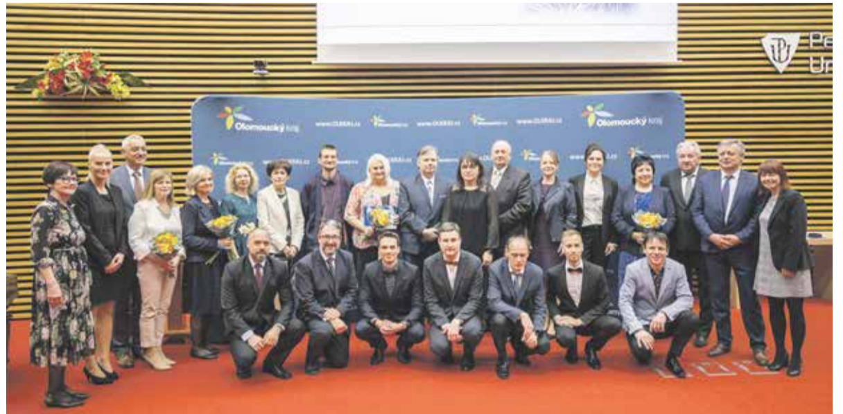
Ocenění převzalo 21 pedagogů v aule Pedagogické fakulty Univerzity Palackého.