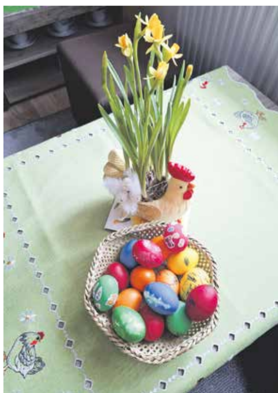
U nás letos byly Velikonoc největší radostí syna Marečka (3,5 roku). Pekl beránka, maloval vajíčka a nakonec šel s tatínkem na šmigrust.

Sledujte náš facebook, kde zanedlouho zveřejníme další fotosoutěž, tentokrát se budeme těšit na vaše rozkvetlé zahrádky, stromy či květinové výzdoby.