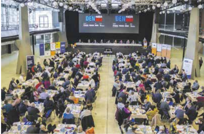
V závěru března se na olomouckém Výstavišti Flora konala konference Den malých obcí, kam přijeli starostové a starostky z celého kraje.