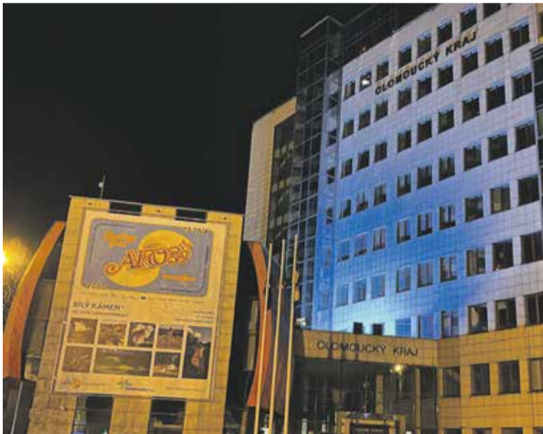
Olomoucký kraj se i letos zapojil do projektu Česko svítí modře – kampaň Naděje pro Autismus, který upozorňuje na problémy lidí s autismem a jejich rodin. Konkrétní pomocí je například vznik speciální školy pro děti s poruchou autistického spektra, která vznikne v Olomouci na Bělidlech v ulici Táboritů.