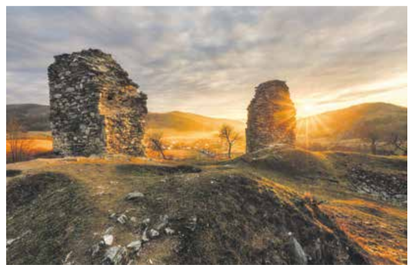
Hrad Brníčko postavili v první polovině 14. století, dnes je cílem výletů.

Delší červená trasa z Nové Hradečné vede naučnou stezkou krajinnou památného Bradla na další malebné vyhlídkové místo – Bradlo. O místě se traduje hned několik pověstí. Jedna z nich například vypráví o čertech, kteří měli za úkol přes noc postavit vysoký hrad. Vyrušil je však kokrhající kohout a svou práci nedokončili – upustili balvany a raději utekli. Objednavatelem stavby byl jistý lakomý sedlák z nedaleké