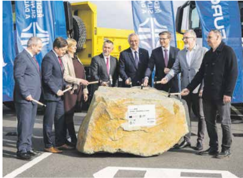
K zahájení dopravních staveb patří tradiční poklepání základního kamene. Zahájení úseku dálnice D35 si nenechal ujít ani ministr dopravy.