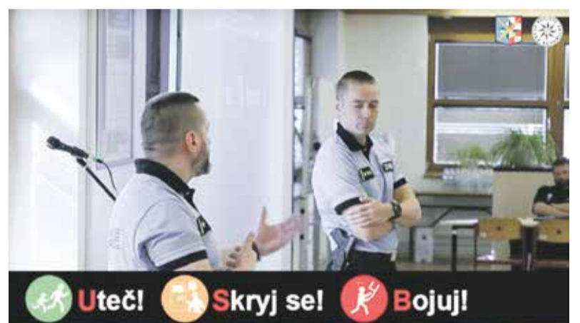
První seminář pro pedagogy připravili policisté pro zástupce šumperských a jeseníckých škol na konci února. Další přednášky jsou připraveny na březen.

Z dotazníků vyplynulo, že jak ředitelé škol, tak i samotní učitelé by uvítali speciální semináře, které by je blíže seznámily s tím, jak v případě krizové situace reagovat. Na to obratem zareagovalo Krajské ředitelství policie Olomouckého kraje,