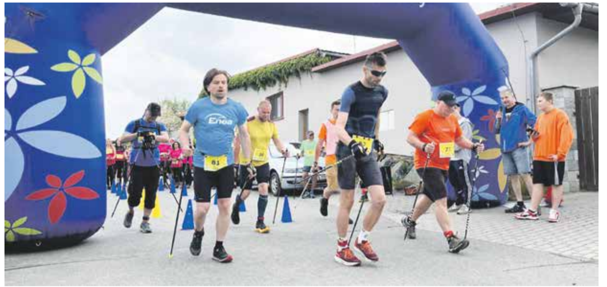
Vloni byl závod vyhlášen jako česko-polský, letos ho zařadili pořadatelé do Národního poháru a očekávají mezinárodní účast.

Spolek Nordic Walking Olomouc připravil na sobotu 8. června první mezinárodní závody Nordic Walking a běhu v Mrsklesích u Olomouce v kategorii Národní pohár. Už teď se mohou přihlašovat závodníci, kteří by chtěli s holemi v rukou změřit síly na trasách v délce 5 a 10 kilometrů, nebo v dětské kategorii na trase 700 metrů a 1,8 kilometru. Běžeckí absolvovali desetikilometrovou trasu. Závod se bude konat především na lesních a polních cestách