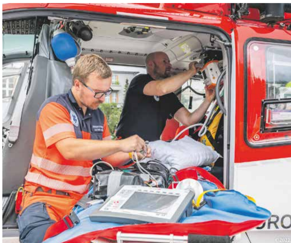
Záchranná služba se může spolehnout na moderní vybavení.

Odborný léčebný ústav v Pasece, jehož zřizovatelem je právě Olomoucký kraj, čeká investice vyšší než 250 milionů korun. Půjde o stavbu nového pavilonu, který výrazně navýší kapacitu ústavu, jenž dnes nabízí například dlouhodobou lůžkovou péči, rehabilitace, fyzioterapii a spoustu dalších lékařských služeb. „Se stavbou nového pavilonu bychom rádi začali ještě v letošním roce. Pasecká léčebna má své odloučené pracoviště také v Moravském Berouně. I tam je plánována řada investičních akcí. Například na zahájení modernizace lůžkového oddělení je v letošním krajském rozpočtu vyhrazena částka 10 milionů korun,“ uvedl