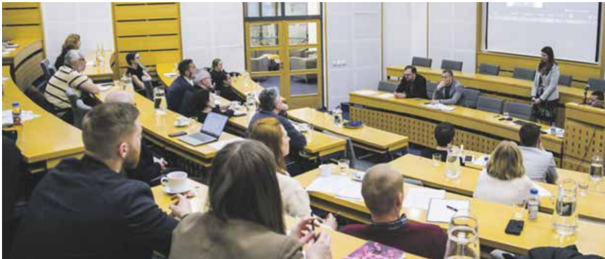
Součástí semináře bylo nejen seznámení s výhodami EFFE SEAL, ale i představení možnosti podpory Olomouckého kraje.

Olomoucký kraj se zapojil do mezinárodní sítě festivalových měst a regionů EFFE Seal. Projekt představuje pro festivaly v kraji mimořádnou příležitost k snadnějšímu navazování spolupráce financování.