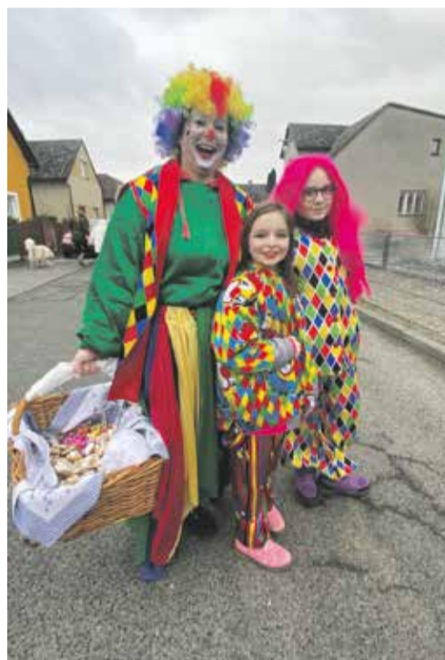
Masopust v Dubicku