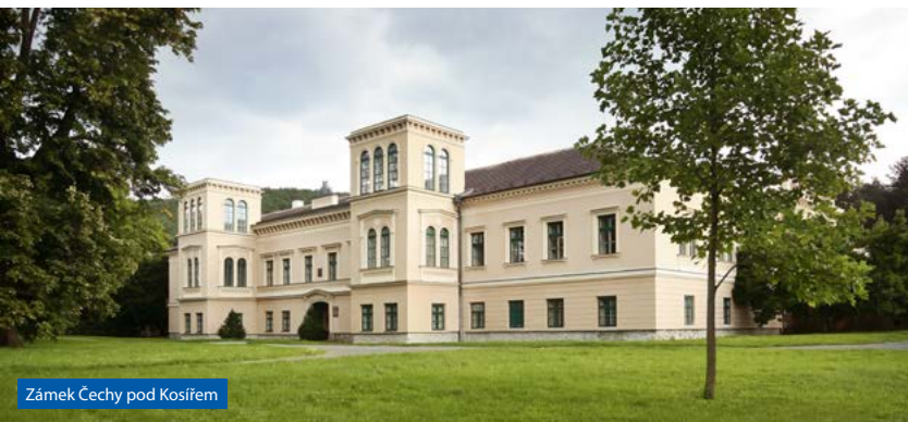
Zámek Čechy pod Kosířem