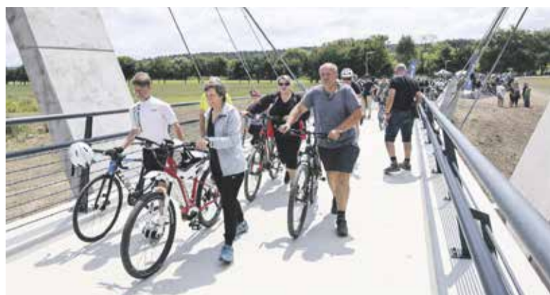
Lávka o délce 140 metrů má komunikaci pro pěší a cyklisty širokou 3,5 metru. Pylony dosahují výšky 20 metrů.

Na financování stavby se kromě kraje podílel také Státní fond dopravní infrastruktury, město Hranice, obce Černotín a Ústí ve spolupráci s Mikroregionem Hranicko. „Na tomto projektu je pěkně vidět, jak úspěšně kraj spolupracuje s dalšími institucemi a investory. Náročné bylo především založení stavby lávky a její uchycení. Lávka, po které cyklostezka vede, spojuje oba břehy