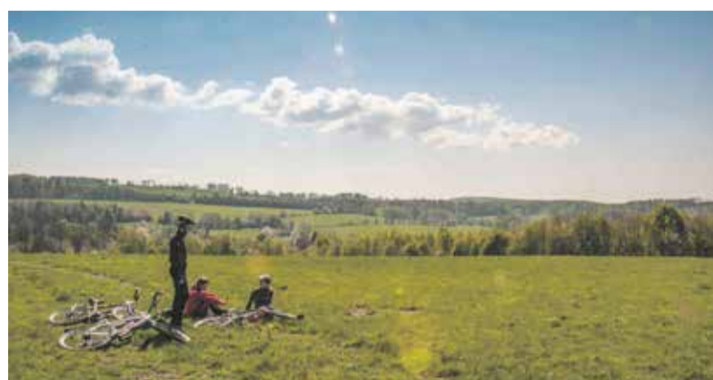
Akce Bílý kámen umožní cyklistům a turistům dostat se do míst, která nejsou jinak přístupná.

„Újezd je velice silně vytížen výcvikem našich a zahraničních vojsk v průběhu celého roku, a to včetně sobot a nedělí. Již tento rok nám dalo spoustu práce spolu s organizátory najít aspoň jediný den, kdy se akce