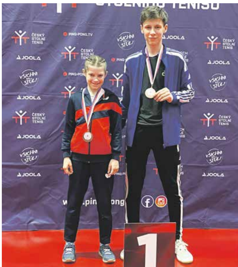
Sourozenci Ratajský patří k našim nejúspěšnějším mladým stolním tenistům.