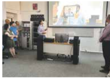
Zapojení moderních technologií do výuky, jako třeba virtuální reality, ztraktivňuje studijní obory.

„Jde o velmi přínosný projekt, protože jsme získali technické a moderní vybavení, které jsme zahrnuli v předstihu i do