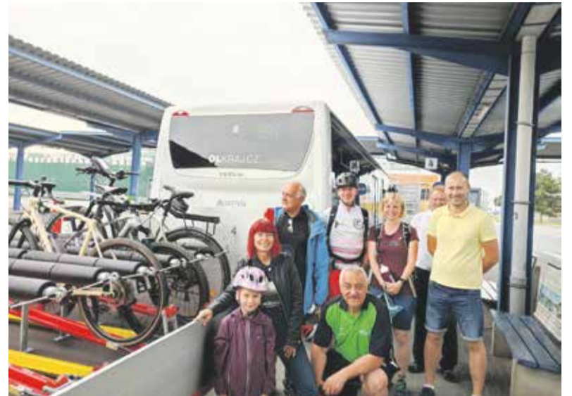
Autobusová linka 904 potáhne během prázdnin do Jeseníků speciální cykloprívěs. Při první jízdě ho vyzkoušelo i vedení kraje.

Během celých letních prázdnin mohou cestující na trase Olomouc – Jeseník využít autobus se speciálním