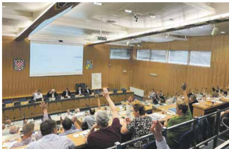
Na valné hromadě spolku Odpady Olomouckého kraje konané začátkem června deklarovala zájem v pokračování projektu velká města z kraje v čele s Olomoucí, Přerovem, Hranicemi či Uničovem.

Spolek Odpady Olomouckého kraje na valné hromadě na začátku června přijal 16 nových vesnic, celkem má tedy spolek nyní 72 členů. Navíc si zvolil nové dva členy vedení, starosty obcí Lutín a Klokočí. „Pro obec má spolek řadu výhod. Postará