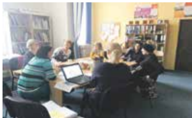
Projekt pomůže ženám najít vhodné a udržitelné zaměstnání.

Účastníkům projektu bude nabídnuto vstupní pracovní poradenství – diagnostika, motivační workshopy – Krok za krokem k uplatnění na trhu práce, vzdělávání pro udržitelné uplatnění na