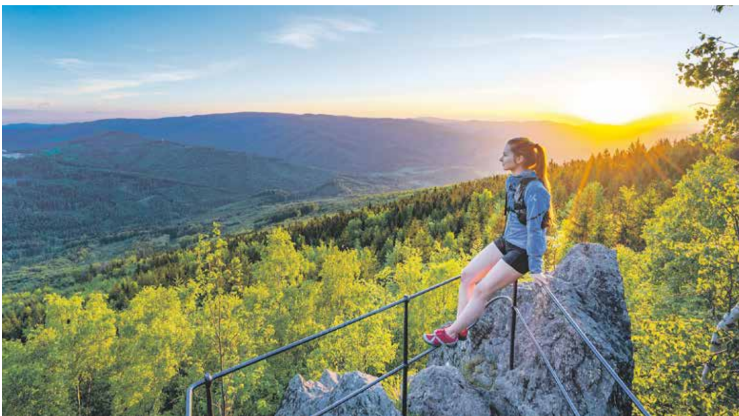
Olomoucký kraj má nejen světoznámé památky, ale i turistické cíle, které zatím čekají na objevení.