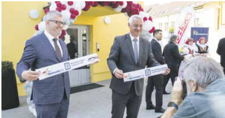
Slavnostního dokončení stavby se zúčastnilo i vedení Olomouckého kraje - náměstek pro sociální oblast Ivo Slavotínek a hejtman Josef Suchánek.