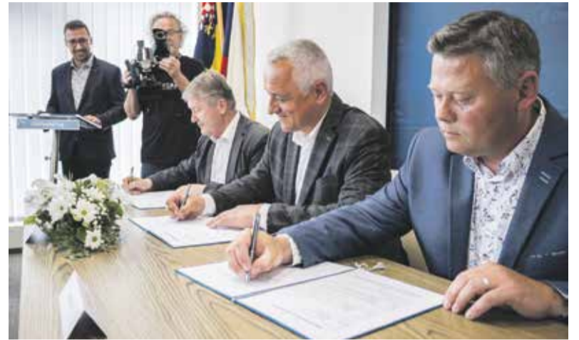
Olomoucký kraj, obec Troubky a Povodí Moravy podpisem memoranda společně zahájily přípravu protipovodňové ochrany Troubek.

Koryto Bečvy v okolí Troubek je nyní schopné pojmout dvacetiletou povodeň, plánovaná