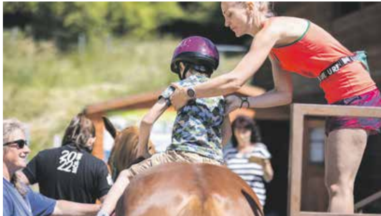
Spolek Ryzáček zajišťuje hiporehabilitaci dětem s různým hendikepem. Díky finanční podpoře kraje je služba pro veřejnost dostupná.

Částka z dotačního Programu na podporu zdraví a zdravého životního stylu podpoří činnost spolku v letošním roce. Jeho hlavní náplní je zajištění hiporehabilitace pro děti s různým zdravotním hendikepem. Jedná se o fyzioterapeutickou metodu využívající přirozený pohyb koně v kroku jako stimul a rehabilitační prvek. Členové Ryzáčku připravují vedle své hlavní činnosti také celou řadu dalších sportovních a kulturních aktivit nejen pro děti a rodiče, ale také pro školní