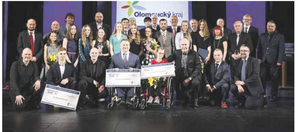
Předání cen se uskutečnilo v pondělí 20. března v prostějovském divadle.