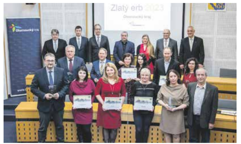
Ocenění se předávala v kongresovém sále krajského úřadu. Pořadatelem soutěže je spolek Český zavináč a vítězové krajských kol postupují do celostátního finále.

„Gratuluji vítězům letošního ročníku i všem starostkám a starostům, kteří webové stránky svých obcí neustále rozvíjejí a zlepšují. Lidé díky tomu snadno najdou informace, které hledají, a ušetří si čas chozením na úřad – nebo se prostřednictvím obecních webů dozví o zajímavých