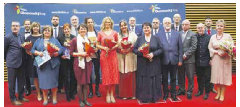
Oceněno bylo letos 21 pedagogů, speciální ceny udělili radní pro oblast školství a děkan Pedagogické fakulty UP.

„Poslouchat medailonky jednotlivých pedagogů, kteří si chodili pro ocenění, bylo pohlažením na duši. Každoročně oceňujeme práci, která mnohdy není vidět, a přitom je tak důležitá. Pro Olomoucký kraj je rozvoj vzdělávání prioritou. Všem kantorům patří velký dík za práci, kterou vykonávají,“ řekl při předávání ocenění hejtman Josef Suchánek. Pracovníkům středních škol, vyšších odborných, speciálních i základních uměleckých škol, dětských domovů, pedagogicko-psychologických poraden a domů dětí a mládeže se sídlem v Olomouckém kraji