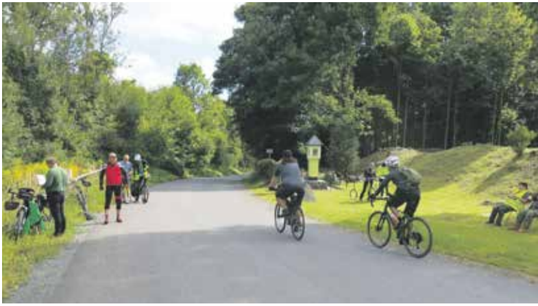
Akce Bílý kámen je určena nejen pro cyklisty, ale i pěší turisty.