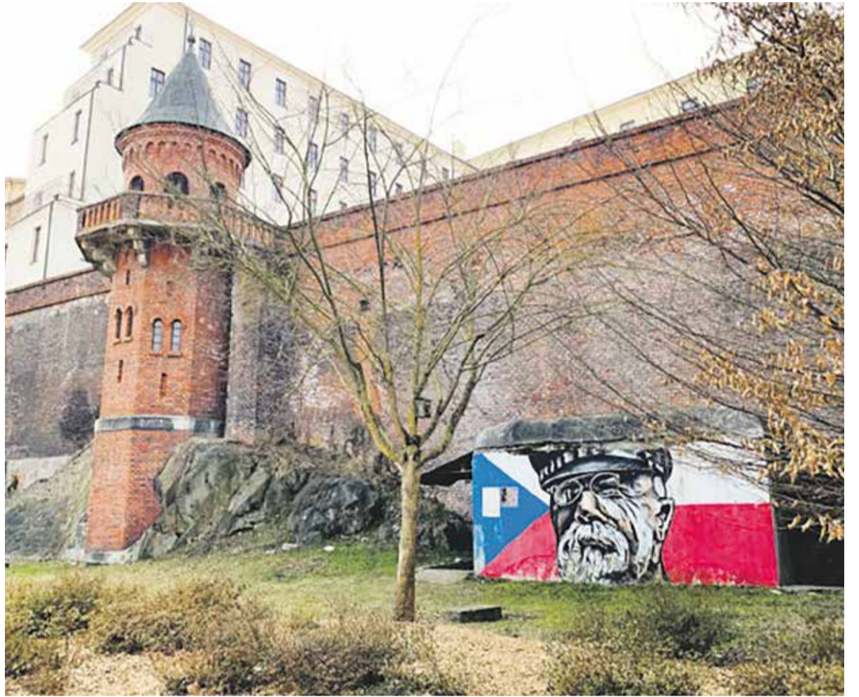
Bývalý kryt civilní obrany, který Institut Paměti národa využívá jako výstavní prostory, je v olomouckých Bezručových sadech.

V centrální části krytu je stále možné zhlédnout průřez toho nejzajímavějšího ze sbírky