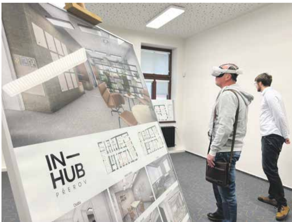
Přerovský IN-HUB bude inspirativním prostředím, kde lze pracovat a třeba i potkat nové partnery pro byznys.