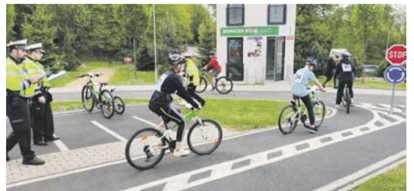
Krajské finále: Zábřeh 6. června

„Cílem soutěže je podněcovat a zvyšovat zájem žáků o dopravní výchovu, ověřovat znalosti a dovednosti žáků – cyklistů v uplatňování pravidel provozu