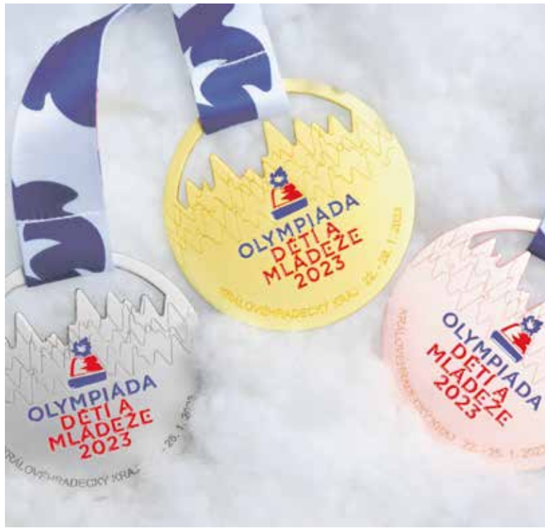
Nejlépejší sportovci získají originální medaile navržené pro dvacátý ročník dětské olympiády.

Slavnostní zahájení proběhne na zimním stadionu v Hradci