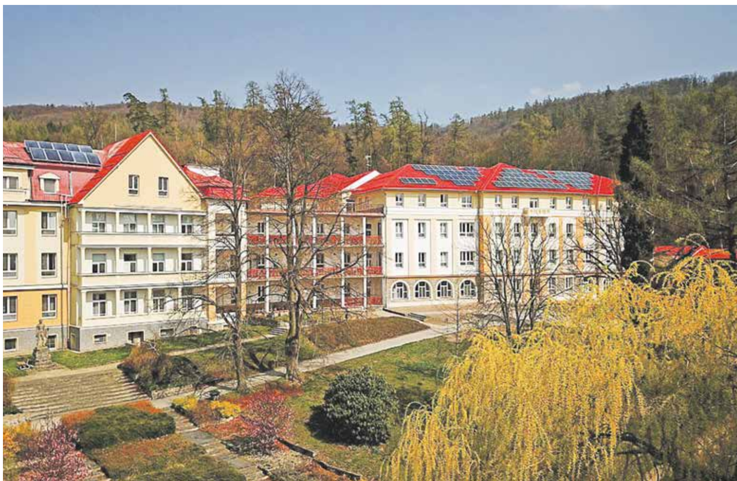
Léčebný ústav v Pasece už má na střechách solární panely. Kraj připravuje podobnou modernizaci i na dalších objektech.