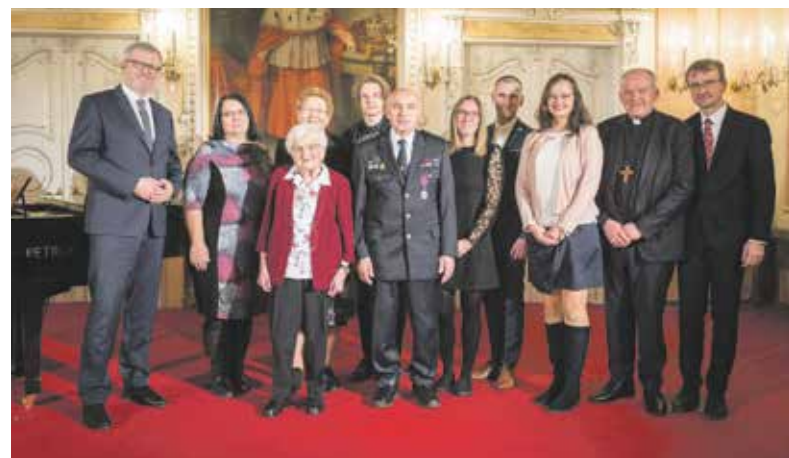
Ocenění si lidé převzali během slavnostního aktu v Arcibiskupském paláci v Olomouci.

Cenu za nezištnou a obětavou pomoc Křesadlo 2022 si v Olomouci převzalo osm výjimečných dobrovolníků. Cenu Křesadlo obdrželi ocenění v šesti kategoriích, jako například dobrovolní hasiči, spolková činnost, sociální práce, zdravotnictví, humanitární činnost nebo volnočasové aktivity dětí a mládeže.