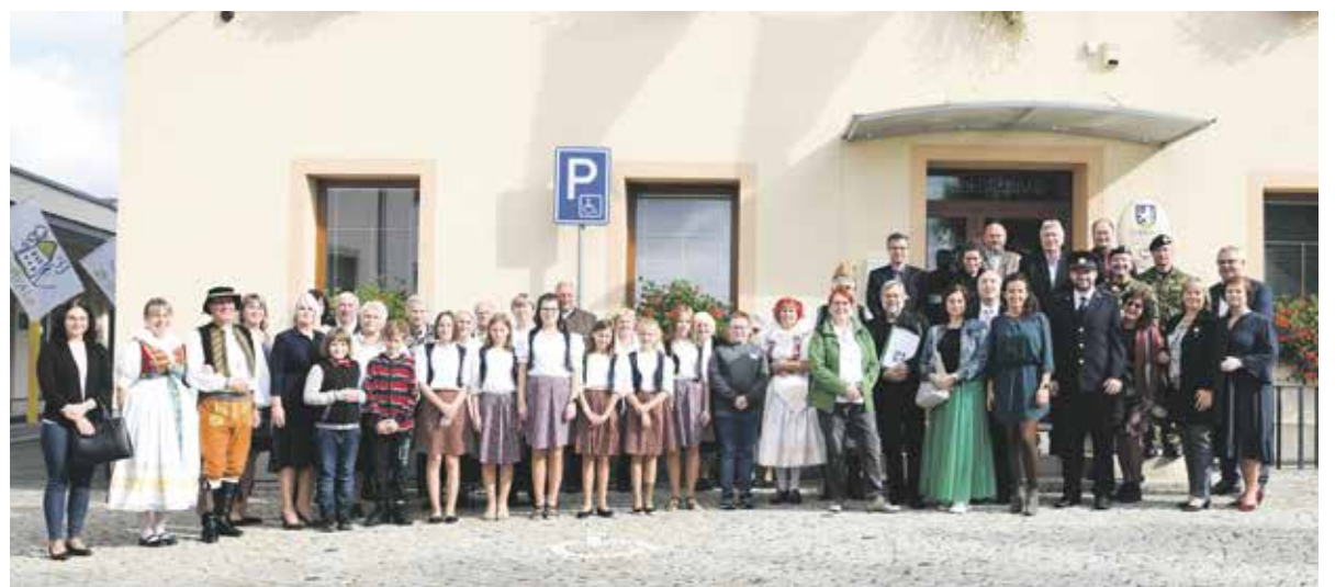
Zástupci obce Šumvald si ocenění v soutěži pojedou v květnu převzít do Německa.