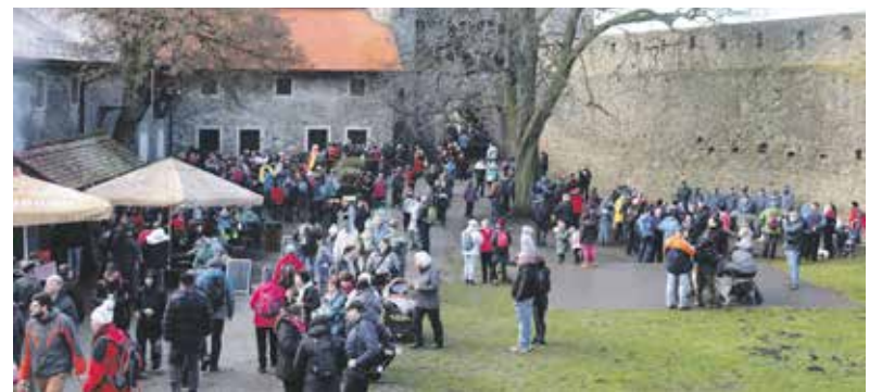
Hradní nádvoří v lednu mimořádně zaplnili návštěvníci - sezona na hradě začíná v dubnu.

Helfštýn je během zimy zavřený, otevírá se speciálně pouze první novoroční sobotu, kdy bylo vstupné stanovené na symbolických dvacet korun. V sezóně stojí lístky 150 a 80 korun, mimo sezonu 80 a 40 korun. V loňském roce zažil hrad rekordní návštěvníckou sezonu, kdy branami areálu prošlo více než 116 tisíc lidí a bylo to nejvíce od zpřístupnění památky před 50 lety. Jedním z hlavních lákadel hradu