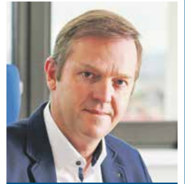
Miroslav Gajdůšek vedoucí Odboru školství a mládeže, Krajského úřadu Olomouckého kraje

Podzim je každoročně obdobím, kdy devátáci a jejich rodiče musí učinit klíčové životní rozhodnutí, na kterou střední školu podat přihlášku ke vzdělávání. Doporučuji proto pečlivě se seznámit s nabídkou středoškolských oborů, kdy výbornou pomůckou je Atlas školství 2022/2023, který každý deváták obdrží ve škole. Současně s tím je třeba zvážit zájmy, schopnosti a nadání žáků a rovněž přemýšlet nad uplatnitelností, na trhu práce. Dále bych rád zdůraznil zejména rodičům, aby věnovali velkou pozornost kritériím přijímacího řízení, která ředitelé středních škol zveřejňují do 31. ledna. Nezbytné je pak ve spolupráci se školou řádně odevzdat vyplněnou přihlášku, a to nejpozději do 30. listopadu 2022 pro obory vzdělání s talentovou zkouškou (přihláška s modrým podtiskem), do 1. března 2023 pro obory vzdělání bez talentové zkoušky (přihlášky s růžovým, zeleným a hnědým podtiskem). Samotné přijímací zkoušky pak proběhnou pro čtyřleté obory 13. a 14. dubna 2023 . Pro obory šestiletých a osmiletých gymnázií 17. a 18. dubna 2023 . Náhradní termíny přijímací zkoušky proběhnou 10. a 11. května 2023 . Na závěr mi nezbyvá než popřát všem tu správnou volbu.