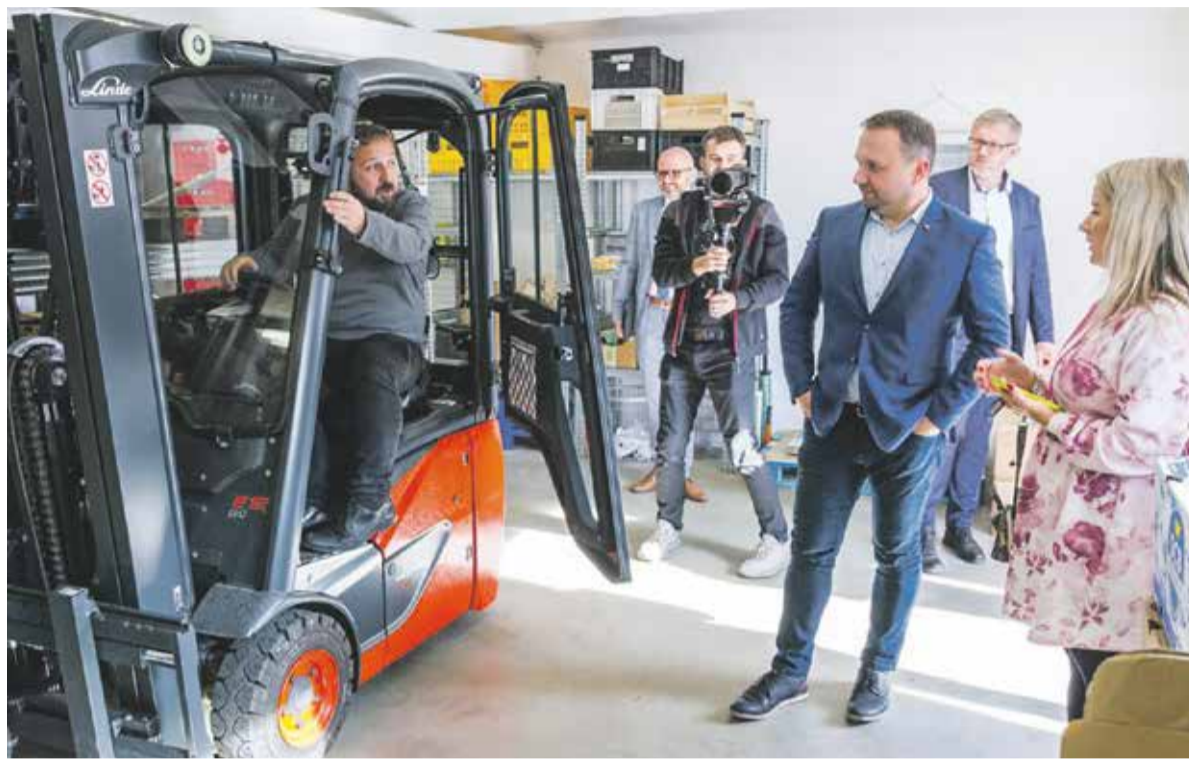
Ministr Marian Jurečka si prohlédl potravinovou banku a prostory Hanáckých kasáren, kde se chystá zázemí materiální a potravinové pomoci.

Během říjnové návštěvy Olomouckého kraje zavítal ministr práce a sociálních věcí Marian Jurečka nejen na jednání s krajskými radními, ale zamířil také do cvičné zubní ordinace olomouckého spolku Jdeme Autistům Naproti, do potravinové banky v Olomouci – Repčíně a Hanáckých kasáren v centru krajského města, které slouží jako Krajské asistenční centrum pomoci Ukrajincům. Prohlédl si organizaci Zet-My,