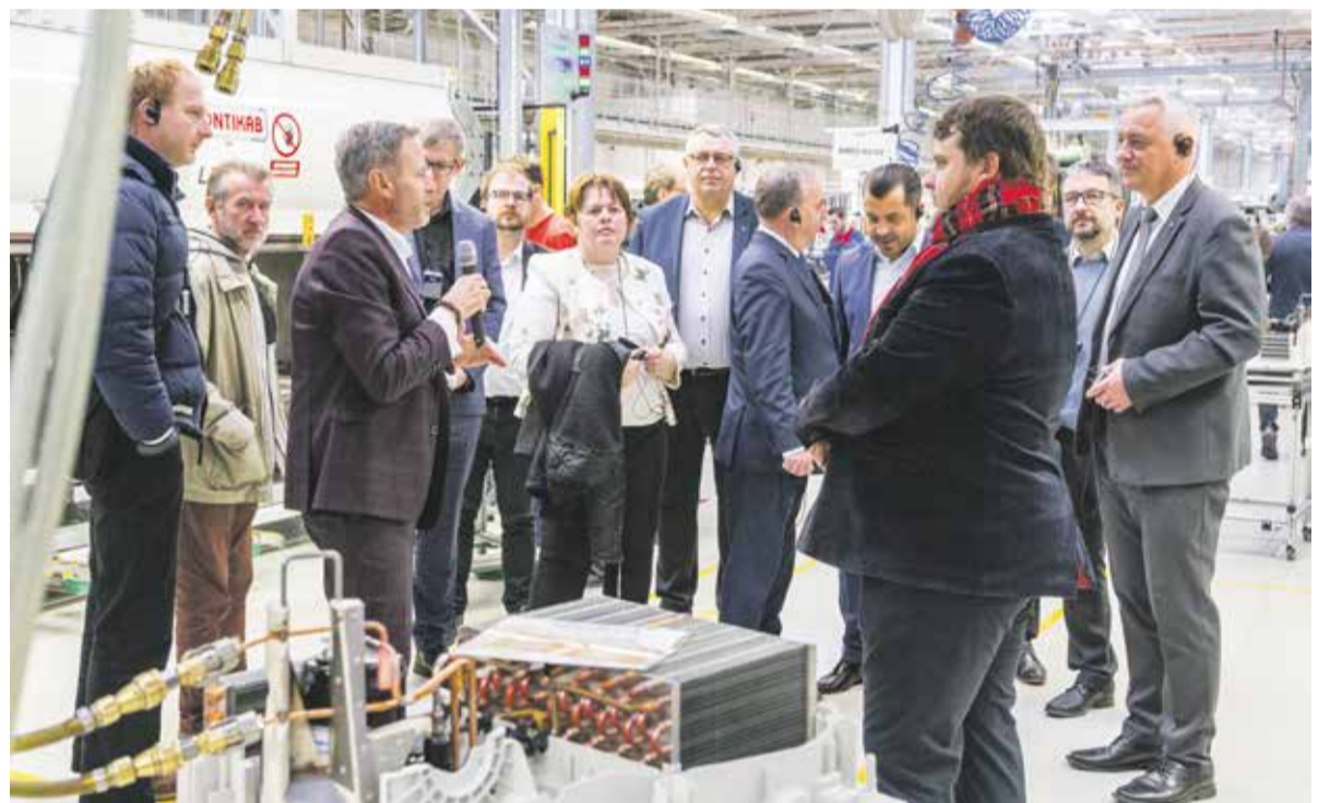
Radní si prohlédli výrobní závod Miele, kde se setkali s dalšími podnikateli z regionu.