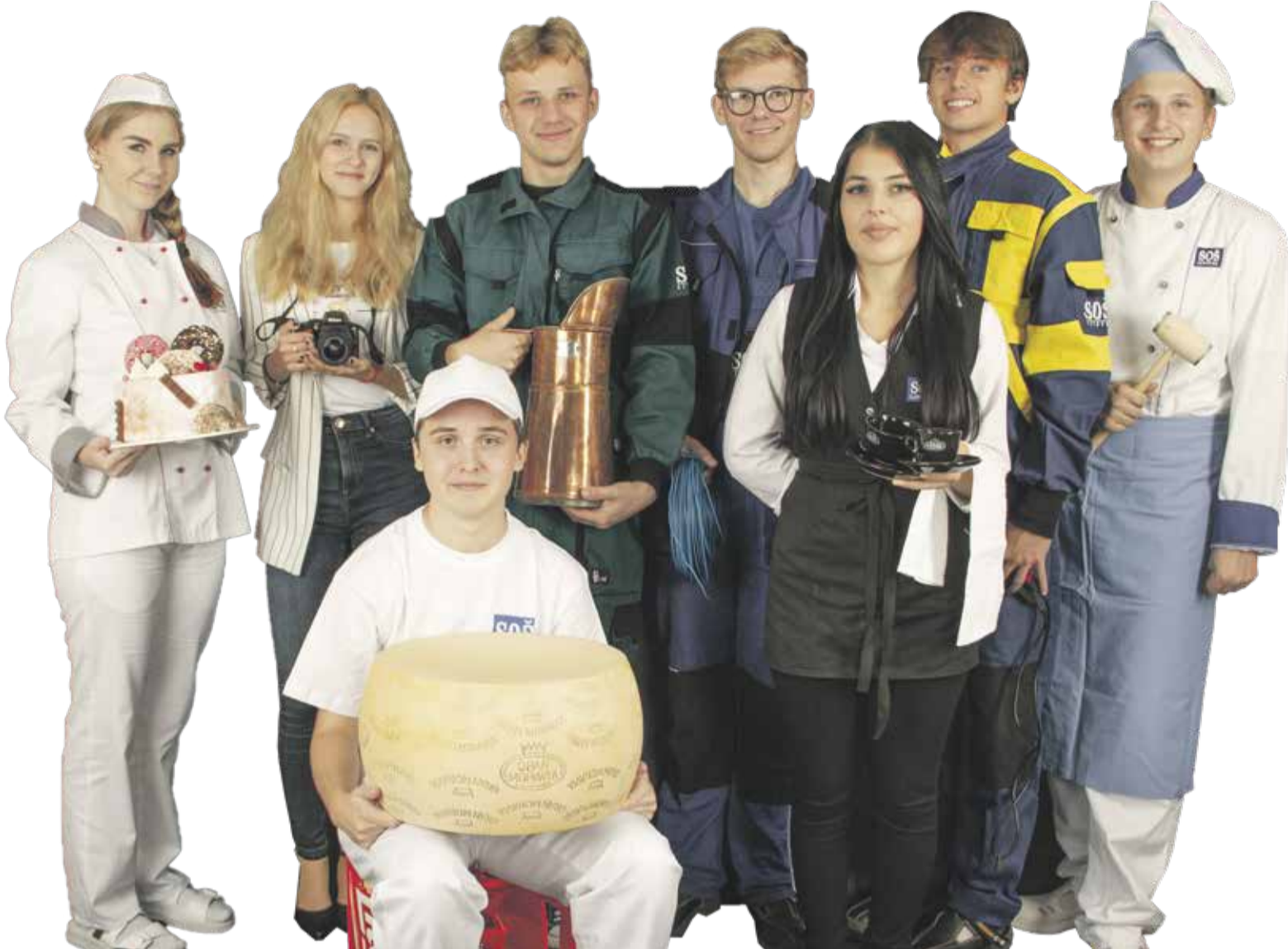
Střední odborná škola Litovel připravuje žáky v několika moderních a žádaných oborech.