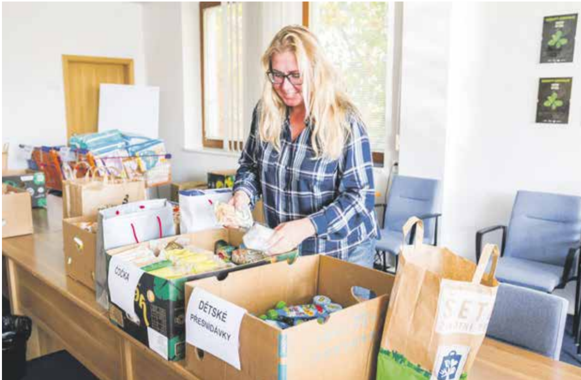
Sbírkou z krajského úřadu rozdělí Potravinová banka mezi čtyřicet charitativních organizací, které pomáhají lidem v regionu.