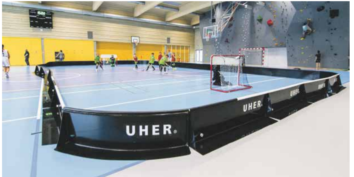
Z krajského rozpočtu půjde v příštím roce na podporu sportu více než 50 milionů korun.

Hejtmanství už schválilo a vyhlásilo pravidla dotačního programu na podporu sportovní činnosti na rok 2023. Žadatelé se do něj mohou přihlásit ještě v tomto roce. Počítá se přitom s částkou v řádech desítek