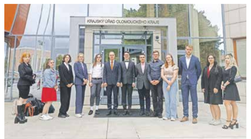
Členové Zastupitelstva mládeže Olomouckého kraje po letním jednání.

Cílem Zastupitelstva mládeže Olomouckého kraje je vytvořit prostor pro diskusi mezi mládeží z kraje a čelními představiteli krajské samosprávy, prezentování zájmů mládeže mimo jiné v oblasti vzdělávání, sportu či využití