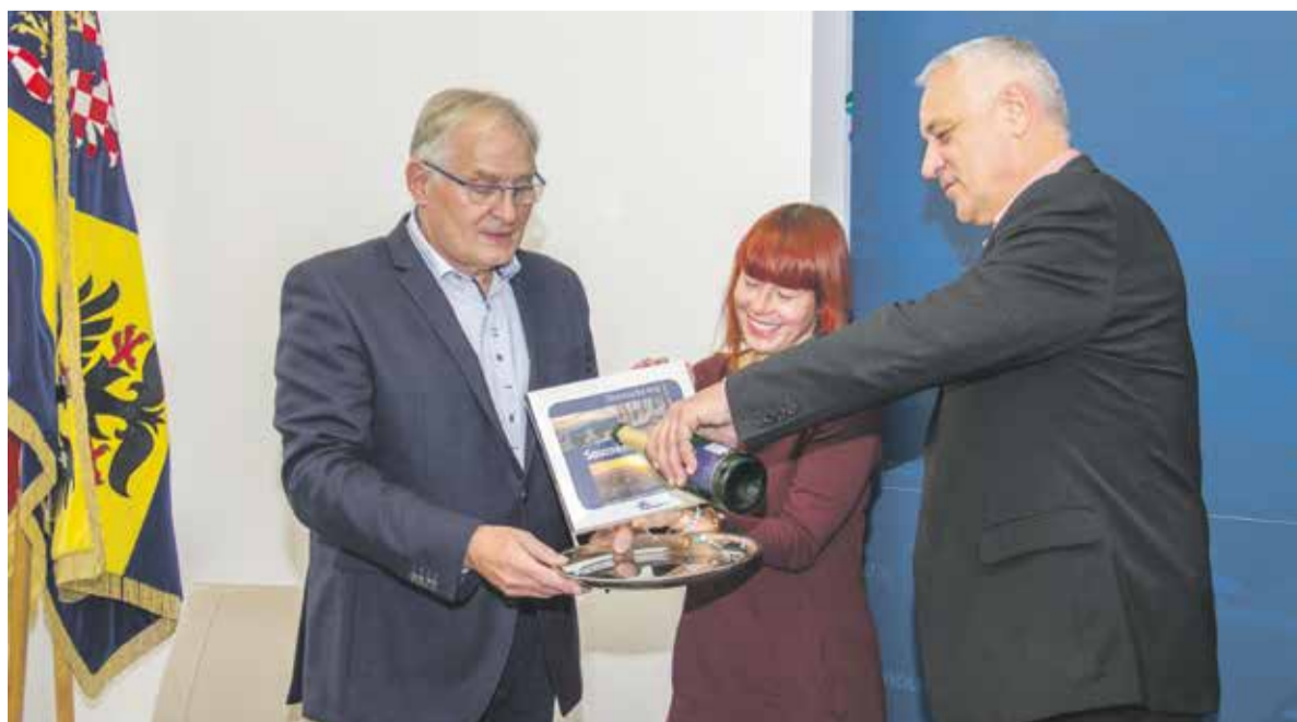
Nová publikace představující krásy našeho regionu nese název Souznění dvou tváří.