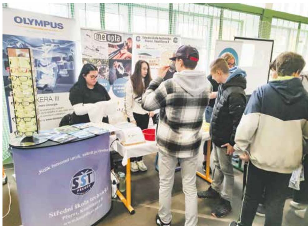
Při podpoře řemesel a rozvoji polytechnického vzdělávání spolupracují školy i se zaměstnavateli. Školy se navíc každoročně prezentují v rámci Burzy škol Scholaris.

Mladé lidi k řemeslu se ovšem kraj snaží přitáhnout také jinými způsoby – např. pomocí webu remeslojeok.cz , kde návštěvníkům pomůže vybrat střední školu chatbot Přemek. Další web olomouckeskoolstvi.cz pak přináší aktuální informace z oblasti školství v našem kraji a také prezentace všech středních škol.