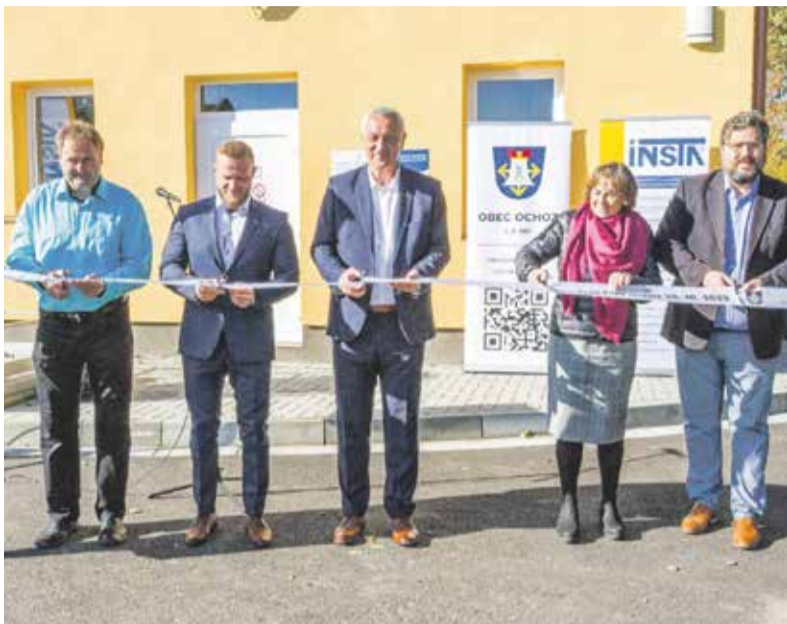
Novou čistírnou odpadních vod a kanalizací se mohou pochlubit v Ochozí na Prostějovsku. Kraj vložil do projektu téměř dva miliony korun. Slavnostně byla uvedena do provozu v polovině října.

Olomoucký kraj obcím znovu pomůže s úhradou nákladů na výstavbu a obnovu vodohospodářské infrastruktury. Ještě letos chce mezi žadatele rozdělit dalších téměř třináct milionů korun. Už na začátku léta přítom