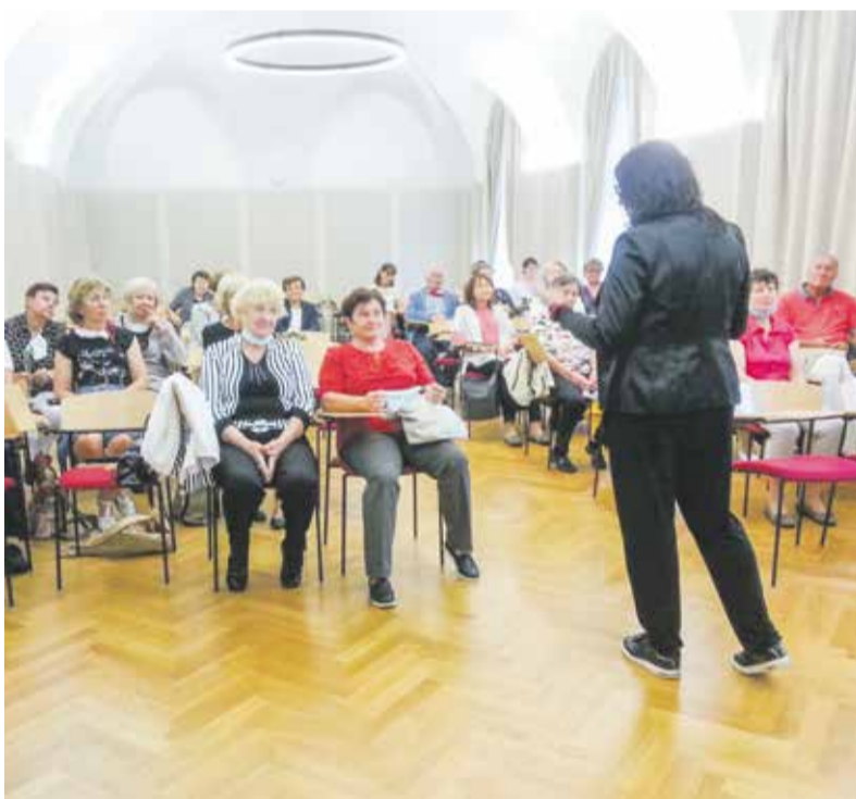
Univerzita třetího věku nabízí kromě studií několika oborů i setkávání stejně aktivních lidí důchodového věku.

Univerzita 3. věku při Univerzitě Palackého v Olomouci už přijímá přihlášky od studentů důchodového věku k účasti na U3V v akademickém roce 2022/2023, a to až do poloviny září. Zájemci o vzdělávání si mohou nově vybrat z dvouletých specializovaných běhů, ale i kratších, jednoletých nebo jednosemestrálních programů. „Nabízíme vzdělávání v nejrůznějších tématech od historie přes psychosociální studia až po medicínská a právní témata. Oblíbené jsou programy zaměřené na zdravý životní styl, lidovou kulturu, výtvarné umění a hudbu. V nabídce máme i přírodovědná témata, poznávání asijské kultury, první pomoc a prevenci kriminality, kurz digitální fotografie i kurzy zaměřené na pohybové aktivity a exkurze