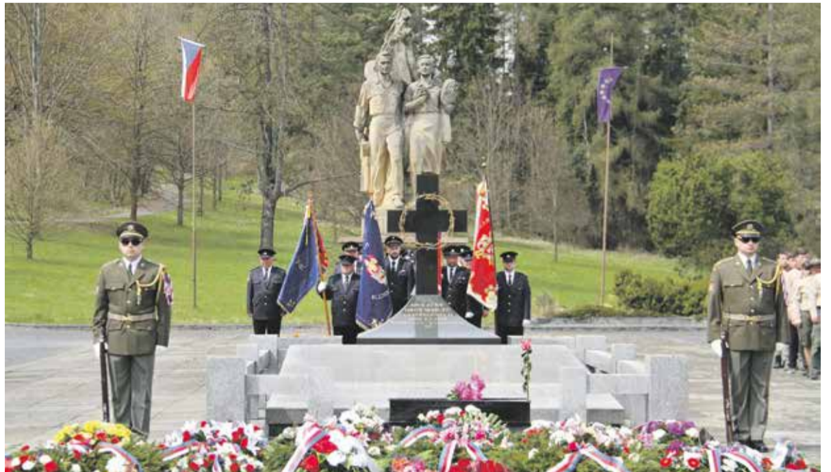
Památník v Javoříčku je společným hrobem 38 mužů, kteří zahynuli v posledních dnech II. světové války.

Přerovské povstání vypuklo 1. května 1945 jako úplné první v celé republice. Ten den se v ranních hodinách rozšířila mezi občany mylná zpráva, že německá armáda kapitulovala. Odpoledne však v ulicích začaly tvrdé boje a o den později