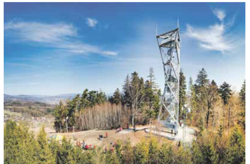
Stavba je z každé strany jiná a stojí ve výšce 603 metrů nad mořem. Dohlédnout lze na Hrubý i Nízký Jeseník, Praděd, Orlické hory, Dražanskou a Zábřežskou vrchovinu i údolí řeky Moravy.

Ocelová stavba je součástí naučné stezky Svěbohov Nebe, peklo, země, ráj a žluté