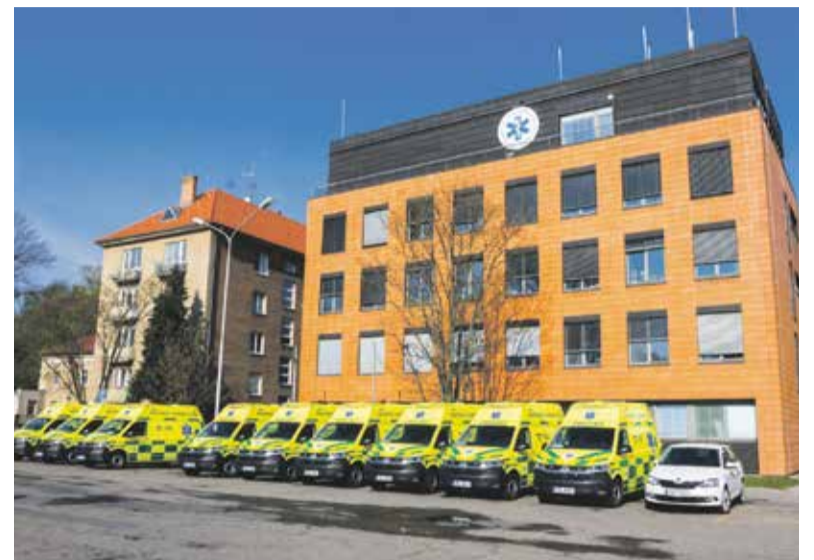
Nejmodernější sanitky už slouží na všech výjezdových základnách v kraji.