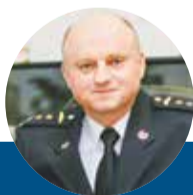
Karel Kolářik ředitel HZS Olomouckého kraje

Olomoucké Krajské asistenční centrum pomoci Ukrajině (KACPU) už mohlo zkrátit pracovní dobu, protože ustal obrovský nápor lidí prchajících před válkou na Ukrajině. Služby nabízí od pondělí do soboty od 8 do 16 hodin. Mimo tyto hodiny a v neděli se mohou uprchlíci v centru ubytovat, potřebné formality ale vyřídí ve stanovených časech. Uprchlíkům pomáhají policisté i hasiči. Ředitelům obou složek integrovaného záchranného systému jsme položili tři otázky.