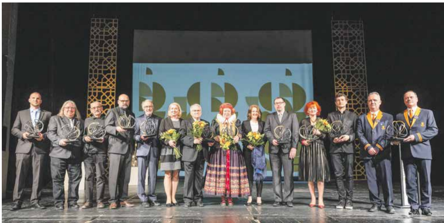
Ceny za přínos v oblasti kultury vyhlašuje Olomoucký kraj od roku 2006 a cílem je odměnit a zviditelnit ty nejlepší v našem regionu.