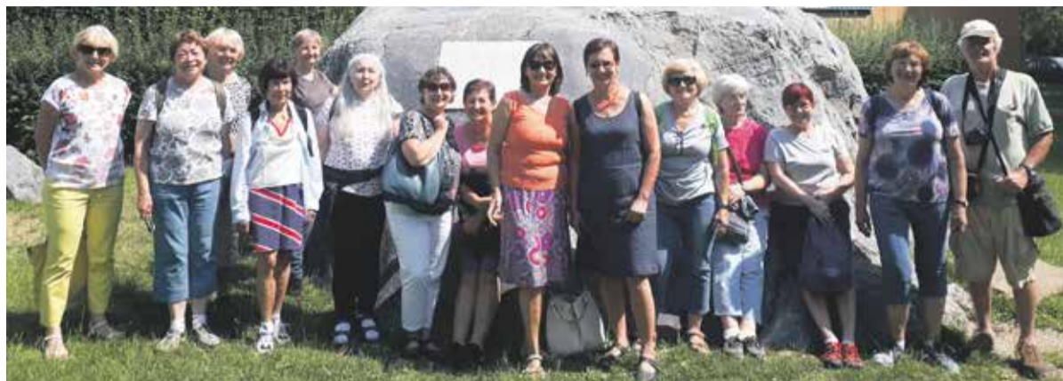
Univerzita třetího věku není jen o vzdělávání a přednáškách, ale i společných zájmech seniorů.

Senioři se mohou dále vzdělávat a potkávat na akademické půdě v rámci studia Univerzity 3. věku při Univerzitě Palackého v Olomouci. Přihlášky ke studiu pro osoby v důchodovém věku na školní rok 2021/2022 přijímá až do poloviny září. Zájemci o vzdělávání na U3V si mohou nově vybrat z dvouletých specializovaných běhů, ale i kratších, jednoletých nebo jednosemestrálních programů. „Nabízíme vzdělávání v nejrůznějších tématech