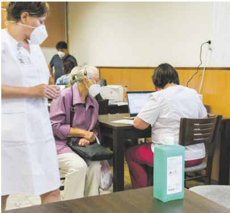
Mobilní očkovací tým Fakultní nemocnice Olomouc je připraven vyrazit podat vakcínu do celého kraje. Stačí, aby město projevilo zájem.