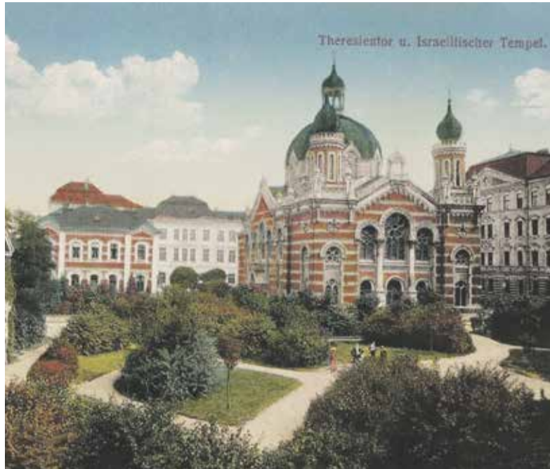
Pohlednice olomoucké synagogy.

Osud této stavby byl zpečetěn příkazem likvidací ohořelých