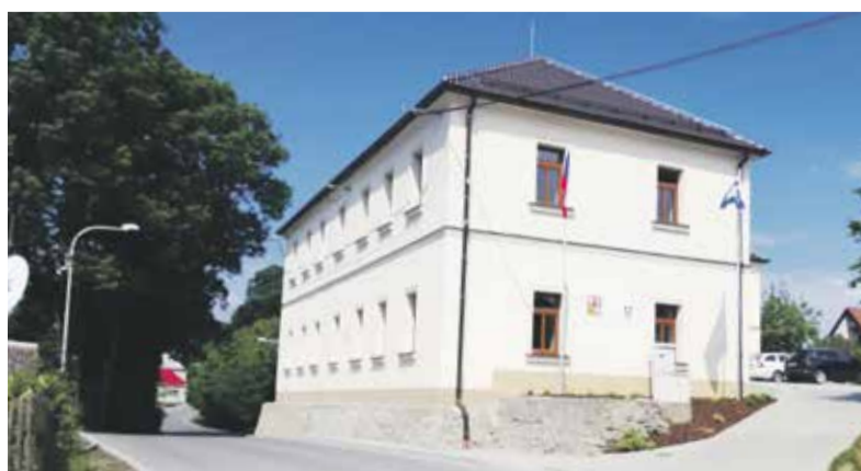
Zrekonstruovaný obecní úřad Kladky.

Rád bych pozval čtenáře do naší obce v létě za krásnou přírodou v přírodním parku Kladecko nebo v zimě na lyžovačku.