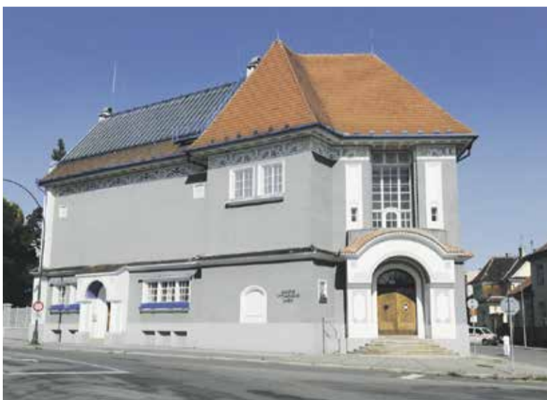
Galerie výtvarného umění v Hodoníně se zaměřuje na tvorbu regionálních umělců.

Více než dvě stě tisíc korun vynesla charitativní akce, kterou připravilo hejtmánství na podporu tornádem poničených památek v Jihomoravském kraji. Jde o peníze, jež lidé v průběhu posledního červencového víkendu zaplatili v muzeích, galeriích a památkách na území našeho regionu.