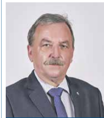
Dalibor Horák náměstek hejtmána Olomouckého kraje