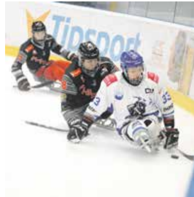
Olomoučtí parahokejisté bojovali s olympioniky i mistry světa.

Mezinárodní turnaj o pohár hejtmána Olomouckého kraje Olomouc Cup 2021 uspořádali už podruhé olomoučtí parahokejisté. Konal se v závěru srpna na zimním stadionu v Olomouci a na turnaji se utkaly parahokejové týmy Norska, Polska, Finska, Itálie a dvě družstva z České republiky – Havířov a domácí Olomouc. Některé týmy se na olomouckém ledu představily úplně poprvé v historii parahokeje v Olomouckém kraji. Většina hráčů zahraničních týmů reprezentují své země