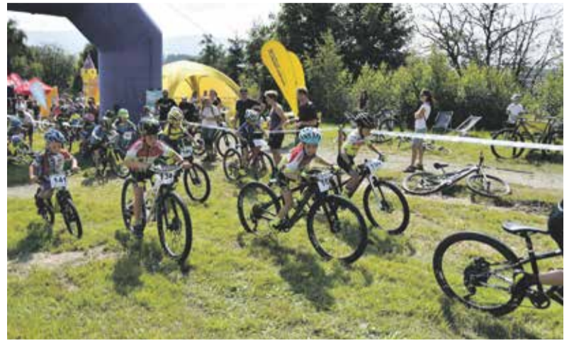
Na mistrovství Olomouckého kraje v horských kolech bojovali děti od tří let i borci v kategorii dospělých.

Dopolední závod patřil dětem, kdy se téměř pětadesát