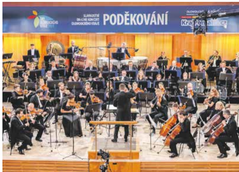
Slavnostní koncert Moravské filharmonie Olomouc je možné zhlédnout ze záznamu v pohodlí domova.