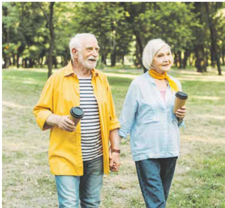
Uváděných deset tisíc kroků denně je jen orientační hodnota, důležitější je spíše pravidelný a příjemný pohyb.

Nápad vznikl během jarního lockdownu, kdy především