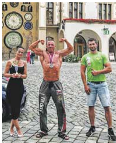
S medailí z Mistrovství Moravy a Slezska se kulturista pochlubil na olomouckém Horním náměstí.

Je to jeho už druhá letošní pohárová medaile. Jeho další závod bude Mistrovství ČR a pak IFFBB Austrian Wels bodybuilding a IFBB World Cup 2021, kde bude reprezentovat Město Olomouc, Olomoucký kraj a ČR.