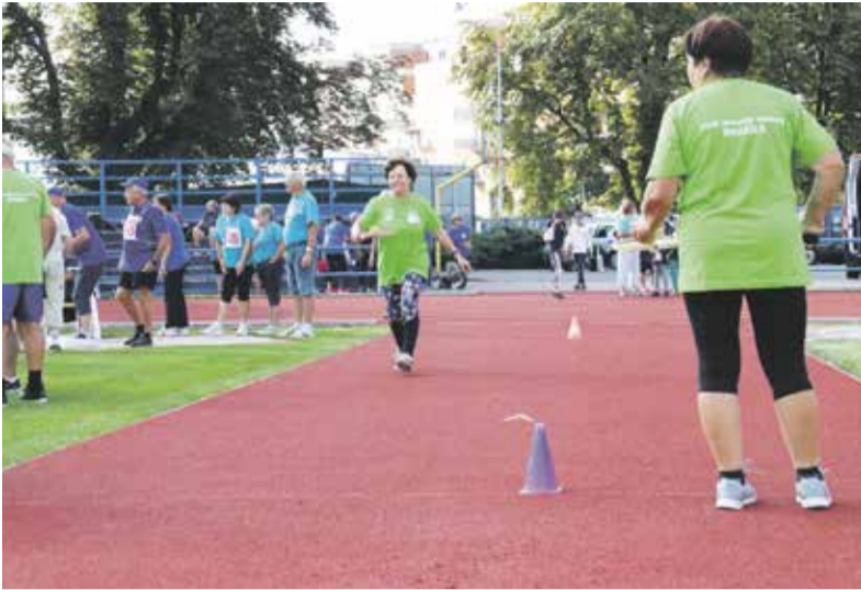
Sportovní hry seniorů se konaly v areálu TJ Lokomotiva Olomouc a letos se jich zúčastnily i družstva z Polska a Slovenska.

Zhruba dvě stovky sportovců a sportovkyň se v polovině srpna zúčastnily šestého ročníku sportovních her seniorů. Akci organizuje Krajská rada seniorů Olomouckého kraje a podporuje hejtmanství.