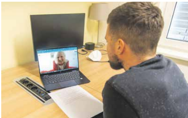
Telemedicína v současné době slouží například i při přímé komunikaci se seniory.

zřizovatele zdravotnického zařízení. Jsem velmi rád, že telemedicína je díky společným aktivitám dostupná nejen ve fakultní a vojenské nemocnici v Olomouci, ale např. i v kraje řízených zdravotnických zařízeních, nemocnicích skupiny AGEL, Šumperské nemocnici a řadě dalších.