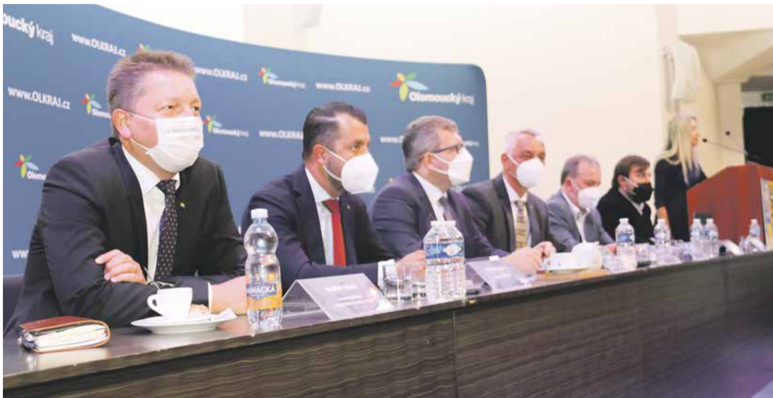
Na konferenci samospráv se mohou starostové z celého kraje osobně potkat s vedením hejtmantví a probrat to, co je v jejich obci trápí.