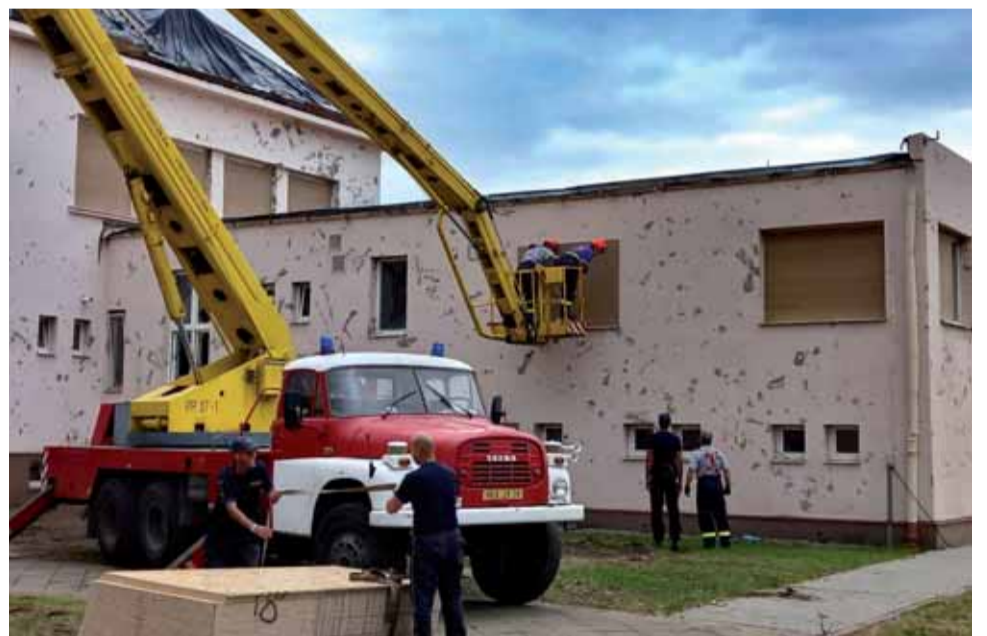
V poničených obcích zasahovali také hasiči z Olomouckého kraje.