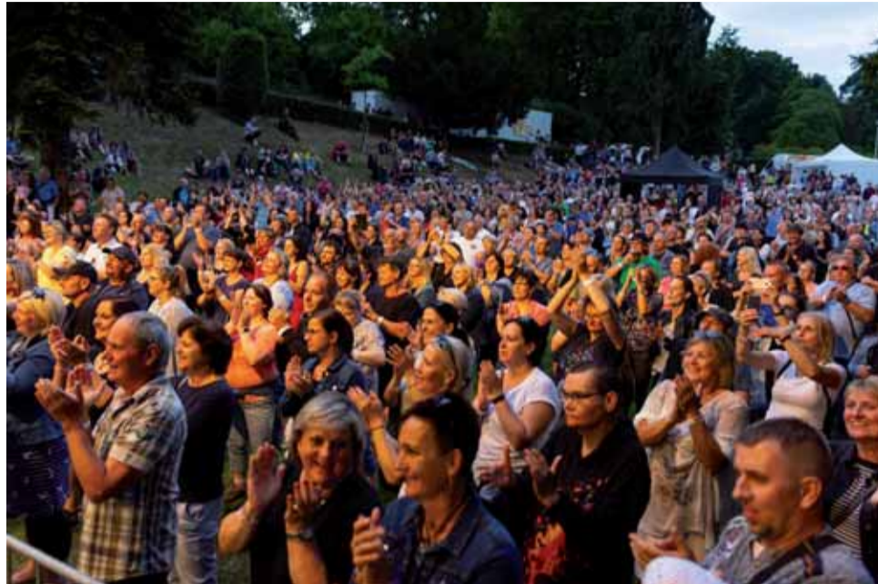
Návštěvníci šternberského kulturního léta se mohou těšit na skvělou atmosféru.

Čechomor už sice opozdilci nestihnou, těšit se ale mohou i na další atraktivní hosty festivalu. Ten totiž bude probíhat až do konce letních prázdnin. Devízou hudební akce ve Šternberku jsou historické exteriéry koncertů a neopakovatelná atmosféra. (red)