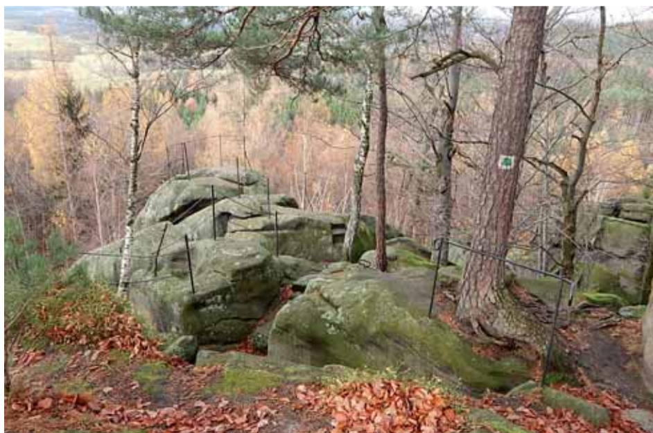
FOTO: Venušiny misky jsou romantické v létě i na podzim.

Moc ráda mám Venušiny misky. Přátele bych pozvala na dovolenou do Vidnavy, je tady krásně.