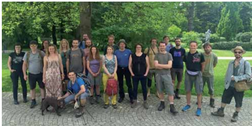
Účastníci projektu, jehož cílem je připravit v Jeseníkách alternativu ke zvažované přehradě.