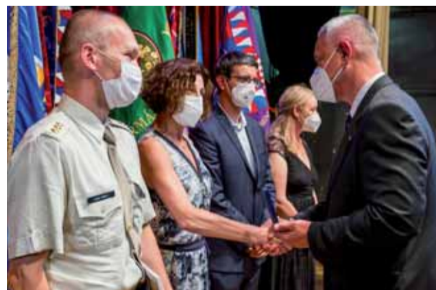
Ocenění za práci během epidemie covid-19 si převzali policisté, hasiči i zdravotničtí pracovníci.

„Jsem velmi rád, že Olomoucký kraj má profesionály, na které se v případě nouze může spolehnout. Poděkování za zvládnutí poslední vlny epidemie covidu-19 však patří všem lidem, kteří třeba jen do- držovali nařízená proti-