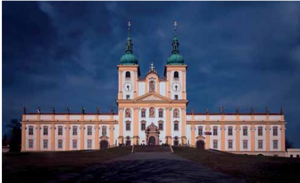
Nově certifikovaná Cyrlometodějská stezka provede turisty po historických místech. Na snímku Svatý Kopeček u Olomouce.

Značená Cyrlometodějská stezka využívá trasy Klubu českých turistů a čítá dohromady asi 750 kilometrů. Podrobné informace najdou zájemci na webu www.putujme-bezhranic.cz . (red)