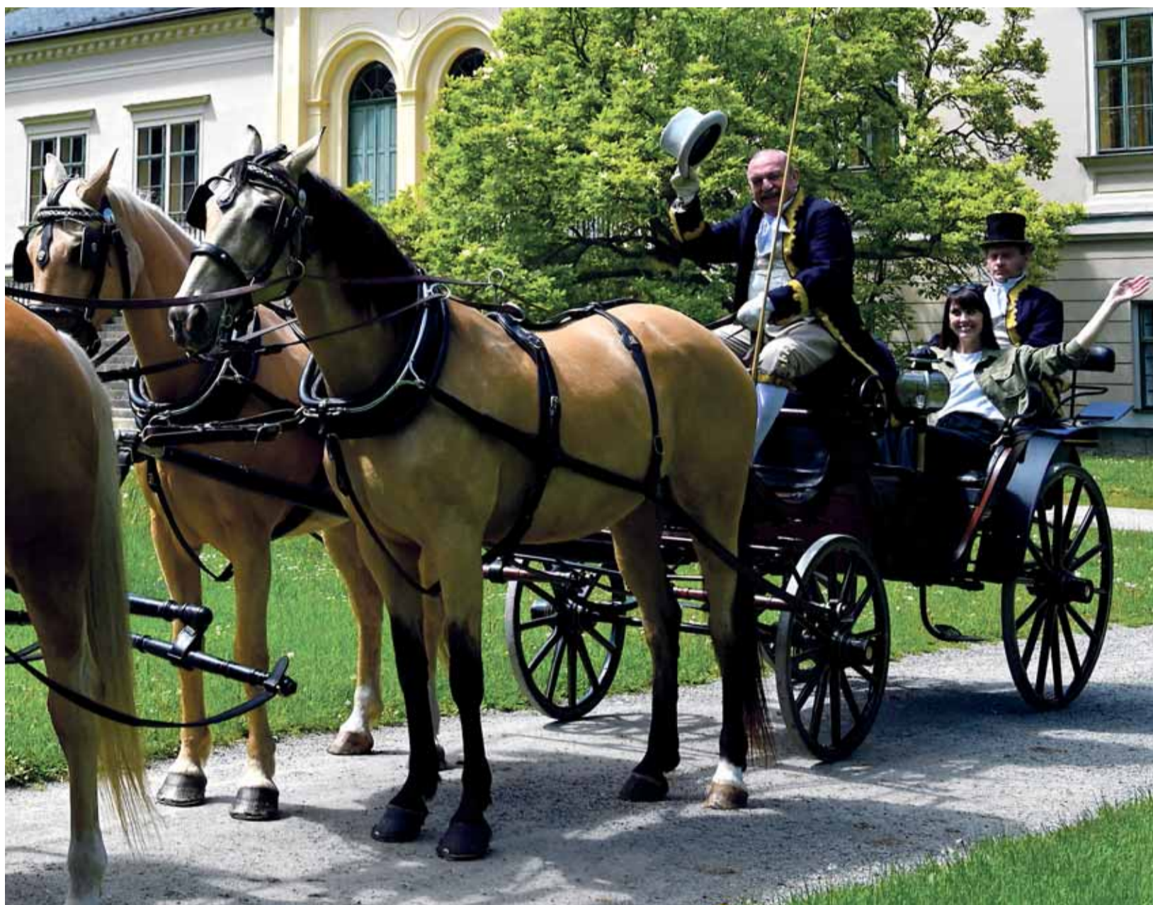
Olomoucký kraj nejsou jen Jeseníky, ale i Haná. Právě tam můžete prožít neopakovatelné zážitky – třeba projížďku v historickém kočáře.