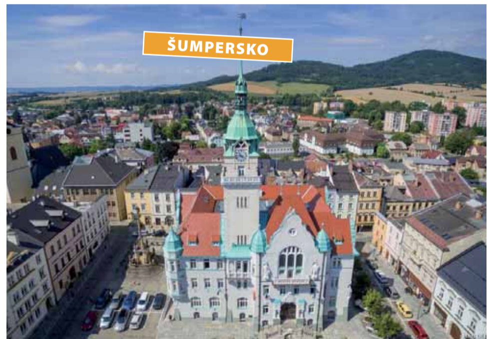
Šumperská radnice je ideálním vyhlídkovým místem.

O noční rozhledy je v Šumperku velký zájem, užívají si je místní i turisté. Na vrcholu věže je k dispozici dalekohled, kterým lidé přehlednou velkou část Jeseníků i jejich podhůří. Silná optika je také ideál-