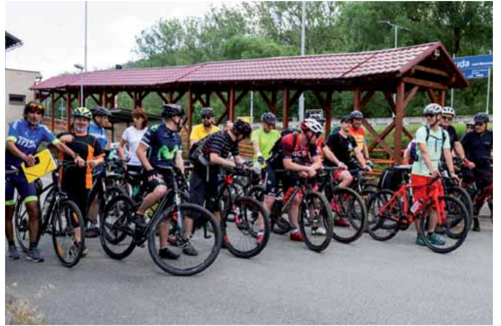
Cyklostezky v Olomouckém kraji byly tématem společného jednání. Některé trasy by do budoucna mohly ležet například na komunikacích, které spravují Lesy ČR.

O budoucnosti cyklistické dopravy jednali účastníci setkání v době od 24. do 25. června. Nad legislativními, technickými, ale i koordinačními otázkami debatovali nejprve v Šumperku, na bicyklech si pak projeli budoucí trasování klíčové Moravské cyklostezky.