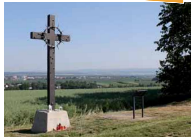
Kříž, který připomíná tragické události, k nimž na Švédských šancích došlo těsně po druhé světové válce.

Hrůzné události připomíná na vrcholu kopce kovaný kříž. Poválečný masakr na Švédských šancích, při kterých bylo zavražděno 267 nevinných lidí, byl dlouhá léta tabuizovaný. Krvavé mstě na německém obyvatelstvu se více pozornosti dostalo až v poslední době. Zmínovaný kříž na místě stojí od roku 2015. (red)