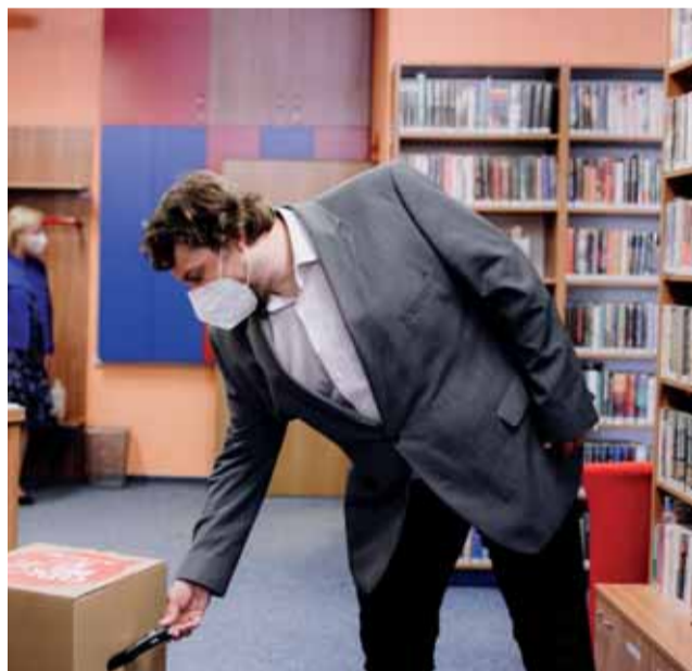
Olomoucký kraj podpořil projekt recyklace mobilů. Sběrná místa naleznou lidé především v knihovnách.

V říjnu proběhne vyhodnocení a předání ocenění. Průběžně aktualizovaný seznam zapojených knihoven, včetně podrobnějších informací a pravidel, naleznou zájemci na webové stránce www.odloz mobil.cz . (red)