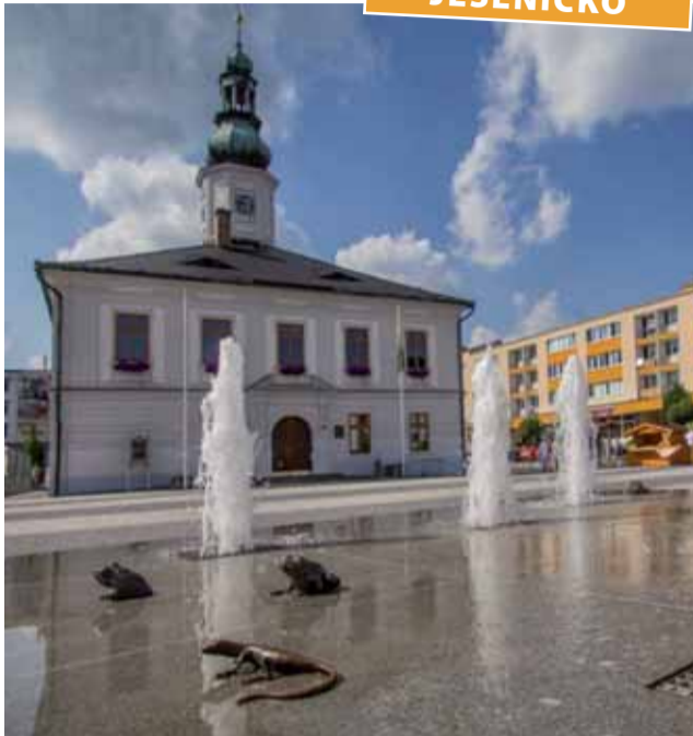
Jesenická radnice přijala desítky návrhů, které radí, jakým způsobem má město veřejné peníze investovat.

Osudu jednoho miliónu korun rozhodovali obyvatelé Jeseníku. Takzvaný participativní rozpočet lidem umožňuje navrhnout projekty, kam by měly být veřejné prostředky směřovány. Jeseníčtí poslali téměř čtyřicet návrhů.