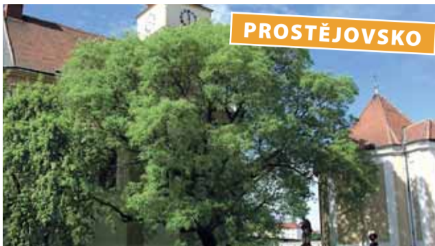
Prostějovský jerlín se pyšní hustou korunou. Uspěje v anketě Strom roku?

Jerlín japonský, strom z Petrského náměstí v Prostějově, bude bojovat o titul Strom roku 2021. V prestižní anketě si poměří síly s dalšími zelenými velikány celého Česka.