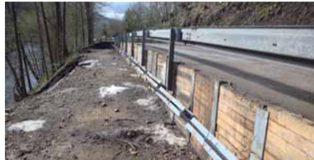
Silnice u Hanušovic je zatím opravena provizorně. Na přípravě kompletní rekonstrukce vozovky Správa silnic pracuje.

Olomoucký kraj zároveň připravuje kompletní opravu vozovky. Ta bude technologicky mimořádně náročná – počítá totiž