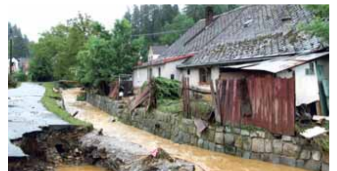
Se životním prostředím souvisí sucha i povodně. I do těchto oblastí míří krajská podpora.

D otace na zavčelební krajiny, obnovu lesů nebo lepší nakládání s vodou – tímto způsobem a ještě několika dalšími podporuje Olomoucký kraj životní prostředí v regionu. Další peníze poslouží například na provoz záchranných stanic zvířat.