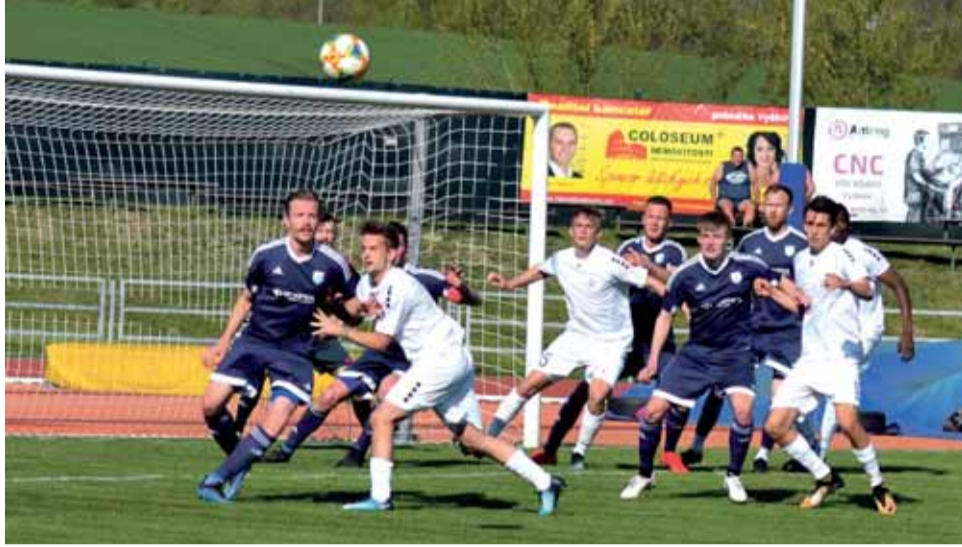
Třetiligoví fotbalisté Uničova (v tmavě modrém) na ilustračním snímku.