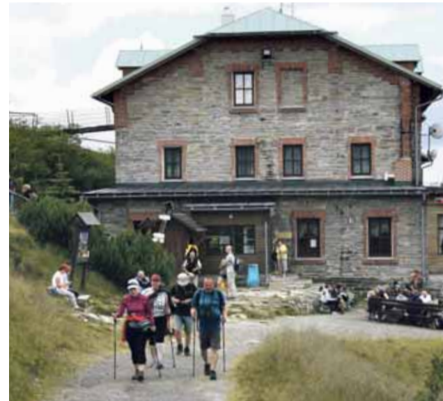
V Olomouckém kraji vedou téměř čtyři tisíce kilometrů turistických tras.

Klub českých turistů použije dotaci nejen na obnovu značení, provede také revizi a průzkum nových, neprůchodných