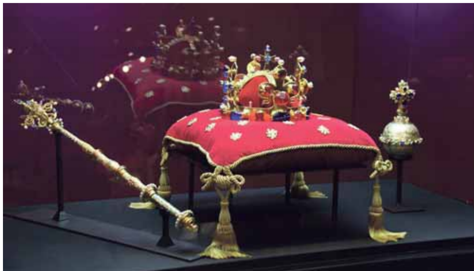
V olomouckém vlastivědném muzeu je stále k vidění výstava korunovačních klenotů.

Například prostějovské muzeum může nabídnout nově instalovanou autorstvou výstavu nazvanou Flóra a fauna z našich depozitářů. „Jde o téma, které je v našich sbírkách v různých podobách hojně zastoupené, a na výstavě jsou předměty, které nesou rostlinné nebo živočišné motivy. Protože některé exponáty jsou zcela nové nebo jsme ještě neměli příležitost je vystavit a byla by škoda se o ně nepodělit, rozhodli jsme se je zpřístupnit touto formou,“ prozradil Václav Horák, ředitel muzea.