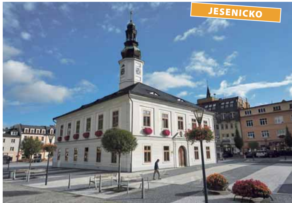
Nové byty v Jeseníku chce radnice přidělovat místním lidem.

Radnice se tak chce vyhnout tomu, aby se nové byty staly předmětem spekulací, což by mohlo výrazně zvednout jejich ceny. Právě předražené nemovitosti mladým lidem brání v pořízení vlastního bydlení.