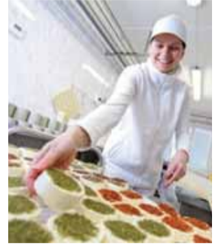
Držiteli značky regionální produkt jsou většinou menší producenti.

Nové držitele značek schválila certifikační komi-