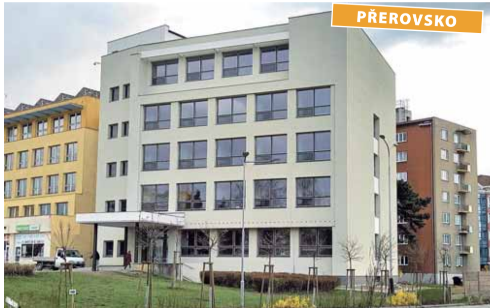
Škola pojme zhruba 120 studentů. Do školních lavic usednou i „dálkaři“.

Myšlenka založit v Přerově novou „zdravku“ vznikla před třemi lety u vedení společnosti AGEL, která je zřizovatelem školy. „Impulzem byl dlouhodobý nedostatek středního