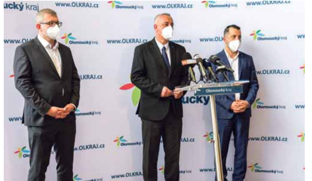
Hejtmánství oznámilo, že zadá hloubkový audit Správy silnic Olomouckého kraje. Chce tak prošetřit podezření na možné korupční jednání, na které upozornila média.

„Informace, které se objevily v médiích, vůbec ne-