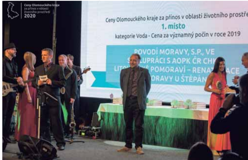
Do udílení cen životního prostředí se letos formou hlasování zapojí i veřejnost. Ta také může zasílat nominace.

Vloni v anketě uspěly například Arcibiskupské lesy Olomouc, Správa CHKO Litovelské Pomoraví nebo zemědělské družstvo z Hanovic. Podrobnosti k anketě i aktuality z její přípravy najdou zájemci na webu CenyKraje.cz. (red)