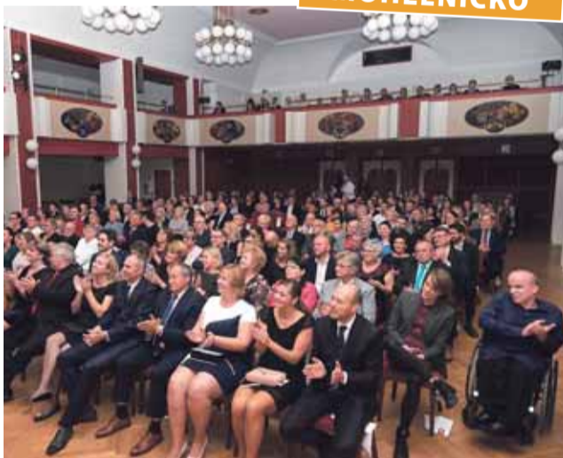
V minulosti bylo udělování Stříbrných jehlanů velkou společenskou událostí. Letos bude záležet na dalším vývoji epidemiologické situace.

Mohelnice letos opět vyhláší anketu Stříbrný jehlan. Jde v ní o to ocenit významné osobnosti nebo spolky, které působí ve městě. Nominace přijímá radnice do konce června, jména vítězů město oznámí na podzim.