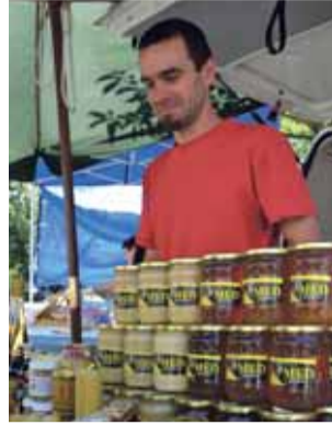
Farmářské trhy nabízí čerstvé potraviny vyrobené přímo v našem regionu.

„Regionální značky jsou známkou kvality, a o tu by mělo jít především. Navíc,