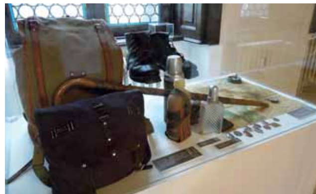
Žádné nepromokavé membrány, mobil s GPS ani teleskopické hole. Výstava prvních turistů v Jeseníkách vypadala úplně jinak než dnes.

Výstava je pořádána ve spolupráci s Vědeckou