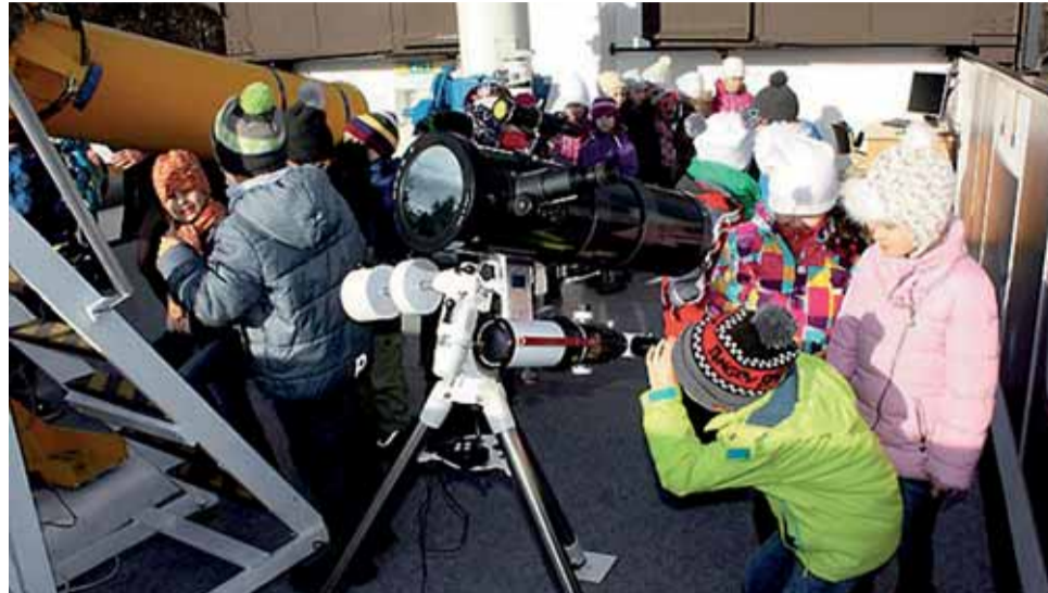
O pozorování dalekých světů je velký zájem i mezi dětmi.

V roce 2012 se z rozhodnutí zřizovatele, Olomouckého kraje, stala hvězdárna součástí Muzea a galerie v Prostějově.