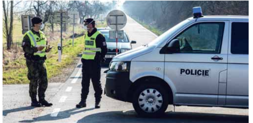
Obyvatelé Uničovska a Litovelska byli první v Česku, na které právě před rokem dolehl tvrdý lockdown.

V současné době je kraj dostatečně zásoben ochrannými pomůckami, které v případě potřeby distribuuje do sociálních zařízení,