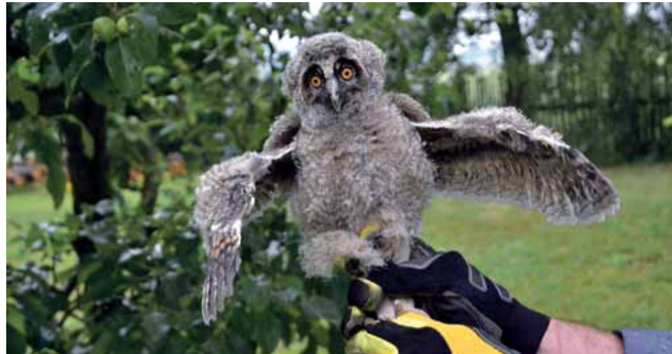
Kalous ušatý, jeden z častých hostů záchranných stanic. Mladým sovám způsobuje problémy vítr, který je shazuje z hnízd.

Provoz záchranných stanic pro zvířata v Olomouckém kraji většinou