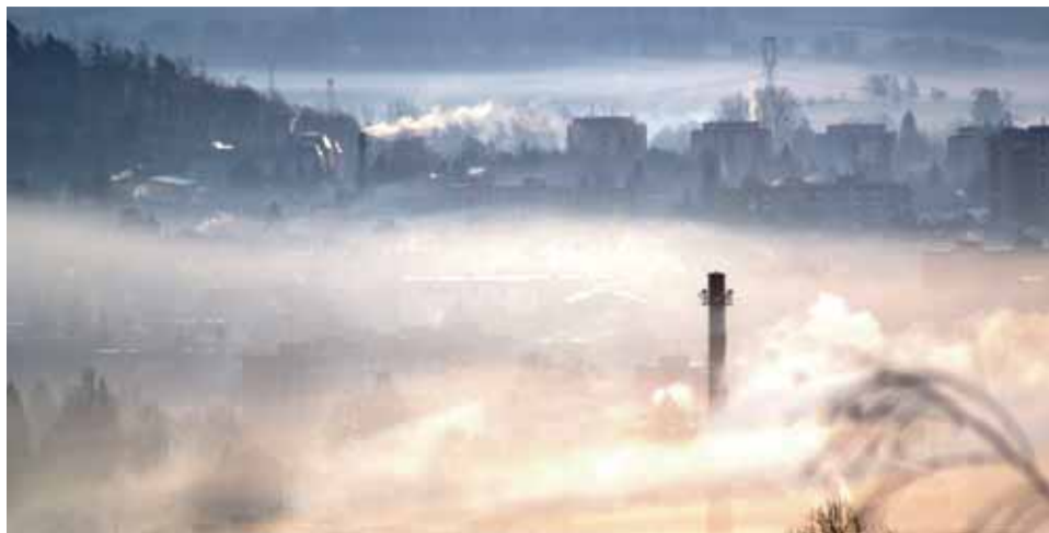
Smog trápí region hlavně v době inverze. Kotlíkové dotace pomohou životnímu prostředí i místním firmám.

„Nově bychom mohli podpořit dalších přibližně 150 zájemců. Tuto dotační výzvu plánujeme vyhlásit ještě v průběhu prvního pololetí letošního roku. Od vyhlášení výzvy budou mít ža-