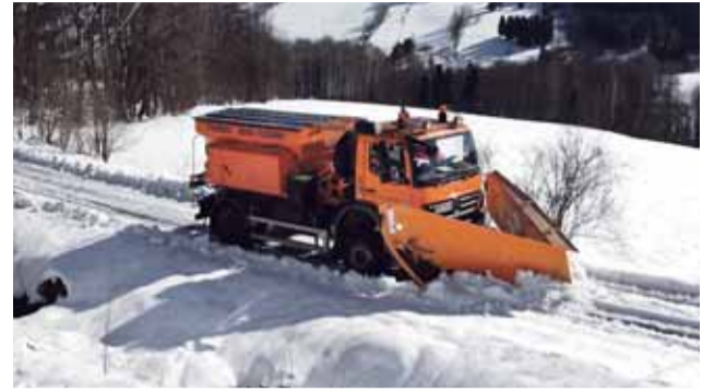
Zima dala letos silnicím na trak. Opravy poškozených úseků už se ale rozeběhly.

Správa silnic Olomouckého kraje se stará o více než tři tisíce kilometrů vozovky. Zimní údržbu komunikací prvních tříd včetně exponované cesty