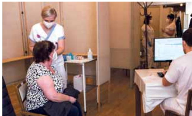
Očkovací centrum v Prostějově je lidem dostupné v Komenského ulici.

„Průběh očkování a objem dodávek vakcíny v dalších dnech a týdnech ukáží, jestli a jak bude třeba kapacitu stávajících očkovacích míst v nemocnicích v rámci Olomouckého kraje dále navyšovat. Pokud by v blízké budoucnosti byl skutečně dostatek vakcí-