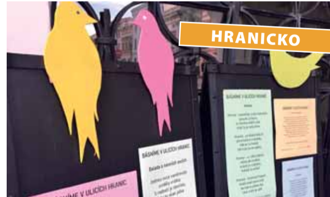
V ulicích Hranic je k potěše ducha připravena více než stovka básniček.

„Jsme moc rádi, že v Hranicích se zapojila spousta lidí se svými