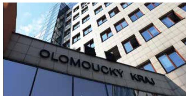
OK linka usnadní získávání Evropských dotací, které jsou pro rozvoj regionu zásadní.

OK linka funguje jako kontaktní poradenské centrum. Na www.oklinka.eu informuje o aktuálních výzvách z více než