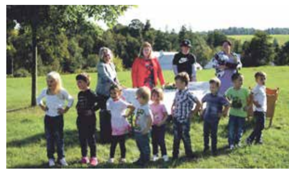
Vítání občánků proběhlo pod širým nebem.

Město Libavá je obec ležící v oblasti Oderských vrchů. První zmínka o této obci se datuje už v roce 1301. V roce 1946 se stala součástí vojenského prostoru Libavá, a tak tomu bylo až do roku 2016. Dne 1. ledna 2016 bylo Město Libavá vyčleněno z území vojenského prostoru a stalo se tak opět samostatnou obcí. K Městu Libavá patří také místní část Herotlovice.