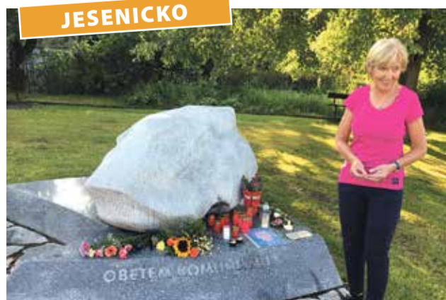
Památník obětem komunismu vznikl v Jeseníku ze soukromé iniciativy.