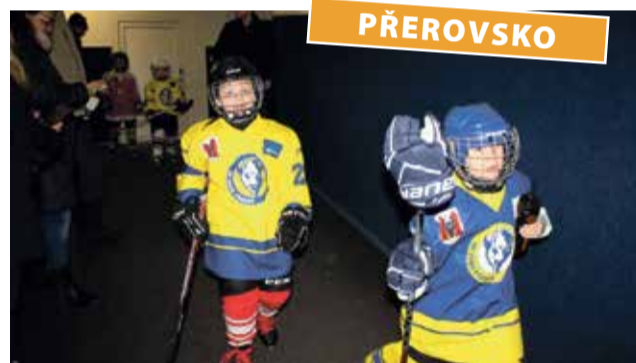
Rekonstruovaný zimní stadion budou moci využívat i mladí hokejisté.

„Například v prvním podlaží se původní sauna promění v místnost, kterou bude využívat hokejový klub. O patro výš má být zázemí pro trenéry, jehož