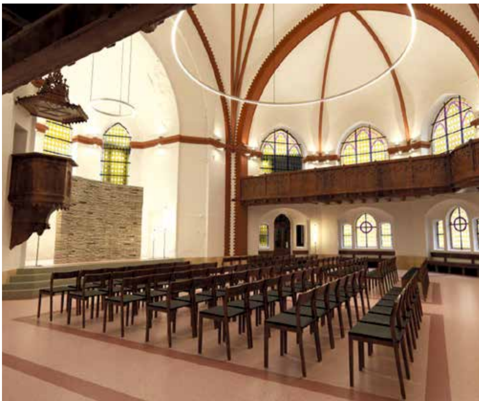
Obnova chóru rozšíří kapacitu Červeného kostela. Stavba právě prochází rekonstrukcí, která skončí příští rok. Takto by měla vypadat.

Zatímco původně měla kapacita kostela činit 271 osob, díky zachování