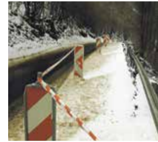
Sesuv půdy uzavřel cestu u Hanušovic. Kraj připravuje její co nejrychlejší opravu.

Kritické místo ohraničuje zákazová značka. Objíždkou provede řidiče přehledné dopravní značení. (red)