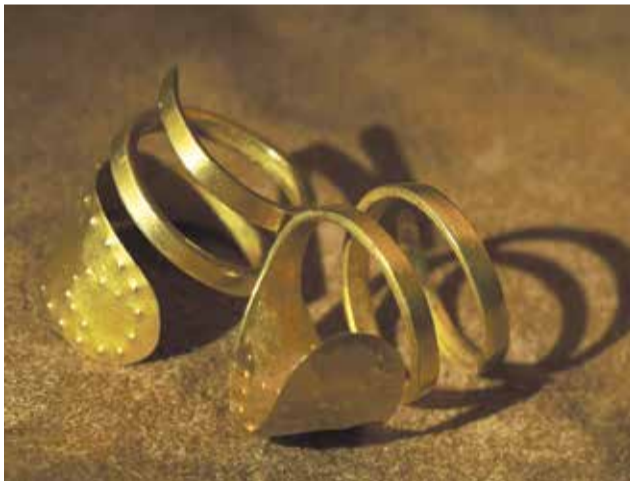
Na Facebooku muzea si lidé mohou prohlédnout část jeho expozice - třeba zlaté náušnice z druhé poloviny třetího tisíciletí před naším letopočtem.

Kurátoři se tak sice stále s láskou a pečlivostí starají o své sbírky, třídí je a rozšiřují, zkoumají a odhalují o nich nové informace. Problém je v tom, že v době uzávěry muzea a zrušení řady veřejných akcí ubylo možností, jak výsledky svého snažení prezentovat. K čemu je výstava, kterou nikdo neuvidí? Časem i ten největší muzejní introvert začne cítit psychické nepohodlí, když ztratí možnost svou práci někomu předat nebo ji představit veřejnosti. Proto i ti nejzarytější odpůrci sociálních sítí začali aktivně přemýšlet nad tím,