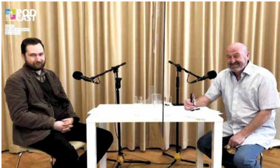
Podcasty najdou posluchači na internetových stránkách a Facebooku jeseníckého muzea.

„Už v průběhu jarní vlny se na nás obrátila ředitelka městských kulturních zařízení a vyzvala nás ke spolupráci,“ uvedl ředitel Vlastivědného muzea Jesenicka Pavel Rušar. Muzeum okamžitě souhlasilo, a tak vzniklo první povídání nazvané Pět jeseníckých pověstí, které mělo u posluchačů nad očekávání velký úspěch a ohlas. „Forma podcastu nám přišla