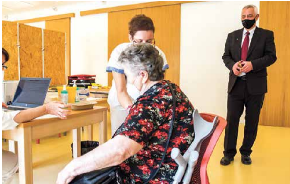
Tak jako v Konici může v budoucnu probíhat očkování i na dalších místech Olomouckého kraje. Právě možnosti tohoto scénáře měl pilotní projekt ověřit.

V kraji je v současné době osm míst, kde se mohou lidé nechat proti covid-19 naočkovat. Vakcina-