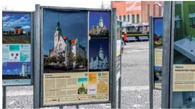
Fotografické panely přibližují místa v Olomouckém i Moravskoslezském kraji, která prošla proměnou.

Od poloviny února je před Krajským úřadem Olomouckého kraje k vidění výstava Má vlast cestami proměn 2020/2021. Projekt, který probíhá už dvanáctým rokem, představuje prostřednictvím fotografií původní a současný stav areálů či objektů, které prošly obnovou.