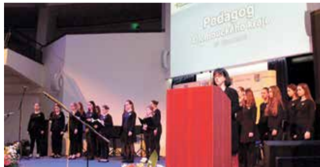
Kvůli epidemii koronaviru letos vyhlášení Pedagoga roku proběhne až v květnu.

„Termín vyhlášení Pedagoga roku jsme předběžně