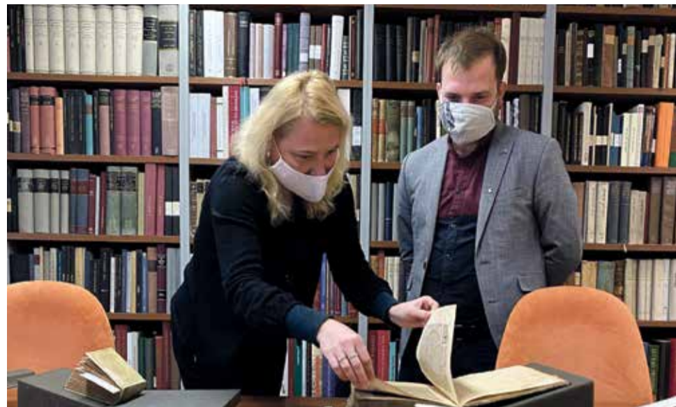
Knihovny jsou jedním z pilířů kultury v Olomouckém kraji.

Kromě Městské knihovny v Hranicích a Knihovny Vincence Priessnitzze v Jeseníku získala finanční prostředky na rozvoj také Knihovna města Olomouce