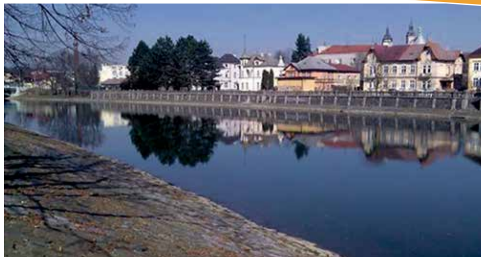
Nová protipovodňová hráz ochrání před padesátiletou vodou.

Současná podoba koryta řeky chrání pouze