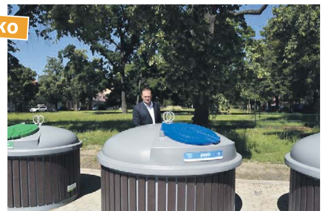
Polopodzemní kontejnery na separovaný odpad byly umístěny na devíti centrálních místech.

ný odpad byly umístěny na devíti centrálních místech na sídlišťích, vhodných z hlediska přístupu občanů a dopravní služby. „Realizací projektu došlo k náhradě stávajících pětadesáti kusů kontejnerů o dostupném objemu 60,5 metrů krychlových za třicet šest kusů polopodzemních kontejnerů o dostupném objemu 130,5 metrů krychlových. Došlo tedy k navýšení dostupného objemu pro odkládání odpadu. Kontejnery jsou používány na separaci plastu, papíru,