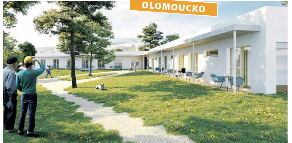
Ve Šternberku plánují nový domov pro seniory. Ten by v časovém horizontu pěti let mohl vzniknout v rozlehlé zahradě, která je v těsné blízkosti centra a městského parku Tyršovy sady. Foto: vizualizace maspartii

Přípravou nového domova pro seniory reaguje město Šternberk na současný trend stárnutí populace. V budoucnu by mohl vzniknout v rozlehlé zahradě v majetku města, která se nachází v těsné blízkosti centra a městského parku Tyršovy sady. „Jedná se o pozemek příjemného charakteru sousedící s mateřskou školou v ulici Obloukové. Možnosti stavby zde dlouhá léta limitoval nepravidelný tvar a omezené dopravní napojení. Domov pro seniory se ukázal být ideálním využitím,“ uvedla mluvčí šternberské radnice Irena Černocká. Doplnila, že do budoucna je možné pracovat i s tématem mezigeneračního setkávání seniorů a dětí, protože zahrady jak mateřské školy, tak i domova pro seniory spolu přímo z velké části sousedí. „Aktuální