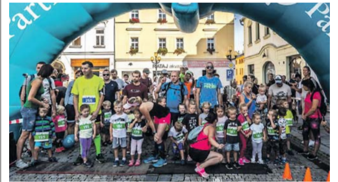
Centrum Šumperka ožilo běžeckým závodem.

13. září třikrát a zdolali tak celkem 10 kilometrů. Novinkou tohoto ročníku byly štafetové závody tříčlenných týmů. Závodníky přijel pozdravit hejtman Olomouckého kraje Ladislav Okleštěk. (red)