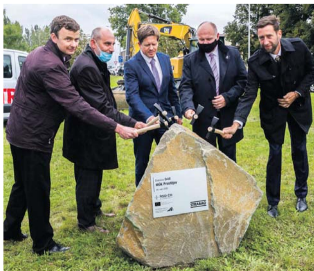
Koncem září začaly práce na D46 v Prostějově.

Ř editelství silnic a dálnic pokračuje ve stamilionových investicích do modernizace dopravní sítě v Olomouckém kraji. Koncem září začaly práce na D46 v Prostějově a také modernizace I/55 v Přerově – Předmostí. Olomoucký hejtmánství si rozšíření dálnic uložilo do svého programového prohlášení. „Obě stavby podstatně zvýší bezpečí řidičů a zefektivní dopravu. Jejich součástí bude i realizace protihlukových stěn, což jistě přivítají obyvatelé obou lokalit,“ uvedl Ladislav Okleštěk, hejtman Olomouckého kraje. Letošek se na D46 ponese v duchu přípravných prací. Naplno se začne stavět příští rok. Modernizace silnice v Prostějově vyjde