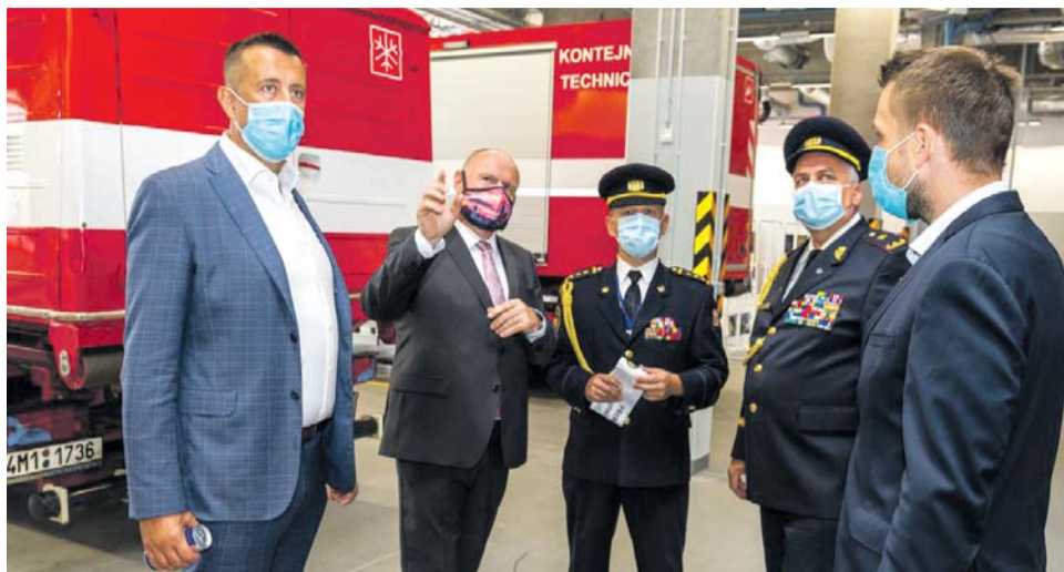
Profesionálním hasičům v Přerově teď slouží moderní komplex, jeho stavba vyšla na více než dvě stě milionů korun.

Prvními dvěma miliony korun přispěje Olomoucký kraj na plánovanou stavbu nové základny hasičů a záchranné služby v Prostějově. Peníze půjdou konkrétně na pořízení projektové dokumentace. Jde o první krok na dlouho očekávané cestě, na jejímž konci bude