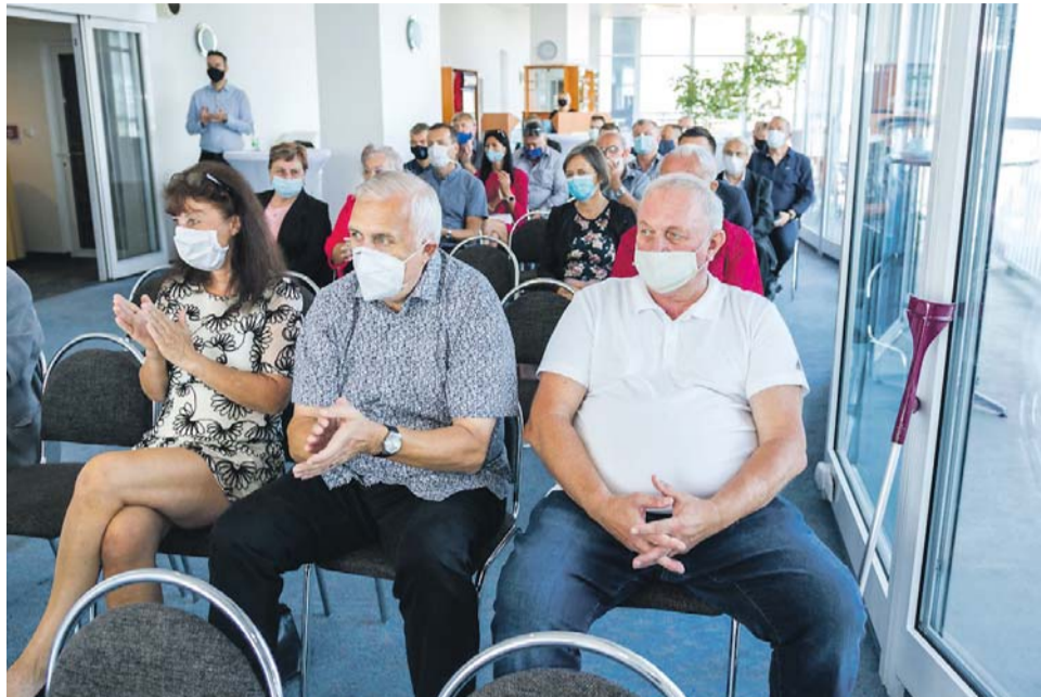
Hejtmanství ocenilo trenéry a sportovní funkcionáře za dlouholetou práci a přínos k rozvoji sportu.

Olomoucký kraj věnuje oblasti sportu velkou pozornost. Především se zaměřuje na mládež. Spolkům, které působí na území regionu, pomáhá například prostřednictvím dotačních programů a podporuje i výchovu kvalitních trenérů. Pravidelně organizuje také vyhlášení nejlepších sportovců Olomouckého kraje.