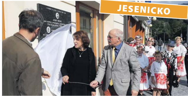
Původní deska byla z roku 1926 a po válce zmizela.