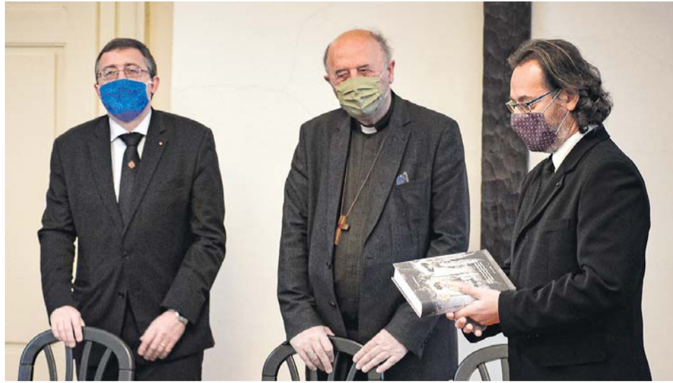
Kniha byla představena v komorním kruhu několika členů řádu v Andělském sále olomouckého Arcibiskupského paláce. Arcibiskup Jan Graubner (uprostřed) knize požehnal a popřál, ať svým čtenářům přinese radost z poznání a poučení a také novou oblibu v kráse a ušlechtilosti.

Na více než 400 stranách se čtenáři seznámí s dlouhou historií řádu, od legendárních počátků až po nedávnou změnu jeho statutu, přičemž autor kladě důraz na působení řádu v českých zemích. Kniha dává nahlédnout také do organizační struktury řádu a představuje jeho symboly, liturgické oděvy a především poslání, jímž je podpora charitativních, kulturních a společenských aktivit a institucí katolické církve ve Svaté zemi. Součástí je i přehled českých, respektive československých osobností, které byly členy řádu.