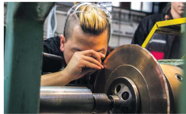
Olomoucký kraj uspěl v oblasti vzdělávání se dvěma projekty. Ilustrační foto

Školy se mohou těšit rovněž na nová a moderně vybavená technická pracoviště. Na realizaci bude hejtmanství spolupracovat