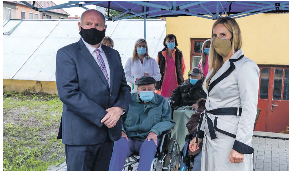
Centrum sociálních služeb v areálu bývalé prostějovské nemocnice nabízí ucelenou péči.

„Areál bývalé prostějovské nemocnice se Olomouckému kraji daří postupně rekonstruovat tak, aby Centrum sociálních služeb, které tu vzniklo, nabízelo ucelenou péči - od domova pro seniory, přes odlehčovací službu, až po denní stacionář a chráněné bydlení. Pečovatelská služba je dalším kamínkem do této mozaiky,“ uvedl hejtmán Ladislav Okleštěk.