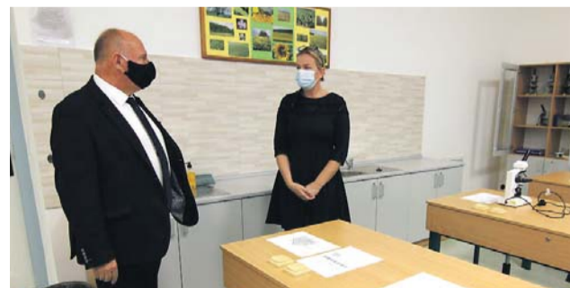
Hejtmán Ladislav Okleštěk si prohlíží učebnu přerovské zemědělký.

Jednopodlažní hala o rozměrech 53 x 17 metrů