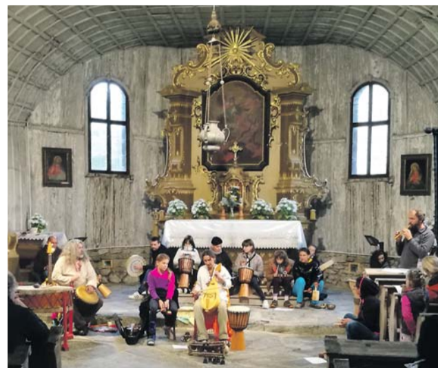
Společenské odpoledne vyvrcholilo koncertem v kostele sv. Michaela.