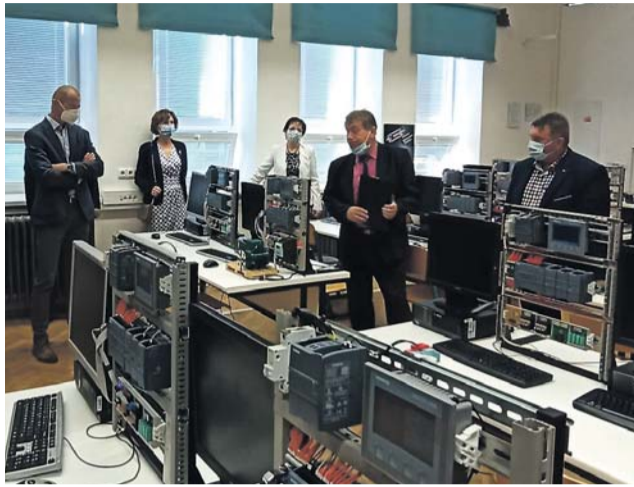
Menší investice, ale stejně důležité, má za sebou také mohelnická průmyslovka.

Jakým způsobem školy využily krajské peníze na modernizaci, to si v září na vlastní oči prohlédli Ladislav Okleštěk, hejtmán Olomouckého kraje a Ladislav Hynek, krajský náměstek pro školství. První z nich zamířil do nově zrekonstruovaného gymnázia v Přerově, druhý vyrazil opačným směrem - do Mohelnice. „Budova gymnázia Jakuba Škody patří mezi památkově chráněné objekty. Po rekonstrukci je nejen krásná, ale také plně funkční a úsporná. Vyměněna byla okna, dveře, nová je střecha, fasáda i dešťová kanalizace,“ pochvaloval si proměnu školy hejtmán Okleštěk.