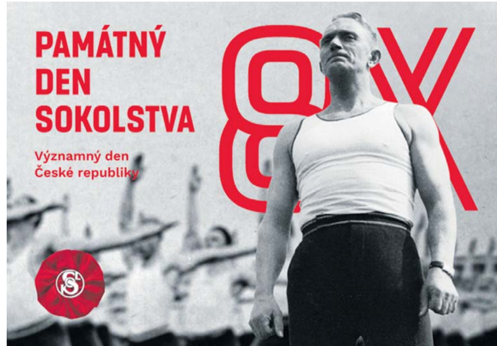
Datum 8. října bylo zvoleno jako připomínka tragických událostí roku 1941.

Datum 8. října bylo zvoleno jako připomínka tragických událostí roku 1941. V noci ze 7. na 8. října 1941 gestapo v rámci „Akce Sokol“ zatkl na 1 500 sokolských činovníků z ústředí, žup i větších jednot. Byli mučeni, vězněni, deportováni do koncentračních táborů. Plyných 93 % z nich do konce války zahynulo. Ještě během této noci podepsal Reinhard Heydrich