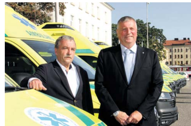
Olomoucký kraj do dnešního dne pořídil třicet nových sanitek.

Nově pořízené Volkswageny přišly na zhruba 24,5 milionu korun. Na zadávacích podmínkách pro jejich dodavatele