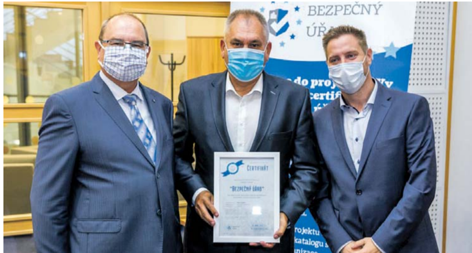
Vybrané obce a jejich základní a mateřské školy získaly ocenění v oblasti bezpečnosti.