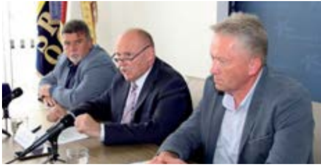
Olomoucký kraj daruje zhruba 170 požárních hlásičů a detektorů.

Olomoucký kraj daruje zhruba 170 požárních hlásičů a detektorů nebezpečných plynů seniorům a lidem s hendikepou. Jde o výsledek pilotního projektu, na kterém hejtmánství začalo pracovat už vloni. Právě starší lidé s různou formou tělesného postižení patří při požárech mezi nejohroženější skupinu obyvatel.