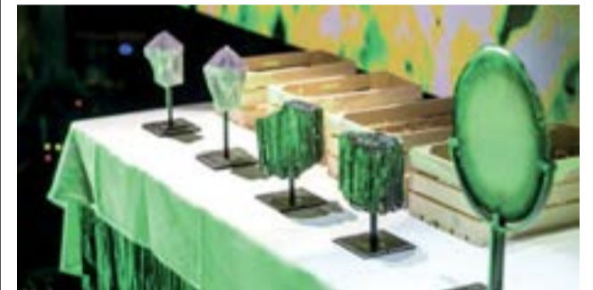
Hejtmanství rozdalo ocenění v oblasti životního prostředí.

Absolutním vítězem ankety se staly Arcibiskupské lesy Olomouc. Cenu hejtmána získala in memoriam Magda Zmrhalová a například ocenění za významný počin v kategorii voda si odneslo Povodí Moravy společně s CHKO Litovelské Pomoraví. Olomoucký kraj začal ceny za životní prostředí udělovat jako vůbec první v Česku. Chce tak lidem a firmám poděkovat za ochranu přírody a motivovat je k dalším ekologickým aktivitám. (red)