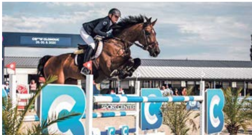
V Olomouci se konal 7. ročník Světového poháru v parkuru.