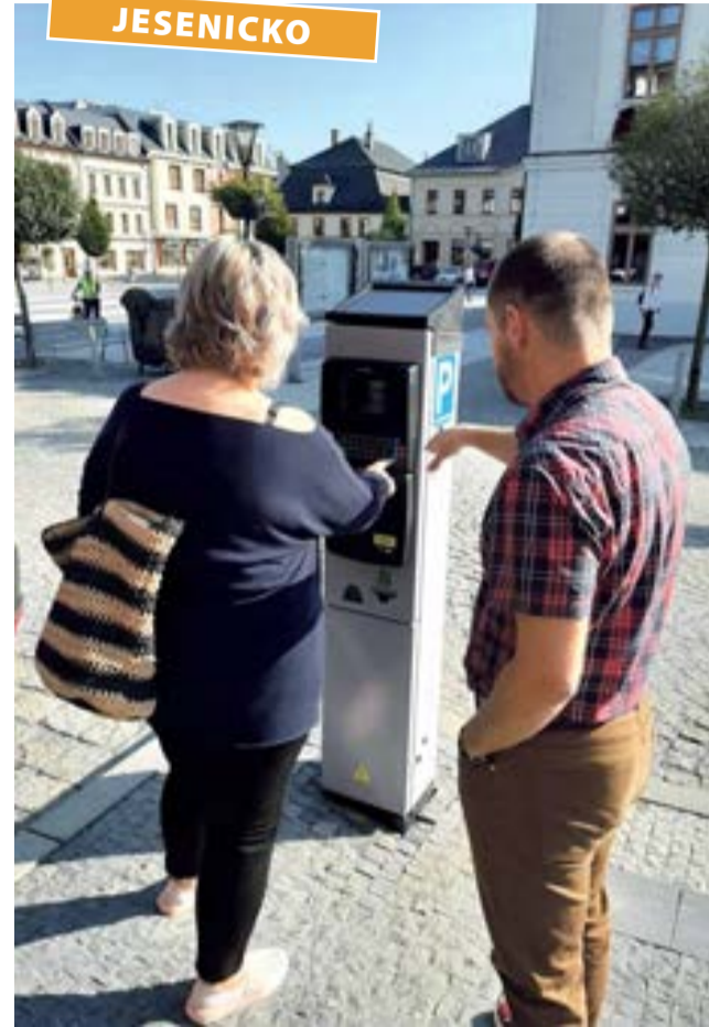
Moderní přístroje nahradily poruchové parkovací automaty.