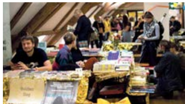
Knižní veletrh láká i na program pro děti.

Novinkou je spolupráce s festivalem Děti, čtete?, který zábavnou literárně-dramatickou formou přibližuje knížky dětem i jejich rodičům. Pro děti od 6 let se chystá čtení z kni-