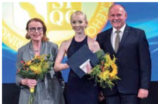
Olomoucký kraj rozdál ceny v oblasti kultury.

C elkem deset cen v oblasti kultury za rok 2019 udělil v úterý 1. září Olomoucký kraj. Slavnostní ceremoniál se uskutečnil v Městském domě v Přerově. Mezi oceněnými jsou autoři literární, televizní nebo divadelní tvorby. „Loňský rok byl pro kulturu v Olomouckém kraji mimořádně úspěšný. Děkuji všem lidem, kteří se podíleli na pořádání koncertů, výstav nebo tvorili literární či filmová díla. A děkuji také těm, kteří si knihy zdejších autorů kupovali, sledovali jejich