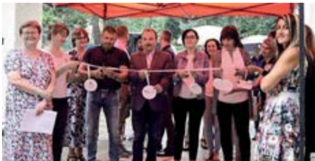
Prostory Charity Šternberk prošly rekonstrukcí.

Novotou září prostory charitního střediska ve Šternberku, které prošly nákladnou rekonstrukcí. Slavnostního otevření se začátkem srpna zúčastnil i náměstek hejtmána Dalibor Horák. „Před pár měsíci jsem měl příležitost na vlastní oči vidět tyto prostory před zahájením oprav. Mohu konstatovat, že proměna je dokonalá, jako bych se posunul v čase o několik desetiletí,“ uvedl náměstek Horák.