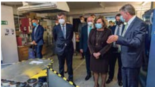
Premiér Andrej Babiš navštívil region.