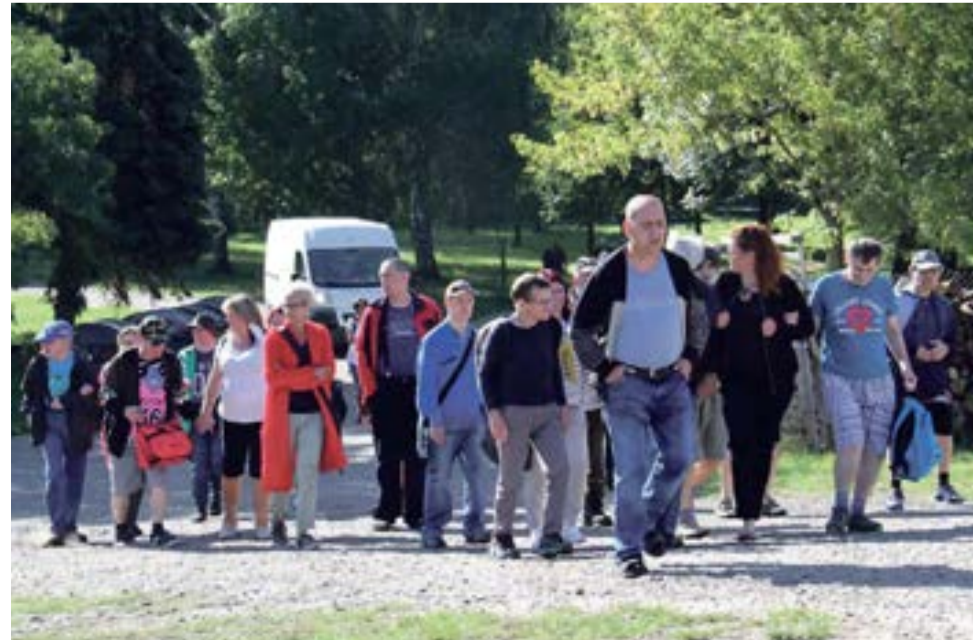
Olomoucké Poděbrady ožily zábavou a dobrou náladou.

Areál přírodního jezera Poděbrady u Olomouce hostil v polovině září už dvanáctý ročník akce nazvané Rozloučení s létem. Setkání, které hejtmánství pořádá pro klienty krajských příspěvkových organizací, jež se starají o osoby se zdravotním postižením, tentokrát přilákalo na sto padesát klientů těchto zařízení. „Dvouciferná číslíčka, která označují pořadí tohoto ročníku, jasně ukazují, že akce stále láká a baví ty, pro něž ji pravidelně organizujeme. Jsem rád, že vyšlo počasí a lidé si užili připravený program,“ řekl hejtmán Ladislav Okleštěk. (red)