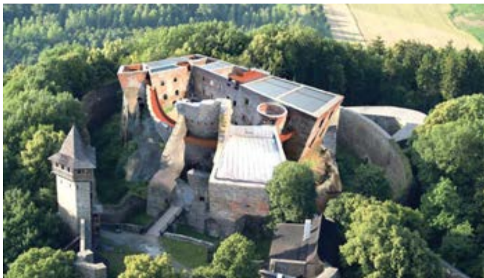
Hrad Helfštýn patří mezi nejnavštěvovanější památky na území Olomouckého kraje. Loni tam i navzdory omezením, souvisejícím s rekonstrukcí paláce, zavítalo na 70 tisíc turistů.

O opravě hradu se mluvilo mnoho let. Až v poslední době se ale daly věci, respektive zednické lžíce, kladiva a tesařské nástroje, do pohybu. Helfštýn se teď může pochlubit novou střechou, rekonstruovanými výstavními prostory a jedinečným vyhlídkovým okruhem. „Část prostoru nad bývalou kaplí zastřešuje pískovaneé sklo, které symbolizuje otevřenou oblohu. Zvolené řešení považují za citlivé k původní stavbě, navíc Helfštýn tím získá potřebné výstavní prostory. Kromě příspěvku do obnovy historické památky tím zároveň investujeme do cestovního