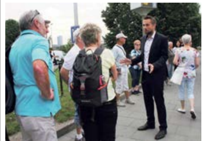
Projekt Seniorské cestování nekončí, pokračovat bude příští rok.

Shledem na aktuální epidemiologickou situaci a doporučení hygieniků letos Olomoucký kraj nebude realizovat projekt Seniorské cestování. Peníze, které takto hejtmanství ušetří, však vnívat nepřijdou. Kraj chce seniorům pomoci jinak.