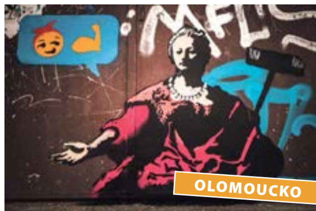
Street artovou techniku šablon používá například umělec Banksy.