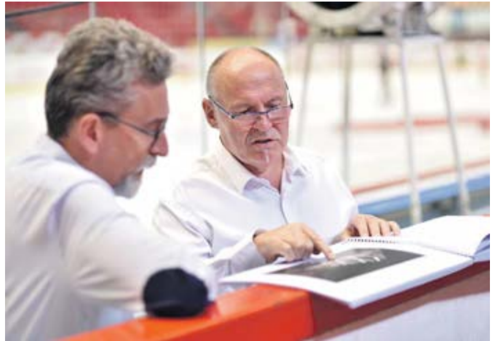
Rekonstrukce sportovní haly je nutná.

Rekonstrukce hokejové arény patří mezi priority města. Její současný stav je neutěšený a modernizaci nutně potřebuje. Hejtmánství a olomou-