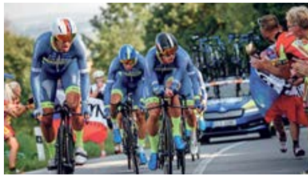
Světový pohár v silniční cyklistice se jel i v našem regionu.

z Prostějova do Uničova, z Olomouce do Frýdku-Místku a závod vyvrcholil v neděli jízdou z Mohelnice do Šternberku. Světový pohár v silniční cyklistice Czech Tour 2020 je nejvýznamnější cyklistickou akcí na území České republiky, které se účastní hvězdy světové silniční cyklistiky. (red)