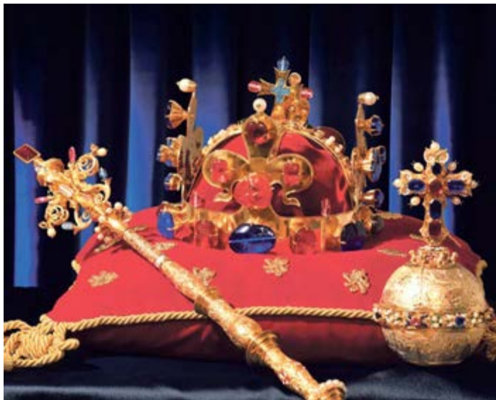
Na repliky korunovačních klenotů v kompletně celé sestavě, se mohou těšit návštěvníci Vlastivědného muzea v Olomouci.

N a mistrovské repliky českých korunovačních klenotů z dílny Jiřího Urbana, které budou k vidění v kompletně celé sestavě, se mohou těšit návštěvníci, kteří zamíří do Vlastivědného muzea v Olomouci. Součástí výstavy budou i repliky původního gotického královského jablka a žezla, které jsou uloženy ve Vídni a zároveň i replika Svatováclavského, korunovačního, meče. Výstava se bude dále věnovat příběhu 22 korunovaných panovníků, které doplní i další exponáty jako je kopie Pražského Jezulátka s kopii šatiček vyšívaných Marií Terezií, replika Řádu zlatého rouna a mnoho dalšího. Expozice bude přístupná od 15. října do 24. ledna příští roku. (red)