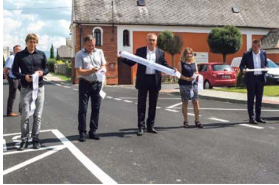
Oprava zhruba sedmikilometrového úseku byla rozdělena do dvou etap.

Stavební firma nejprve odfrézovala původní živou vrstvu. Následovalo zpevnění okrajů silnice a ve finále pokládka nového povrchu. Výměnou