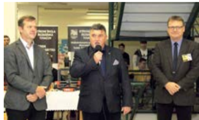
Náměstek hejtmána Ladislav Hynek (uprostřed) při zahájení posledního ročníku přehlídky středních škol Scholaris Olomouc. Jejím cílem je poskytnout žákům a jejich rodičům informace o vzdělání a o situaci na trhu práce v regionu.

Školy se mohou těšit rovněž na nová a moderně vybavená technická pracoviště. Na realizaci bude hejtmánství spolupracovat