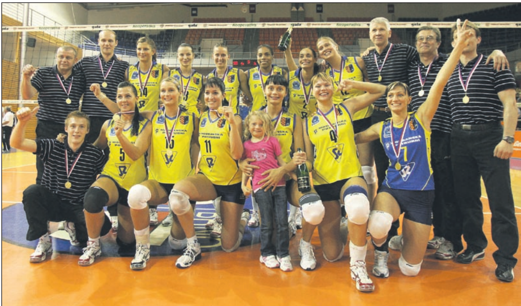
Mistrovský titul slavily prostějovské volejbalistky na brněnské palubovce.