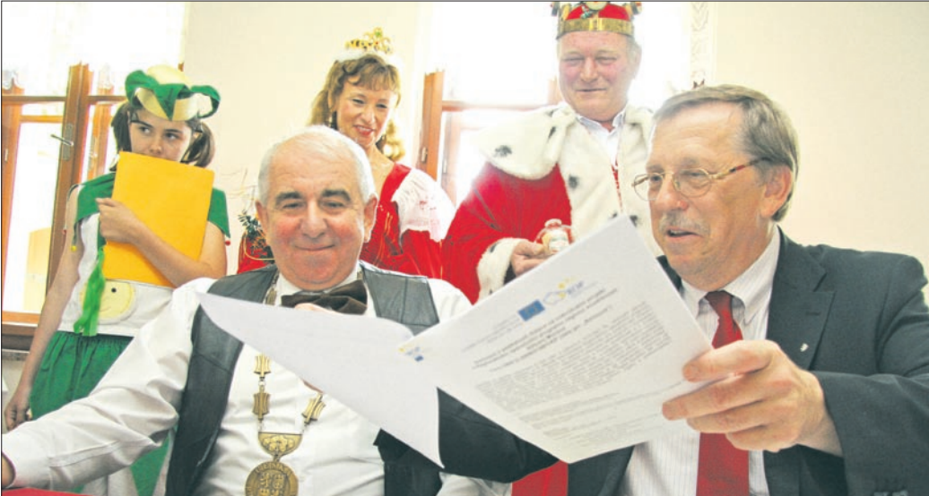
Na podpis smlouvy o dotaci na rekonstrukci kulturního domu v Lošticích symbolicky dohlížel „tvarůžkový“ královský pár.

území Olomouckého a Zlínského kraje. „V Regionálním operačním programu bylo dosud schváleno 436 projektů,“ uvedl Tesařík. Největším podpořeným projektem za poslední dobu bude podle jeho slov rekonstrukce sokolovny v Nezamyslicích a její propojení s nově vybudovanou tělocvičnou za 48,5 milionu korun. Sportovně relaxační centrum bude sloužit také pro pořádání kulturních akcí. Rekonstrukci sokolovny připravují i v obci Slatina, a to díky projektu, jenž získal částku 17,5 milionu korun. „Sokolovna je od roku 1935 středem dění v obci, pořádají se v ní kulturní a společenské akce a slouží také pro cvičení žáků naší základní školy,“ popsal starosta Slatinic František Žouželka (nez.)