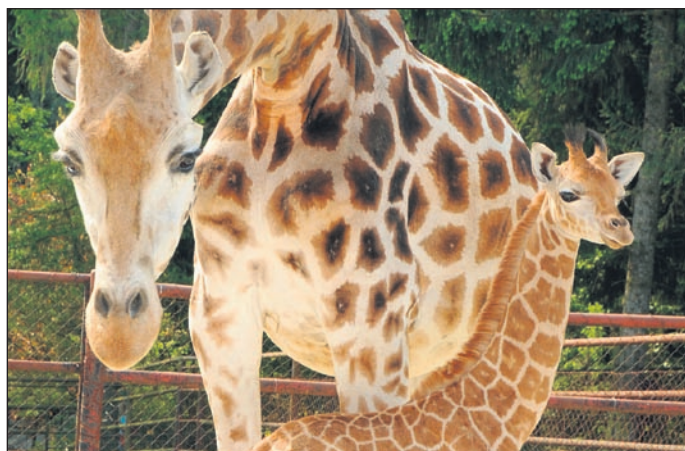
Malá slečna Haná je v pořadí 46. žirafím mládětem v zoo na Svatém Kopečku.

ku narodilo. Je zároveň třetím potomkem třináctileté matky Kazi a pátým potomkem šestiletého vůdce stáda samce Marca. Žirafa Rothschildova patří mezi atraktivní druhy zvířat. Samice je březí 457 dnů, mívá jen jedno mládě, dvojčata se rodí velmi zřídka. Mládě pije mléko 12 - 15 měsíců a dospívá okolo čtvrtého roku života. Žirafy žijí v malých stádech do patnácti kusů, bez vnitřní hierarchie. Dospělá žirafa se brání kopáním a netroufne si na ni ani lev. Dožívá se dvaceti a více let. Žirafa je nejvyšším savcem na světě, samci dosahují výšky přes pět metrů. Zvířatům v olomoucké zoo se díky péči chovatelů daří. Důkazem je nedávné prestižní ocenění „Odchovek roku“, které každoročně uděluje Nadace Česká zoo.