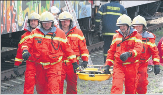
Cvičení ve formě simulované srážky vlaků prověřilo připravenost záchranářů.