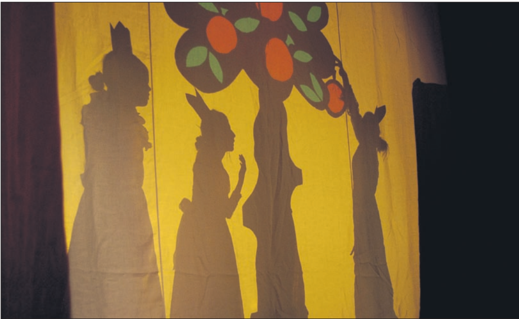
Představení se těšilo velkému diváckému zájmu.