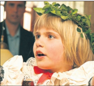
Přerovský folklorní festival nabídne i dětské soutěže.

Lipník nad Bečvou – Propagační výstavu koček pořádají v sobotu 6. června v Lipníku nad Bečvou. Akce se uskuteční u příležitosti Mezinárodního dne dětí ve spolupráci městské knihovny a Základní organizace Sdružení chovatelů koček Přerov. Výstava proběhne od 9 do 17 hodin ve výstavním sále městské knihovny zvané Domeček. Součástí akce bude také výstava prací dětí mateřských škol, které se zapojily do výtvarné soutěže „Kotata, kočičky aneb naši mazlíčci“. V den konání akce předá odborná porota dětským výhercům ceny. Těšit se mohou například na domácí dort. (lb)