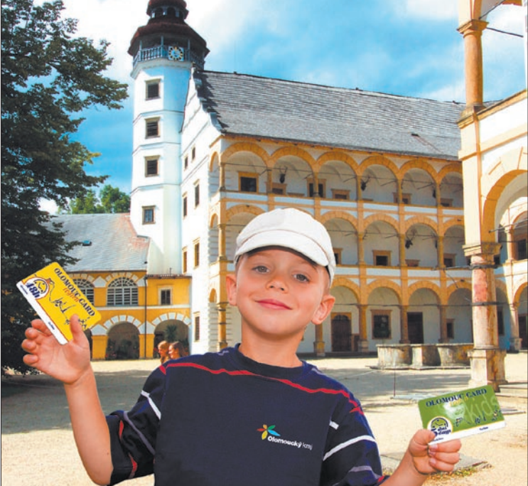
Na zámku ve Velkých Losinách se nachází mimo jiné i soudní síň, ve které se odehrávaly nechvalné prosulé čarodějnické procesy.

Při cestě na Šumpersko by výletníci neměli minout ani zajímavé památky mimo město. Hned dvíjí příležitost uplatnit bezplatný vstup na slevovou kartu, mohou návštěvníci využít ve Velkých Losinách. Prohlédnout si mohou nejen exteriér známého renesančního zámku, ale zejména jeho interiéry. V těch se kromě původního žerotinského vybavení nachází také umělecká díla z významných šlechtických objektů v okolí. Za pozornost stojí především rytířský sál s vykládanými parketami a koženými tapetami. Pýchou zámku jsou zejména vzácné