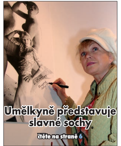
Umělkyně představuje slavné sochy čtěte na straně 6