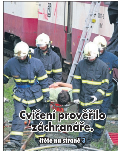
Cvičení prověřilo záchranáře. čtěte na straně 3