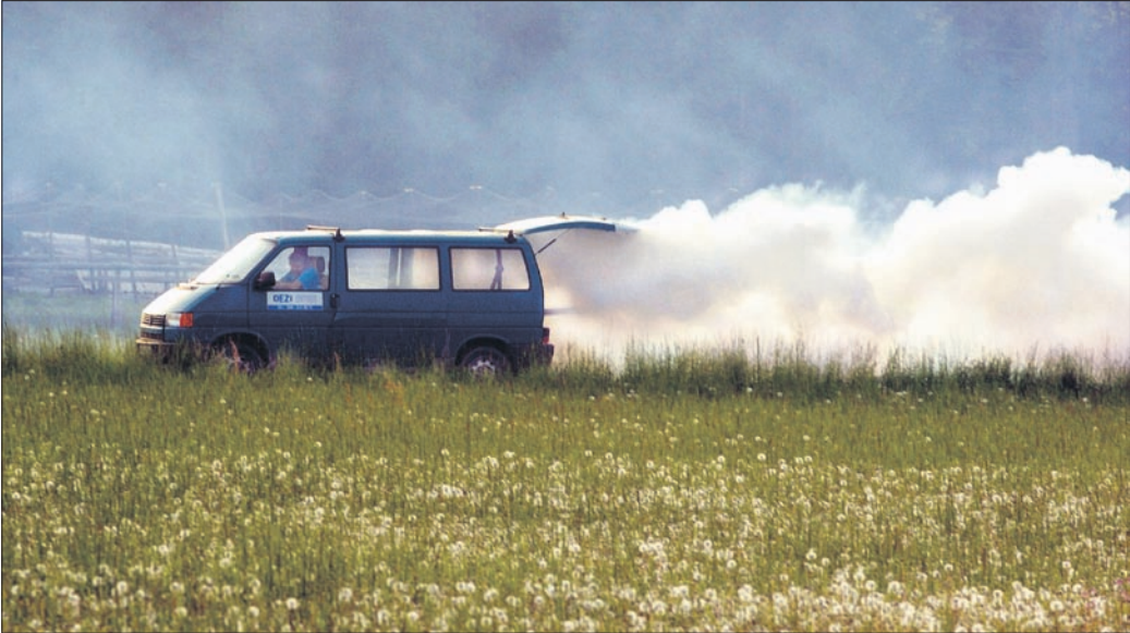
Jednou z metod, jak bojovat s přemnoženými komáry, je aplikace aerosolu v místech největšího výskytu hmyzu.

Olomoucký kraj - „Na kraj se společným dopisem obrátily obce Litovel, Střeň, Náklo a Příkazy s žádostí o pomoc při řešení vzniklé situace,“ popsal náměstek hejtmána Pavel Horák (KDU-ČSL). Kalamitní výskyt komárů potvrdila podle jeho slov krajská hygienická stanice ve všech zmíněných obcích a doporučila postřík aerosem. Ten bude aplikován především v místech s hustou zelení, kde se komáři nejvíce zdržují. „Starostové se tak nyní mohou obrátit na kraj s žádostí o poskytnutí příslušné dotace. Na řešení vzniklé situace poskytneme celkem čtvrt milionu korun. Obcím zaplatíme až osmdesát procent nákladů na provedená opatření,“ upřesnil Horák. Žádosti obcí projedná krajská rada a následně i zastupitelstvo, které se bude