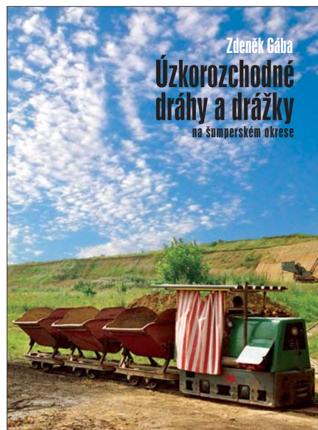
Nejen milovníky železnice potěší nová publikace o historii úzkorozchodných drah na Šumperku.