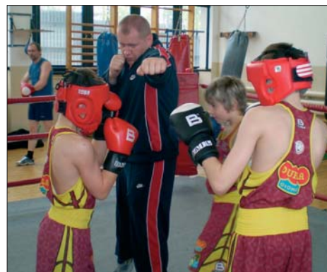
Boxeři z olomouckých Duklů se na mistrovství rozhodně neztratili.