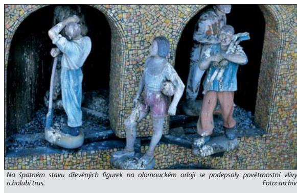
Na špatném stavu dřevěných figurek na olomouckém orloji se podepsaly povětrnostní vlivy a hálou trus.