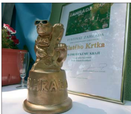
O divácké hlasy, vedoucí k zisku populárního Krta, budou letos na festivalu Zahrada usilovat desítky muzikantů.

Neuvěřitelné osmdesáté narozeniny oslaví přímo na festivalu fenomenální valašská zpěvačka Jarmila Šuláková. Návštěvníci se mohou těšit na sobotní koncert Jarka Nohavici, který se jinak festivalům vyhýbá. Zpěvačka Pavla Bobka na koncertu doprovodí Robert Křesťan a Druhá tráva. Tečku za unikátní šňůrou více než stovky koncertů v řadě udělá na zahradě skupina Kamelot. Muzikálová hvězda Iva Marešová přehodila výbuku na folk a představí se za podpory muzikantů, kteří v minulosti hráli s Vlastou Redlem. Diváci ocení i bezpochyby překvapující vystoupení tohoto uznávaného interpreta. Dostaveníčko si na letošním jubilejním festivalu dají také folkové legendy, za všechny jmenujme například Spirituál kvintet, Zálman a spol., Wabiho Daňka či skupinu Nezmaři. Po skončení večerních programů jsou ve čtvrtek a v pátek připraveny noci plné tance. Včít