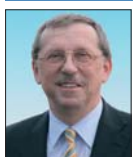
Rozděluje další evropské miliardy

Do konce letošního roku bychom měli v Regionálním operačním programu (ROP) Střední Morava vyhlásit dalších šestnáct výzev. Olomoucký kraj společně se Zlínským krajem by tak mohl získat přibližně dvě miliardy korun. Tyto výzvy budou vyhlášeny a hodnoceny podle nového modelu, který mimo jiné zohledňuje aktuální potřeby obou krajů, které povedou k jejich rozvoji. Na nedávném setkání se starosty obcí na Šumpersku jsem s potěšením mohl konstatovat, že této části kraje se daří velmi dobře čerpat evropské peníze. V získávání dotací z ROPu bylo prozatím úspěšných celkem osmnáct z pětácti obcí, které administrativně spadají do působnosti města Šumperka. Řada z nich přitom realizuje hned několik aktivit. První na území Šumperka je to celkem deset projektů, jde například o rekonstrukci zastávek hromadné dopravy ve městě. Loučná nad Desnou uspěla se šesti projekty, dařilo se i Víkovicím nebo Lipové-lázním. Celkem má být na území Šumperka proinvestováno z ROPu bezmála 640 milionů korun. Uvedená částka bezpochyby významně podpoří tuto část našeho kraje, která má obrovský potenciál zejména v oblasti rozvoje cestovního ruchu.