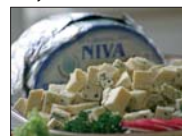
Jedním z oceněných výrobků byl i známý sýr Niva z mlékárny v Otíně.