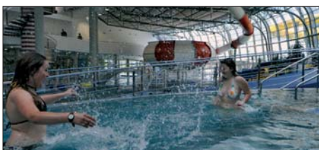
Olomoucký aquapark nabízí řadu atrakcí.