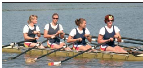
Na Brněnské přehradě vybojovali zástupci olomouckého veslařského klubu celkem devatenáct medailí.