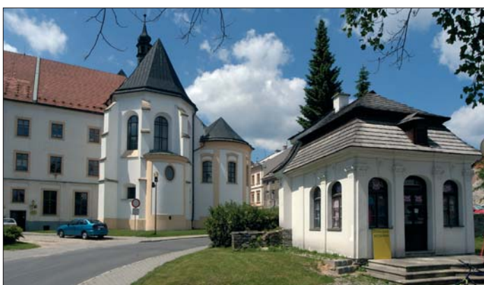
Město Šumperk je v získávání evropských dotací mimořádně úspěšné.

Olomoucký kraj – Loučná nad Desnou za více než 21 milionů korun přebuduje bývalou zámekovou oranžerii na kulturní dům. Právě v této obci v uplynulých dnech předseda regionální rady a hejtman Olomouckého kraje Martin Tesářík (ČSSD) podepsal smlouvy s příjemci. „Loučná nad Desnou navíc patří mezi vesnicemi a menšími sídlky k nejúspěšnějším žadatelům o dotace v rámci celé České republiky“, uvedl hejtman. Získávat evropské dotace se daří také obci Víkovic na Šumpersku. V současnosti vesnice uspěla