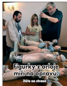
Figurky z orloje míří na opravu.