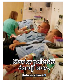
Stovky policistů darují krev.