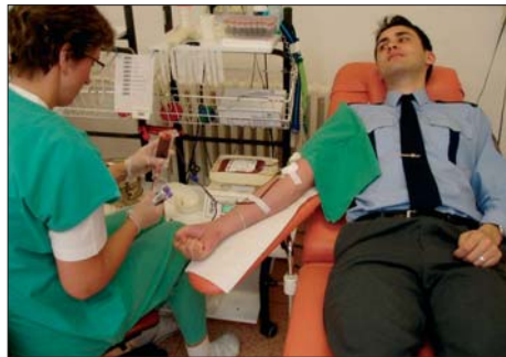
Stovky policistů v Olomouckém kraji darují krev pravidelně.

B ežmála 150 žen a mužů z řad policie se v uplynulých dnech zapojilo do akce „Policisté darují krev“. Téměř třetina z nich zavítala na některou z transfúzních stanic v Olomouckém kraji vůbec poprvé.