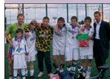
Mladé fotbalisty pozdravil trenér František Straka.

Praha – První místo v celostátním turnaji O pohár české fotbalové reprezentace získali v pondělí 1. června v Praze na Julisce mladí fotbalisté z Dětského domova Lipník nad Bečvou. Suverénně prošli regionálními výběrovými koly a nenechali se zastavit ani ve finále v Praze, kterým prošli bez jediné prohry. Mladí sportovci měli jedinečnou příležitost setkat se s řadou fotbalistů nového reprezentačního výběru v čele s trenérem Františkem Strakou. Vítězství v poháru, který je součástí celostátní akce DD CUP 2009, je výsledkem několikaleté práce s mladými fotbalisty, na které se kromě pracovníků DD Lipník významnou měrou podílí i město Lipník nad Bečvou, které sportovce již několik let finančně podporuje systémem grantů a pravidelně umožňuje trénovat na všech městských sportovištích včetně vytyčeného fotbalového hřiště s umělým povrchem. (mas)