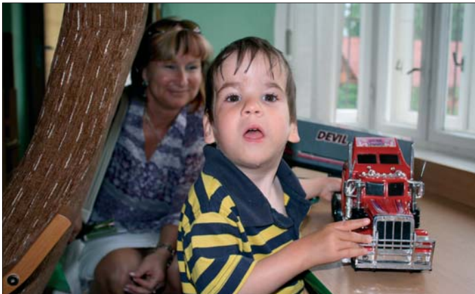
Radní zavítali i do šumperského dětského centra Pavačinka, které mimo jiné pečuje o zdravotně handicapované, opuštěné nebo týrané děti.