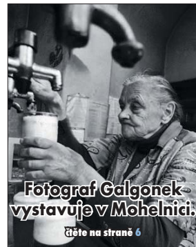
Fotograf Gálgonek vystavuje v Mohelnici.