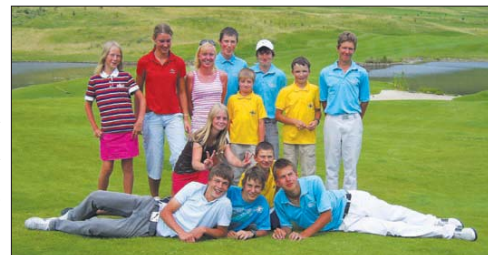
Mladí golfisté GC Olomouc se začínají stále více prosazovat i na národní úrovni.

ním větrem, Olomoučané zabojovali a drželi průběžně druhé postupové místo jen o dvě rány za družstvem GC Semil a s náskokem dvanácti ran před třetím GC Kunětická hora. Konečný výsledek byl ale nad očekávání. Stejným počtem ran se na prvním a druhém místě umístily Golf Club Kunětická hora a Golf Club Olomouc, kteří postupují do I. ligy. (noj)