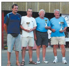
Přerovští borci s vybojovanými poháry.