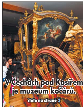
V věchách pod Kosířem je muzeum kočárů.