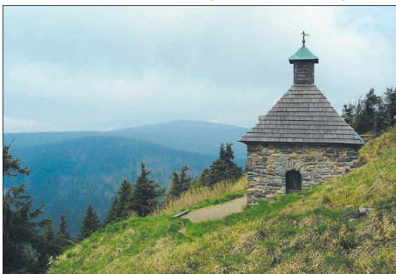
Malebný pohled na krajinu ve výšce 1313 m n. m. nabízí poutníkům okolí Vřesové studánky.

Na návštěvníky čeká krásná příroda i adrenalinové zážitky