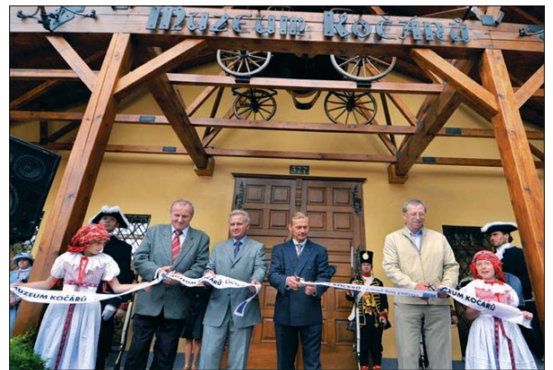
Otevřením unikátního muzea v Olomouckém kraji přibyl další zajímavý objekt pro turisty.

muzeu kočárů v Schönbrunnu v Rakousku,“ svěřil se Obr. Pracovníci muzea pro návštěvníky postupně připraví řadu zpestření prohlídky. Těšit se do budoucna mohou až na 50 kočárů včetně saní či největší sbírku lucerny ve střední Evropě. Součástí trasy bude také restaurátorská dílna, muzeum disponuje také archívem dokumentů a tiskovinou. Expozice nabídne také multimediální prvky v podobě zvukových, světelných a filmových projekcí. Celý program zprostředkuje průvodce v dobovém kostýmu s hravým výkladem. Vybudoval expozici kočárů napadlo Obr. asi před deseti lety, do stavby se pustil v roce 2006. „Do minulého roku jsem muzeum budoval sám z vlastních prostředků. Našemu občanskému sdružení Mylord se poté podařilo získat na projekt více než čtyři miliony z Evropské unie,“ poznamenal. Celkové náklady na otevření unikátní expozice dosáhly částky 15 milionů korun. Realizaci projektu pomohla podpora obce i Olomouckého kraje. Muzeum kočárů v Čechách mohou zájemci navštívit po celý rok mimo pondělí od 9 do 17 hodin, vstupenka pro dospělého přijde na 60 korun. (pv)