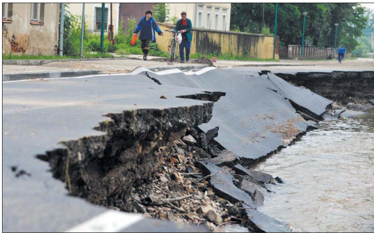
Obnova zničených komunikací v regionu si vyžádá stovky milionů korun.

Olomoucký kraj - Na Hranicku byla výše škod vyčíslena na zhruba 788 milionů, na Jesenícku se suma vyšplhala až na 2,9 miliardy korun. Voda zaplavila na území kraje celkem 1374 objektů, 817 domácností a 508 studen s pitnou vodou. Kromě více než stovky hasičských jednotek bylo nasazeno i 200 vojáků. Nepřetržitě zasedal krizový štáb Olomouckého kraje a krajského hasičského záchranného sboru. Bezpečnostní rada Olomouckého kraje se sešla sedmkrát. Olomoucký kraj vypsal i veřejnou sbírku na pomoc obcím, nezisko-