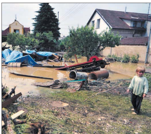
Pro děti je povodňová situace mimořádně nebezpečná a stresující.