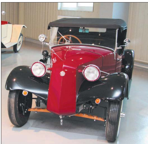
Muzeum návštěvníkům nabídne pohled na historická vozidla, která vypadají, jako by před chvílí sjela z výrobního pásu.

Olomouc - Milovníci automobilových veteránů se již brzy v Olomouci dočkají skutečného unikátu. Vášnivý sběratel vozů Tatra Lubomír Pešák finišuje s přípravami největšího veřejně přístupného muzea historických automobilů v České republice. Veterán Aréna, sídlící ve Sladovni ulici, nabídne na ploše větší než dva tisíce metrů čtverečních zhruba 100 vozů z 200 exponátů, které jsou jedinečné. „Řada prezentovaných modelů byla vyrobena v množství pouze několika málo kusů a mnohdy jsou už posledními dochovanými exempláři,“ říká Pešák, který