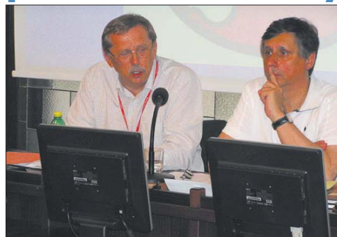
Důkazem rychlého řešení situace ze strany vlády je setkání hejtmánů Moravskoslezského a Olomouckého kraje s premiérem Fischerem.