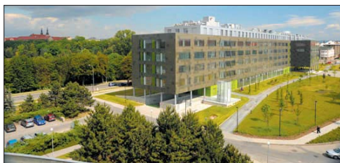
Prostor na olomoucké Envelopě získal novou dominantu.