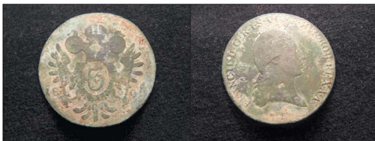
Mince, kterou archeologové našli v Lipníku nad Bečvou, se zachovala ve velice dobrém stavu.

Lipník nad Bečvou - Pozoruhodný objev učinili archeologové v bývalých konírnách zámku v Lipníku nad Bečvou. V úrovni novověkých terénních úprav se jim podařilo nalézt měděnou minci z roku 1800. Jedná se o tříkrejcar Františka II. (1768 – 1835), což je patrné z přední strany mince, kde je vyražen panovníkův portrét s vavřínovým věncem. Pod ním se nachází písmeno B jako označení po Vidni druhé nejdůležitější habsburské mincovny v zemi nacházející se v Kremnici. Na reversu je