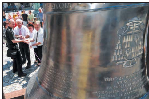
Největší zvon pro olomoucký chrám svatého Michala mohou obyvatele a návštěvníci města obdivovat přímo v centru krajské metropole.

Každý pátek v 16 hodin si mohou zájemci z řad veřejnosti vyzkoušet roli zvoníka při rozhoupání 250 kg těžkého srdce. Součástí instalace jsou také dva informační panely, které vysvětlují volbu jména Panna Maria a přiblíží lidem novodobou historii olomouckých zvonní a další záměry jejich poválečné obnovy. Na