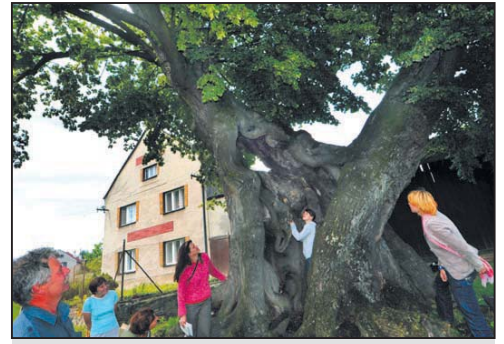
Do vykotlaného kmene mladějovické lípy velkolisté se vejde až 14 osob. Při pohledu z různých stran lze spatřit roztočivě fantazijní tvary.

Mladějovice – Hlasovat pro zástupce Olomouckého kraje – lípu z Mladějovic na Šternbersku – mohou až do 10. října obyvatelé z regionu. Památná dřevina se dostala do finále prestižní ankety Strom roku, kterou pořádá Nadace Partnerství. Stáří lípy je odhadováno na více než 700 let, je vysoká 17 metrů a našli bychom ji nedaleko kostela. Je unikátní zejména svým vzhledem – tvoří ji dva pokroucené kmene. Podle pověsti si pod stromem odpočinul sám Prokop Holý, když v roce 1430 se svým vojskem procházel krajem. Podpořit lípu z Mladějovic můžete mimo jiné zasláním SMS zprávy ve tvaru DMS STROM10 na telefonní číslo 87 777. Cena jedné SMS je 30 Kč. Nadace Partnerství