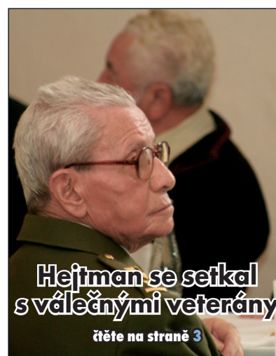
Hejtman se setkal s válečnými veterány čtěte na straně 3