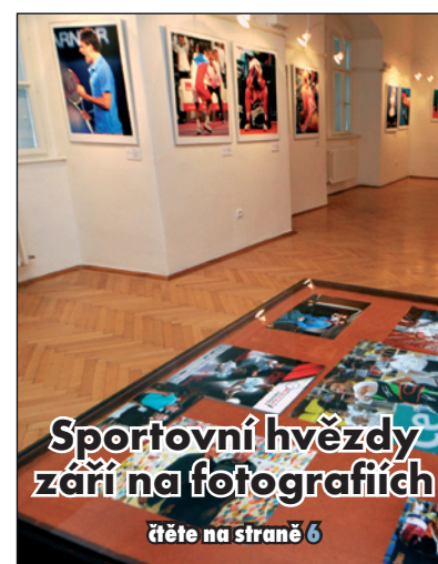
Sportovní hvězdy září na fotografiích čtěte na straně 6