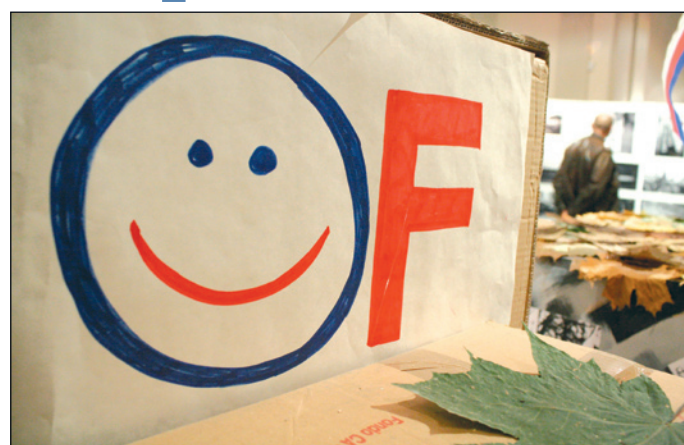
Na výstavě jsou kromě fotografií k vidění i předměty, dokumentující atmosféru revolučních dnů.

Více než 300 fotografií, které patří k cenným dokumentům doby v regionálním kontextu, doplňují další zajímavé exponáty pocházející ze sbírek Archivu Univerzity Palackého v Olomouci, Státního okresního archivu v Olomouci, archivu Moravského divadla v Olomouci, Československé obce legionářské Olomouc a soukromých