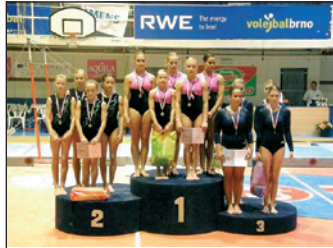
Šumperské gymnastky na stříbrném stupni.

Šumperk – Obrovského úspěchu se dočkaly závodnice Gymnastického klubu Šumperk na mistrovství České republiky ve sportovní gymnastice. V první lize družstev získala šumperská děvčata stříbrné medaile a zajistila si tím postup do extraligy.