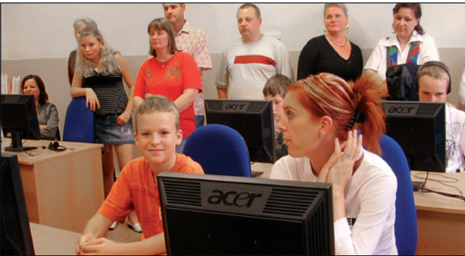
Díky projektu škola mimo získala nové vybavení jazykové učebny.

Cenové nabídky s uvedením případného účelu využití předmětných nemovitostí v k.ú. Klášterní Hradisko, obec Olomouc prosím zašlete nebo osobně doručte v termínu od 30. 11. 2009 do 1. 2. 2010 do 15.00 hod. na adresu: Olomoucký kraj, komise pro majetkoprávní záležitosti, Jeremenkova 40a, 779 11 Olomouc. Nabídku je nutno zaslat ve dvou uzavřených obálkách a v levém horním rohu obálek výrazně uvést slova „neotvírat – cenová nabídka Klášterní Hradisko“. Na obálce musí být rovněž uvedena doručovací adresa zájemce. Za včas doručené se považují nabídky, které byly Olomouckému kraji na uvedenou adresu v uvedeném termínu doručeny.