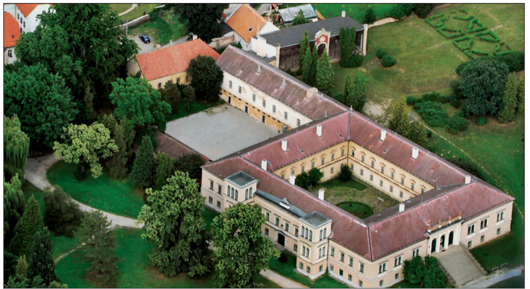
Park přiléhající k zámku v Čechách pod Kosířem patří podle odborníků k nejvýznamnějším v tuzemsku.

Zámecký areál leží na úpatí kopce Velký Kosíř a je neodmyslitelně spojen se jménem významného českého umělce Josefa Mánese. Malíř