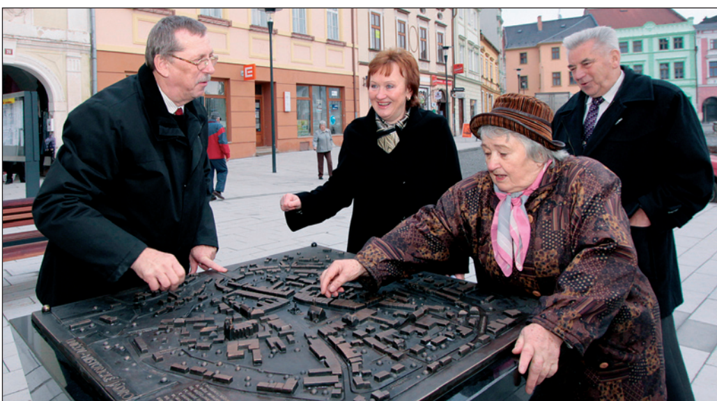
V centru Uničova se po rekonstrukci objevil i nový mobiliář. Patří mezi ně i bronzový znak města nebo ze stejného materiálu vyrobený reliéfní plán historického středu Uničova.

Uničov - Náměstí, jehož plocha činí bezmála 1,4 hektaru, během rekonstrukce zcela změnilo svůj vzhled. Zmizely trávníky i záhony, staré stromy nahradila nová výsadba a centrum se více přiblížilo historické podobě. K předlažbě byly z části využity původní, stářím ohlazené žulové kostky, které dnes tvoří povrch komunikace pro motorová vozidla. Na chodnících jsou položeny kamenné desky a střed náměstí kryje štípaná dlažba. Centrum Uničova je vybaveno zbrusu novým mobiliárem, jenž má moderní design. „Evropská unie se snaží podporovat rozvojové projekty