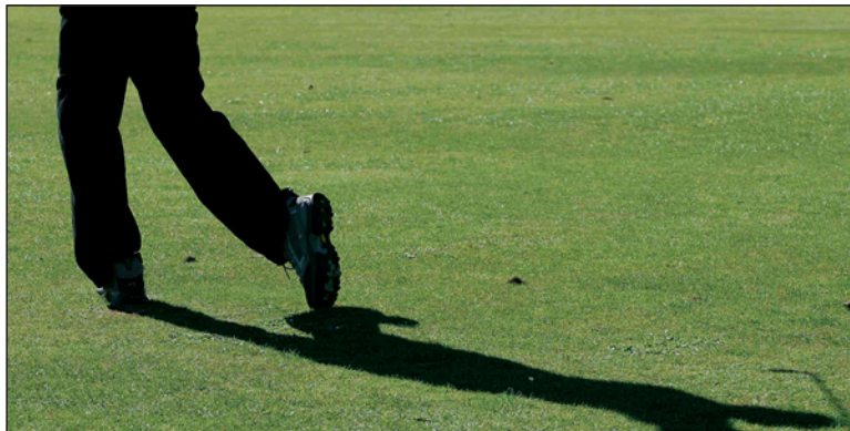
Atraktivní záběry ze sportovního prostředí jsou k vidění na výstavě v Přerově.