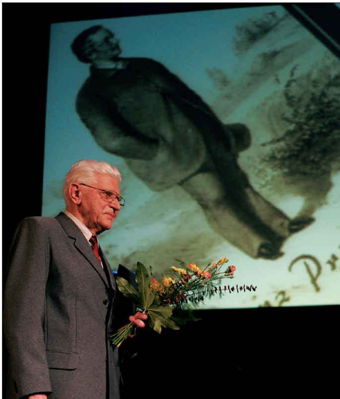
Významné osobnosti a kulturní počiny v Olomouckém kraji obdrží prestižní ocenění i v příštím roce.