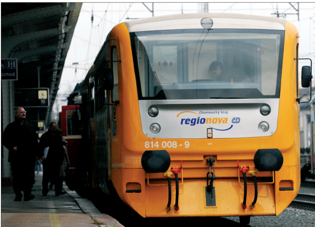
Cílem Olomouckého kraje je zabezpečit kvalitní dopravu obyvatel v celém regionu.

„Dojednali jsme podmínky, které jsou jedny z nejvýhodnějších ze všech 14 krajů včetně ceny 58,55 korun za vlakokilometr, které hradíme z rozpočtu kraje. Předpokládá se částka ve výši 348 milionů korun. Nárůst oproti roku 2009 činí 26 milionů korun. K tomu je nezbytné započítat i příspěvek od státu zaručený ze zmíněného memorandumu ve výši 208 milionů korun pro rok 2010,“ popsal náměstek. Zástupci společnosti RegioJet, a. s., která je