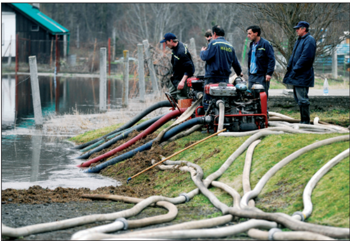
Na odstraňování následků povodní na Jesenicku a Hranicku se podílely jednotky profesionálních i dobrovolných záchranářů.

na pak dvacet obcí na Jesenicku. Povodně si vyžádaly tři lidské životy, stovky zaplavených domácností a dvanáct zničených mostů. Celkem se velká voda prohnala přes 29 obcí, v nichž způsobila celkovou škodu za takřka 4 miliardy korun. Jen opravy poničených komunikací v regionu si vyžádají stovky milionů korun. Voda zaplavila na území kraje celkem 1374 objektů, 817 domácností a 508 studentů s pitnou vodou. Kromě více než stovky hasičských jednotek bylo nasazeno i 200 vojáků. Nepřetržitě zasedal krizový štáb Olomouckého kraje a krajského hasičského záchranného sboru. Bezpečnostní rada Olomouckého kraje se sešla sedmkrát. (ku)