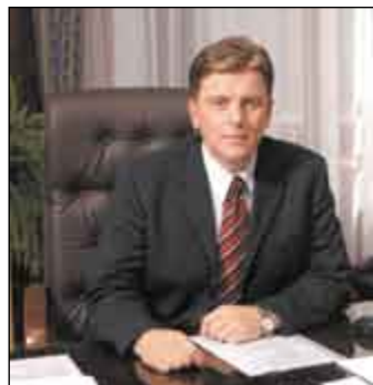
Předseda Poslanecké sněmovny Parlamentu ČR Miloslav Vlček.

Milí spoluobčané, srdečně Vás vítám v novém roce 2009. Přeji nám všem, aby nás každý den z následujících tří set šedesáti pěti provázelo štěstí, zdraví, síla, profesní a osobní úspěchy. Vím však, že tak snadné to asi pro nikoho z nás nebude. Nadcházející období před námi totiž staví problémy, které jsme v minulosti ještě neřešili. Celosvětová hospodářská krize pro nás byla maximálně pojmem z učebnic. Nyní její důsledky plnou silou dopadly na mnohé z nás, jiní je teprve pocítí. Přeji si moc, abychom obtíže, které nás v letošním roce zcela určitě potkají, dokázali společně řešit