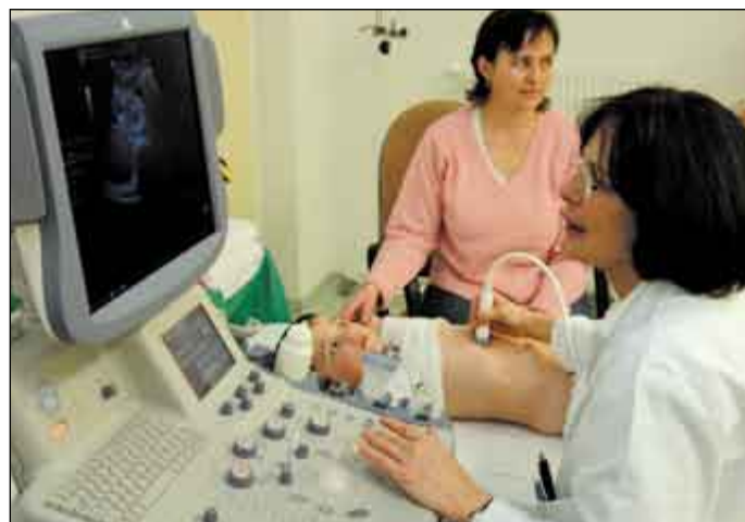
Od 1. února nebudou muset ve zdravotnických zařízeních, která vlastní nebo zřizuje Olomoucký kraj, pacienti hradit regulační poplatky.

„Úhrada regulačních poplatků ve zdravotnictví prostřednictvím darů občanům krajskou samosprávou není koncepčním řešením, které by mělo být praktikováno trvale. Jediným systémově správným řešením je rozhodnutí na úrovni Parlamentu České republiky“, doplnil Fischer. Krajská samospráva s napětím očekává výsledek projednávání