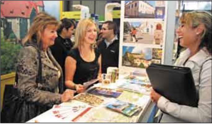
Aktuální nabídku pro turisty prezentovaly obce Olomouckého kraje i letos na tradičním brněnském veletrhu Regiontour.

D eset nových propagačních materiálů pro turisty vydá během letošního roku Olomoucký kraj. Na přípravu více než dvou milionů nových katalogů, průvodců a brožur získal příspěvek Evropské unie.