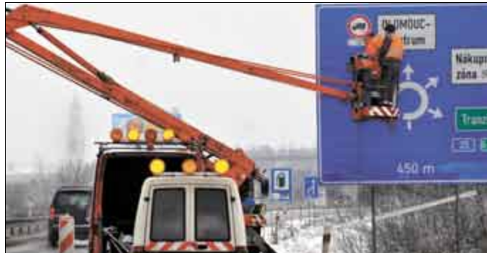
Pracovníci specializované firmy v uplynulých dnech upravili stávající dopravní značení. Na to, zda budou kamiony novou situaci respektovat, by měli dohlížet policisté.

Olomouc • Krajské město Olomouc hodlá přimět řidiče těžkých nákladních automobilů, aby začali využívat západní obchvat. Ten byl sice otevřen už v listopadu 2007, ale kamiony si přesto stále krátily cestu po vnitřním obchvatu města. Radnice se proto rozhodla uzavřít zhruba kilometrový úsek Foerstrovy ulice pro vozidla nad 12 tun. Zákaz začal platit 13. ledna a na jeho dodržování budou pravidelně dohlížet policisté. Zda se opat-