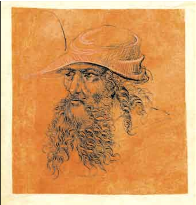
Na výstavě je k vidění zhruba 250 exponátů z rozsáhlých kroměřížských sbírek. Jedním z vystavovaných děl je Studie muže s plnovousem a čepicí od Albrechta Dürera z konce 15. století.

Když už jste zmínil Tiziana, je pravda, že jeho obraz Apollo