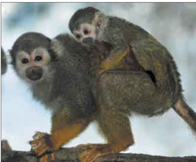
Mláďe sympatického opičích druhů – kotula veverovitá – přišlo v zoologické zahradě na Svatém Kopečku na svět v prvních hodinách nového roku.

Olomouc, Svatý Kopeček - Společný výběh pro šelmy by měl vzniknout vedle populárního „safari“ s makaky. Financován bude z investičního fondu zoo a stát by měl přibližně sedm milionů korun. „Uvidíme, jak se dva rozdílné živočišné druhy snesou. Podle odborníků by to mělo