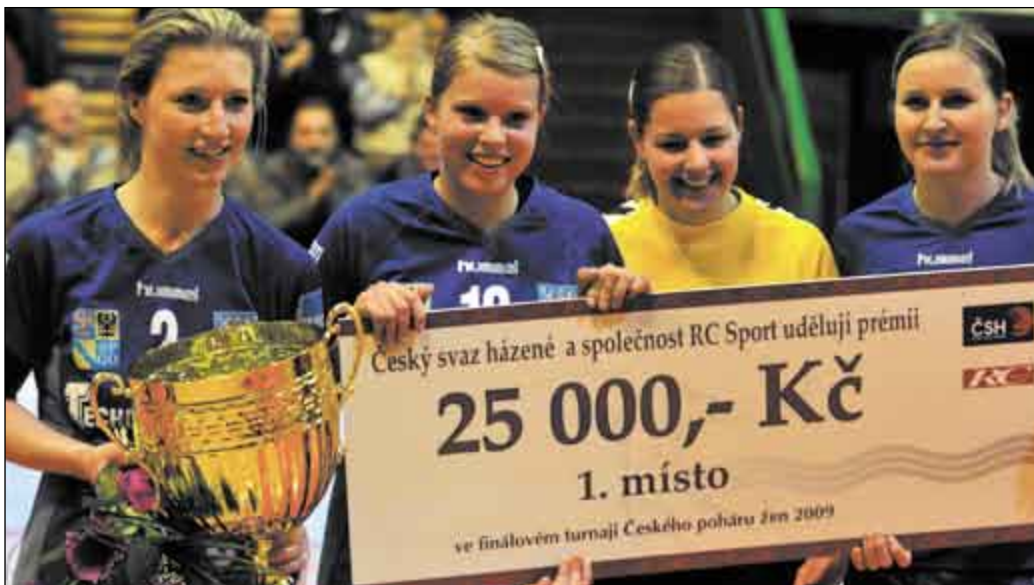
Házenkářkám týmu Zora Olomouc se v Českém poháru dařilo i v letošním roce.

Olomouc • Pikanterií byl fakt, že čtvrtým „do party“ byl domácí celek SCM, ve kterém se snoubí dravé mládí a zkušenost někdejších opor Zory natolik, že prvotní tým dokázal kvalifikačními boji dojít až mezi nejlepší pohárový kvartet. Po vánoční přestávce a pouze s omezeným kádrem juniorek už na nejlepší nestačil, když v semifinále Hanačky držely jakž takž krok pouze v prvním poločase (14:11). Konečný výsledek 35:19 je až krutý, pro mladé hráčky jde ale o velkou zkušenost. První tým Zory v soutěži obhájoval loňské prvenství ze Zlína, už v semifinále ale stál nejtěžší soupeř. Týmu Veselí se