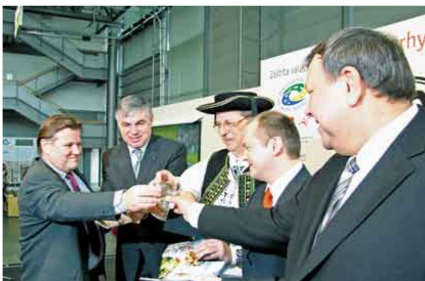
Přípitkem kvalitní slivovici pokřtili politici novou praktickou publikaci pro turisty.

součást kulturních tradic. „Brožura nechce produkty jen popisovat, má sloužit i jako praktická pomůcka pro plánování pobytu v Jihomoravském, Moravskoslezském, Olomouckém a Zlínském kraji. Obsahuje návrhy konkrétních tras, na nichž se turisté mohou seznámit s tradicemi a ochutnat některé regionální produkty“, doplnil hejtmán. Zájemci tak mají například možnost zvolit si konkrétní program spojený s ochutnávkou piva, sýrů, koláčů či pečiva. Novin-kou letošního společného materiálu moravských krajů jsou konkrétní recepty na přípravu kulinařských specialit. Recepty byly vybrány tak, aby bylo možné využít běžně dostupné suroviny, což usnadní práci například