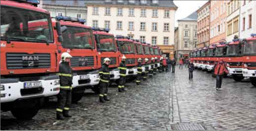
Devětadesát nejmodernějších zásahových vozidel převzali na olomouckém Horním náměstí zástupci hasičských záchranných sborů z celé republiky.

Olomoucký kraj • Moderní techniku za více než 352 milionů korun převzali představitelé hasičských záchranných sborů všech krajů a hlavního města Prahy, cisternovou automobilovou stříkačku získalo také Odborné učiliště požární ochrany z Frýdku - Místku. Nově pořízené zásahové požární automobily (jde o 57 cisternových automobilových stříkaček a dvě automobilové plošiny) u jednotek požární ochrany nahradí starší opo-