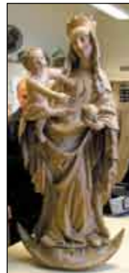
Cholinská madona.

došlo mimo jiné k odstranění barokní polychromie – tedy barevného povrchu. Zásah kulturní památku významně znehodnotil. Vídeňský soud loni rozhodl o navrácení díla zpět do ČR. V neděli 1. února ve 14:00 hodin bude soška slavnostně uvítána fankou při mši svaté v kostele Nanebevzetí Panny Marie v Cholině, kterou bude sloužit arcibiskup olomoucký Jan Graubner. Cholinská madona se poté přesune do restaurátorské dílny. Socha pochází z první čtvrtiny 15. století, autor je neznámý. Jedná se o kvalitní dřevorezbu v gotickém stylu o rozměrech 120 x 50 cm, její hodnota je vyčíslena přibližně na 4 miliony korun. (mg)