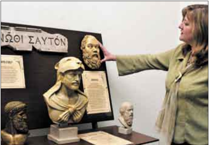
Výstavu Doteky věčné krásy ocení nejen nevidomí, ale všichni, kteří si exponáty rádi osahají.

Olomouc • Co je důležité, je očím neviditelné. Pravdivost tohoto tvrzení Malého prince si ověří všichni, kdo se nechají zlákat na výstavu archeologických reprodukcí s poetickým názvem Doteky věčné krásy. Ta potrvá v prostorách pobočky Knihovny města Olomouce na Brněnské ulici (Knihovna Antonína Šprince) do 27. února. Smyslem je názorným způsobem zprostředkovat nejen nevidomým představy našich předků o kráse. Akce byla původně určena těm, kdo „vidí“ rukama, tedy nevidomým. Brzy si ale podle organizátorů – olomoucké kulturní