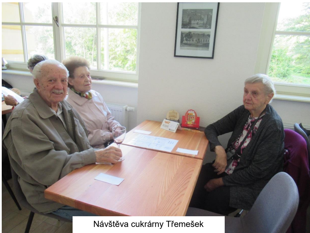
Návštěva cukrárny Třemešek