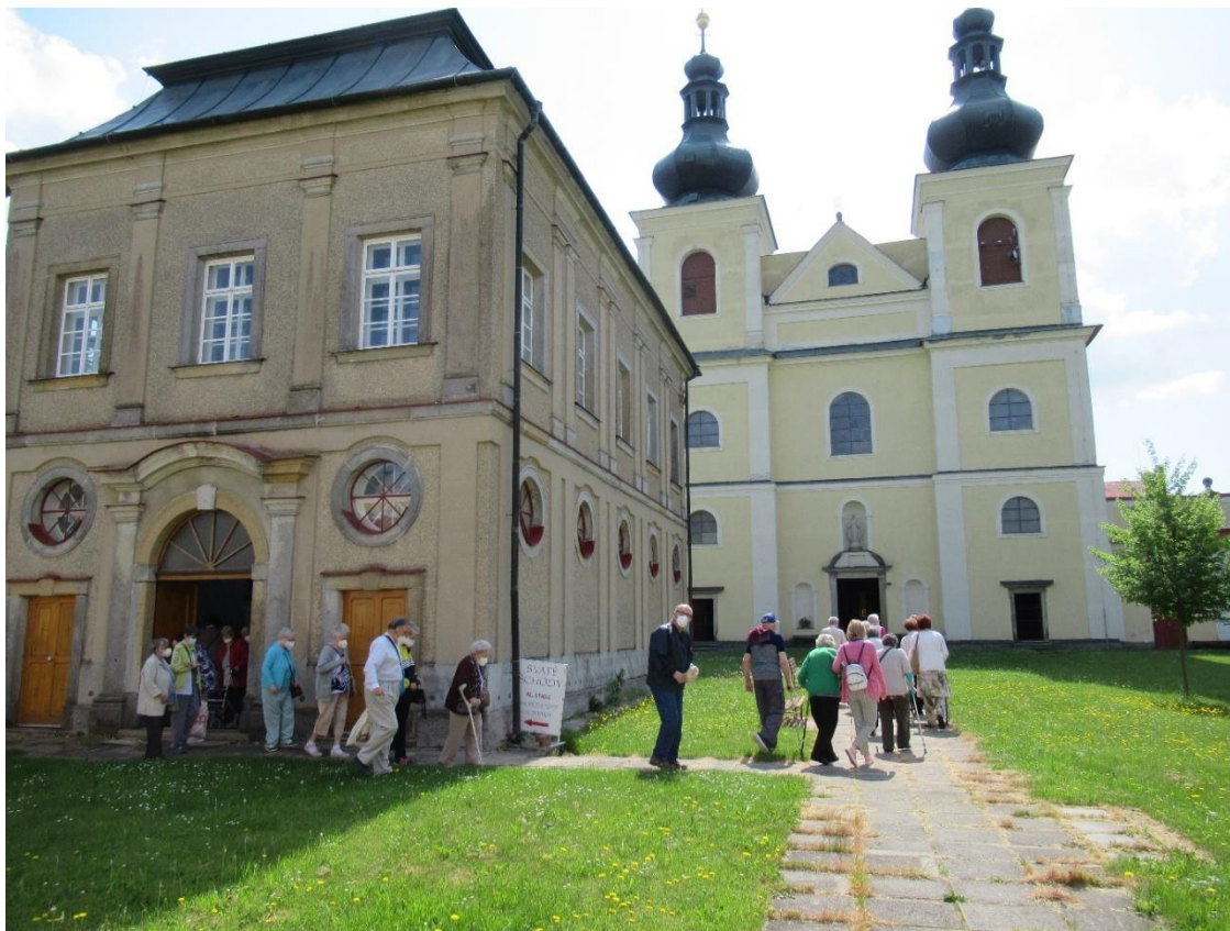
Výlet na Horu Matky Boží v Králíkách