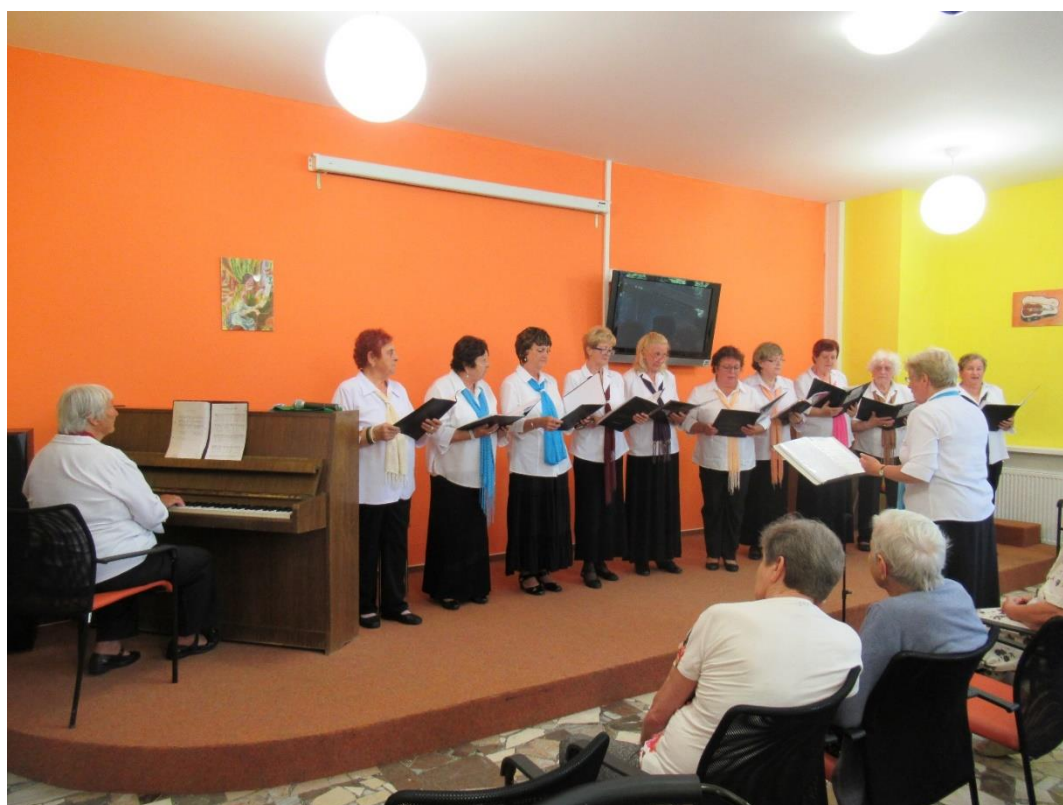
Vystoupení Seniorky Šumperk